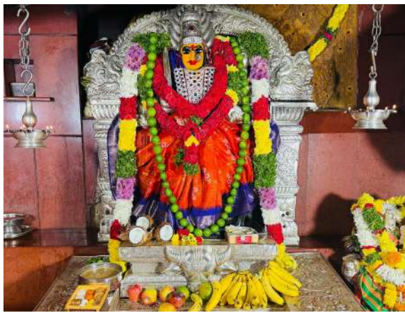
దుర్గానామస్మరణలతో అత్యంత భక్తిశ్రద్ధలతో ప్రమిదలను వెలిగించారు. కొందరు భక్తులు అమ్మవారి సన్నిధిలోని మంజీరీలో దీపాలను వదిలారు. భక్తులు పెద్ద ఎత్తున అమ్మవారిని

శ్రీ ఏడుపాయల వనదుర్గాభవానీ మాత అమ్మవారి పుణ్యక్షేత్రంలో అమావాస్య చివరిరోజు పవిత్ర కార్తీకపౌర్ణమి దీపావళి వైభవోపేతంగా ముగిసింది. ఏడుపాయల వనదుర్గాదేవి అమ్మవారి ప్రధాన ఆలయ సన్నిధిలో శివుని అలంకారం చుట్టూ దీపాలంకరణ సేవ ఘనంగా జరిగింది. వనదుర్గాదేవి అమ్మవారికి ఈ ఓ ప్రత్యేక పూజలు నిర్వహించి, అఖండదీపావళి వానికి జ్యోతిప్రజ్వలన చేశారు. వేలాదిభక్తులు పవిత్ర కార్తీక చివరి రోజు కావడంతో పెద్దఎత్తున యాత్రికులు ఏడుపాయలకు తరలిరావడంతో భక్తులతో జనసంద్రంగా మారింది. దుర్గమ్మకు అర్చకులు పూజలు చేయగా, భక్తులు దర్శించుకున్నారు. విశేషముగా తరలివచ్చిన భక్తులు అమ్మవారికి ప్రత్యేకంగా అత్యంత భక్తిశ్రద్ధలతో దీపాలను వెలిగించారు. భక్తులు అమ్మవారిని దర్శించుకుని కార్తీక బోనాలు, కుంకుమార్చన, విశేషాలంకరణ పూజలు నిర్వహించారు. దుర్గాదేవి అమ్మవారిని కార్తీకపౌర్ణమి అమావాస్య సందర్భంగా ప్రత్యేకంగా ఆలయ అర్చకులు వివిధ రకాల పూలు, పండ్లు తో అత్యంత సుందరంగా అలంకరించారు. ఏడుపాయల ప్రాంగణం, పరిసరాలు భక్తులు వెలిగించిన దీపాలతో, విద్యుత్ కాంతులతో దగ్దగలాడింది. సుదూర ప్రాంతాల నుండి తరలివచ్చిన మహిళలు