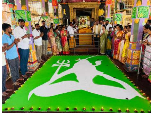
దర్శించుకొని ఒడిబియ్యం, కొబ్బరికాయలు సమర్పించి మొక్కులను తీర్చుకున్నారు.