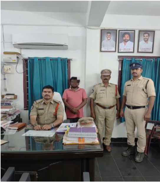
అక్షర విజేత మంగళగిరి: