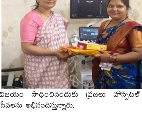
విజయం సాధించినందుకు ప్రజలు హాస్పిటల్ సేవలను ఆభినందిస్తున్నారు.