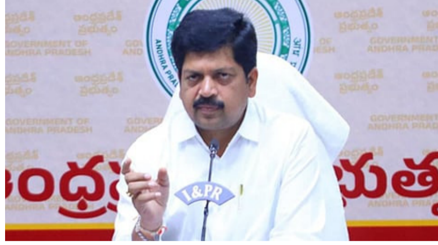
చేశామని తెలిపారు. మద్దతు నాణ్యతను పరీక్షించి, ప్రజలకు

గుంటూరు జిల్లా రాష్ట్రంలో ఎర్రజేత కాలంలో గణనీయమైన మార్పులు తీసుకువచ్చామని మంత్రి కొల్లు రవీంద్ర తెలిపారు. కూటమి ప్రభుత్వం అధికారంలోకి వచ్చిన తర్వాత మద్దతు నియంత్రణ, నాణ్యత విషయంలో ప్రత్యేక చర్యలు చేపట్టామని పేర్కొన్నారు. వైసీపీ పాలనలో రాష్ట్రంలో నాసికరం మద్దతు సేవించి అనేక మంది అనారోగ్యానికి గురయ్యారని, దాదాపు 30 వేల మంది ప్రాణాలు కోల్పోయారని అన్నారు. జగన్ రెడ్డి పాలనలో సరైన ట్రాన్స్లండ్ అందుబాటులో లేక ప్రజలు ఇతర రాష్ట్రాల నుంచి మద్దతు తెచ్చుకుని తాగాల్సి వచ్చిందని విమర్శించారు. దేశంలోనే అతిపెద్ద మద్దతు స్కామ్ వైసీపీ ప్రభుత్వంలోనే జరిగిందని, దాదాపు రూ.3,500 కోట్ల అనినీతి జరిగిందని ఆరోపించారు. ప్రస్తుత కూటమి ప్రభుత్వం మద్దతు నియంత్రణలో కట్టుదిట్టమైన చర్యలు తీసుకుంటోందని తెలిపారు. ప్రజల ఆరోగ్యాన్ని దృష్టిలో ఉంచుకుని గుంటూరు, కాకినాడ, విశాఖపట్టణం, చిత్తూరు ప్రాంతాల్లో అత్యాధునిక ల్యాబ్లను ఏర్పాటు చేశామని తెలిపారు. మద్దతు నాణ్యతను పరీక్షించి, ప్రజలకు