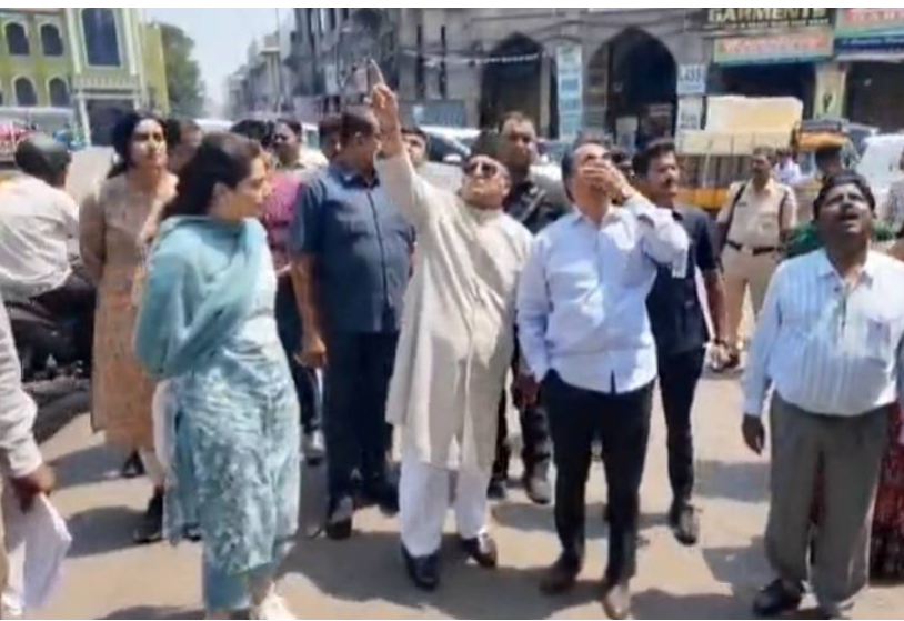
నగర వారసత్వ సంపదపై ప్రత్యేక దృష్టి.