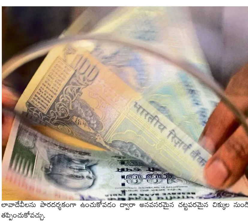
లావాదేవీలను పారదర్శకంగా ఉంచుకోవడం ద్వారా అనవసరమైన చట్టపరమైన చిక్కుల నుండి తప్పించుకోవచ్చు.

మొత్తంలో నగదుతో లావాదేవీలు జరిపే కంటే డిజిటల్ ట్రాన్సాక్షన్లు (ఐఎంఎ, చీజిఎఫ్, ఐఎంఎ) చేయడం ఉత్తమం. డిజిటల్ లావాదేవీలకు పూర్తి రికార్డులు ఉంటాయి కాబట్టి, భవిష్యత్తులో విచారణ ఎదురైనా సులభంగా సమాధానం చెప్పవచ్చు. మీ ఆర్థిక లావాదేవీలను పారదర్శకంగా ఉంచుకోవడం ద్వారా అనవసరమైన చట్టపరమైన చిక్కుల నుండి తప్పించుకోవచ్చు. ఎప్పుడు పడితే అప్పుడు, ఎంత పడితే అంత నగదు జమ చేయడం మీకు చిక్కలు తెచ్చిపెట్టవచ్చు. అక్రమ నగదు చలామణిని అరికట్టేందుకు ఆదాయపు పన్ను శాఖ కొన్ని కఠిన నిబంధనలను అమలు చేస్తోంది. రూ.10 లక్షల పరిమితి జాగ్రత్త! ఒక ఆర్థిక సంవత్సరంలో మీ పొదుపు ఖాతాలో నగదు డిపాజిట్లు రూ.10 లక్షలు దాటితే, బ్యాంకులు ఆ సమాచారాన్ని 'యాన్యువల్ ఇన్ఫర్మేషన్ రిటర్న్' (ఐఎంఎ) ద్వారా ఆదాయపు పన్ను శాఖకు నివేదిస్తాయి. మీరు ఐటీ రిటర్న్ (ఐఎంఎ) దాఖలు చేయకుండా మీ ఆదాయ వనరులకు మించి పెద్ద మొత్తంలో నగదు జమ చేస్తే ఐటీ నోటీసులు వచ్చే అవకాశం ఉంది. ఒకవేళ మీరు ఐటీఆర్ ఫైల్ చేస్తున్నట్లయితే మీ ఆదాయానికి తగ్గట్టుగా ఎంత మొత్తమైనా జమ చేయవచ్చు. కానీ ప్రతి రూపాయికి సరైన ఆధారాలు ఉండాలి. బ్యాంకింగ్ నిబంధనల ప్రకారం.. మీరు ఒకేసారి రూ.50,000 లేదా అంతకంటే ఎక్కువ నగదును డిపాజిట్ చేయాలనుకుంటే తప్పనిసరిగా మీ పాస్ బుక్ వివరాలను సమర్పించాలి. కేవలం ఒకే ఖాతాలోనే కాకుండా ఒకే బ్యాంకులో మీకు ఉన్న వివిధ ఖాతాల్లో చేసే డిపాజిట్ల మొత్తం కూడా ఈ పరిమితి కిందకి వచ్చుంది. ఆధారాలు లేకపోతే భారీ జరిమానా: ఒకవేళ మీకు ఐటీ నోటీసు వస్తే, ఆ నగదు ఎక్కడి నుండి వచ్చింది అనే దానికి తగిన పత్రాలను చూపించాల్సి ఉంటుంది. ఒకవేళ మీరు సరైన సమాధానం చెప్పలేకపోతే, ఆ మొత్తంపై భారీ పన్నుతో పాటు జరిమానా కూడా చెల్లించాల్సి రావచ్చు. నిపుణులు సూచన: పెద్ద