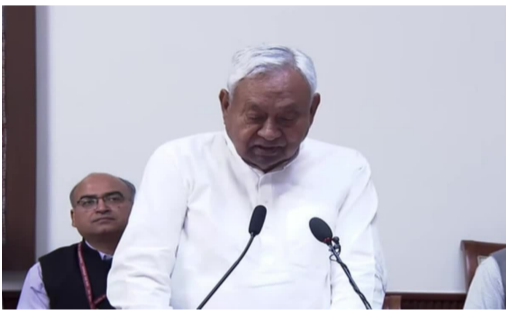
మందలి, లోక్సభ, రాజ్యసభలో పని చేయాననీ నీతీశ్ కుమార్ చిరకాల కోరిక. శుక్రవారం రాజ్యసభ సభ్యుడిగా ప్రమాణం స్వీకారం చేయడంతో ఆయన కల నెరవేరింది. తద్వారా నాలుగు చట్టసభలలో పనిచేసిన అతనికొక్క మంది నాయకులలో ఒకరిగా నీతీశ్ కుమార్ నిలిచారు.

ధీర్ఘ : బహోర్ రాజకీయాల్లో ఒక శకం ముగిసింది. దశాబ్దాల పాటు రాష్ట్ర రాజకీయాలను శాసించిన నీతీశ్ కుమార్ జాతీయ రాజకీయాల్లోకి పునరాగమనం చేశారు. రాజ్యసభ సభ్యుడిగా శుక్రవారం ఆయన ప్రమాణం స్వీకారం చేశారు.