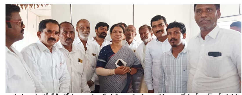
బాధ్యత గ్రామంలో సీసీ రోడ్డు, అంగన్వాడీ, మహిళా సంఘాల భవనాలు లేవు. జి. రామ్ బే పద్దం ద్వారా మౌలిక వసతుల కల్పనలు రాష్ట్ర ప్రభుత్వం వాటా ఇవ్వవలసి.. ఇవ్వడం అంటారు. ప్రోటోకాల్ పాటించకుండా.. మహిళా ఎంపీని ఆయన నన్ను మీరు అవమానిస్తున్నారు అనేదన వ్యక్తం చేశారు భూమి పూజ చేస్తే.. మీకు కచ్చుపు మంట ఎందుకు.? అభివృద్ధి లక్ష్యంగా పని చేసే వ్యక్తిని నేను కునుమ్ పద్దకం కేంద్ర ప్రభుత్వ పద్దకం కదా..? సీఎంసె స్థానిక మంత్రి ఒప్పించలేక.. ఇంకొకటి బిడ్డి.. (ట్రాన్స్ఫర్ బిడ్డి గా మారుతున్నారు. జూరాల భద్రతకు ముప్పు ఉంది.. సస్పే బిడ్డి పెట్టాలన్నారు జూరాల ప్రజల్లో పాలమూరు జిల్లాకు గుండె మంత్రిగా ఉండి.. శ్రీహరి ట్రాన్స్ఫర్ బిడ్డి తేలేరా మీతో పాటు బిడ్డి కోసం సీఎం వద్దకు నేను వస్తూ వందడి. ఆత్మకూరు బిడ్డి వస్తే నాకే మంచిది.. గద్వాల కు వెళ్లేందుకు సమయం తగ్గుతుంది. అరుణమ్మ అభివృద్ధి చేస్తుంది తప్ప.. అభివృద్ధి ఎప్పుడూ అడ్డుకోదు. ఇచ్చిన హామీలు అమలు చేయలేక రాష్ట్రం దివాళా తీసిందని చెబుతున్నారు. ప్రతి ఒక్క పేదవాడు ఆర్థికంగా ఎదగాలని ప్రధాని మోడీ పని చేస్తున్నారు

మంత్రి వాణికి శ్రీహరి చేతకాని పాలన. ప్రోటోకాల్ కి విరుద్ధంగా మంత్రి వాణికి శ్రీహరి శంకుస్థాపన. మంత్రి వాణికి శ్రీహరికి ఎంపీ డీకే అరుణ సవాల్. ఆత్మకూరు చౌరస్తాలో చర్చకు రండి ఆత్మకూరు - కొత్తపల్లి బస్టాప్ అడ్డుకుంటుందని అబద్ధపు ప్రచారం చేస్తున్నారు. బరాబర జూరాల సస్పే బిడ్డి, ఆత్మకూరు ట్రాన్స్ఫర్ బిడ్డి కట్టండి. ఎంపీ డీకే అరుణ