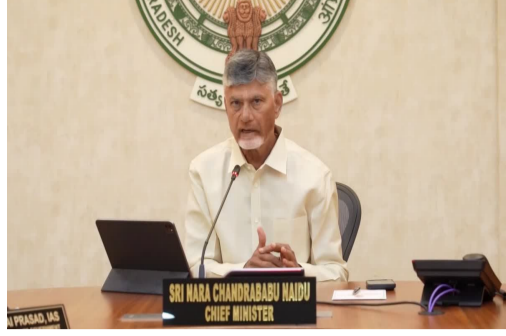
అన్నారు. క్రిమినల్ తో రాజకీయాలు చేసేటప్పుడు చాలా జాగ్రత్తగా ఉండాలని మంత్రులకు సీఎం సూచించారు. ఉప్పది లేనట్లు, లేనిది ఉన్నట్లు ప్రచారం చేసే క్రిమినల్ కుట్రలను మంత్రులు నిత్యం అప్రమత్తంగా ఉంటూ తిప్పికోట్లాటలని సూచించారు.

దాదాపు 3గంటలపాటు సుదీర్ఘంగా సాగింది. కేబినెట్ అజెండా అంతా ముగిసాక మంత్రులతో ముఖ్యమంత్రి చంద్రబాబు పలు అంశాలపై చర్చించారు. జలధార, సూర్యఘర్షణ, పీఎం కుసుమ, పట్టాచార పాస్ పుస్తకాల పంపిణీ, స్వచ్ఛాంద్ర కార్యక్రమాలకు మంత్రులు ఓనర్ షిప్ తీసుకోవాలని ఆదేశించారు.