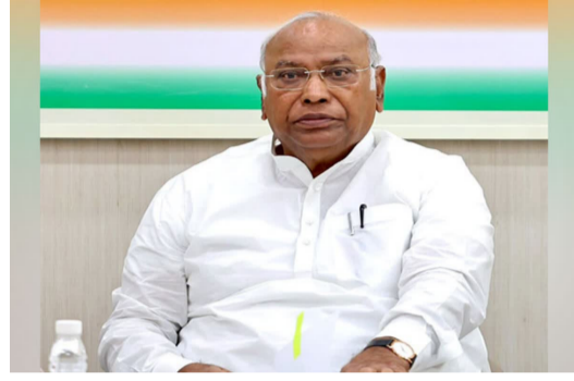
జాగ్రత్తగా వ్యవహరించాలని సూచించింది. వీటితోపాటు పశ్చిమాసియా ఉద్రిక్తతలు గురించి, ఆమెరికా, ఇజ్రాయెల్, ఇరాన్ మధ్య జరిగిన కాబూల విరమణ ఒప్పందం గురించి కూడా సీడబ్ల్యూసీలో కాంగ్రెస్ సమీక్షించింది. ఈ విషయంలో మోదీ ప్రభుత్వం వ్యవహరిస్తున్న తీరుపై మండిపడింది.

నుంచి 816కు పెంచి, అందులో 273 స్థానాలను మహిళలకు కేటాయించేలా బిల్లులు పెట్టనున్నారు. కాగా, 2029 ఎన్నికల నాటికి మహిళా రిజర్వేషన్లు అమలు చేసేందుకు, లోక్ సభ స్థానాలకు పెంచేందుకు సంబంధించిన ముసాయిదా బిల్లులకు కేంద్ర మంత్రివర్గం బుధవారం ఆమోదం తెలిపినట్లు సమాచారం.