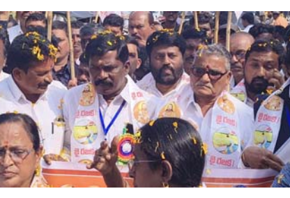
ఉత్తేజ (శ్రీశైలం ప్రతినిధి)