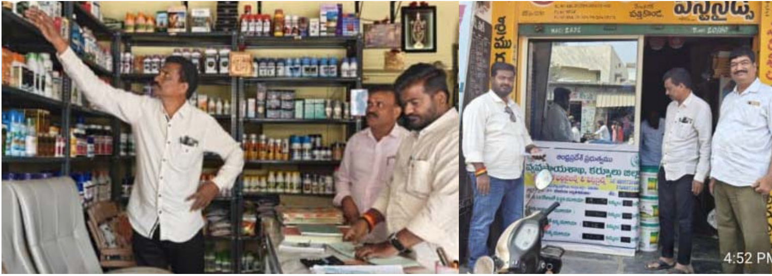
కర్నూలు జిల్లా ఉత్తేజ ప్రతినిధి

పత్తికొండ డిసెంబర్ 29 సోమవారం ఎరువులను అమ్మే డీల్లర్లు అందరికీ తెలియజేయమని ఏమనగా ఎరువులను అధిక ధరలకు అమ్మి కంటే ఎక్కువ అమ్మిన ఎరువులను పక్కదారి మళ్లించిన ఎరువుల కొనుగోలుదారులకు రక్షిత లేకుండా అమ్మిన ఎరువులతో పాటు ఇతర వాటిని అంటగట్టిన డీల్లర్లపై కఠిన