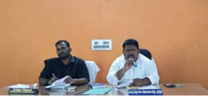
బేతంపల్లి, ఉత్తేజ ప్రతినిధి: