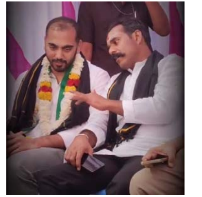
కర్నూలు జిల్లా ఉత్తేజ ప్రతినిధి