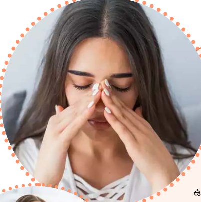
సైన్స్ ఉంటే ముక్కు మూసుకుపోయి శ్వాస తీసుకోవడంలో ఇబ్బందిగా ఉంటుంది. ఇది చరికాలంలో మరింత ఎక్కువ అవుతుంది. అలాంటి సమస్యకి చెక్ పెట్టాలంటే ఈ ఆసనాలు హెల్ప్ చేస్తాయి. అవేంటో తెలుసుకోండి. మన శ్వాసకోశ వ్యవస్థ ఆరోగ్యంగా ఉంటేనే మనం హెల్తీగా ఉండగలం. కానీ, కొన్ని సమస్యల కారణంగా శ్వాస సమస్యలు వస్తాయి. అందులో సైన్స్ కూడా ఒకటి. దీని వల్ల ముక్కు రంధ్రాలు మూసుకుపోతాయి. దీనిని అస్సలు తెలిగ్గా తీసుకోలేం. కానీ కొన్ని యోగాసనాలతో సైన్స్ సమస్యని పరిష్కరించుకోవచ్చు. సేత బంధాసనం.. ఇది బ్రిడ్జ్ పోజ్ అని చెప్పొచ్చు. దీనిని చేయడం వల్ల బ్లాక్, కాళ్ళను బలంగా చేస్తుంది. మీ గొంతు, ఛాతీని క్లియర్ చేస్తుంది. మూసుకుపోయిన ముక్కు నుండి ఉపశమనం పొందేలా చేస్తుంది. ప్రాణాయామం.. ఇందులో ముఖ్యంగా అనులోమ, వీలోమ, కపాలాభిరి వంటి ప్రాణాయామ పద్ధతులు నాసికా రంధ్రాలను క్లియర్ చేస్తాయి. వీటిని చేయడం వల్ల శ్వాస ప్రక్రియలు నియంత్రిస్తాయి. ఊపిరితిత్తుల సామర్థ్యాన్ని పెంచుతుంది. దీంతో ఆక్సిజన్ సరఫరా పెరిగి సమస్యకి పరిష్కారం లభిస్తుంది. భుజిగాసనం.. ఇది మీ ఛాతీని ఎక్స్టెండ్ చేసి సైన్స్ సమస్యల నుండి రిలాక్స్ చేసే వాగు పామ భంగిమ. దీనిని చేయడం వల్ల ఛాతీ ఎక్స్టెండ్ అయి వెన్నెముకని బలంగా చేసి వెన్నెముకపైని కూడా తగ్గిస్తుంది. ఛాతీలో ఇబ్బంది తగ్గడంతో సైన్స్ కూడా తగ్గుతుంది. పర్వతాసనం.. ముక్కు రంధ్రాలను క్లియర్ చేసి మంట నుండి రిలాక్స్ చేసేలా చేస్తుంది. దీనిని చేయడం వల్ల భుజాలు, చేతులు చాలి చేయొచ్చు. దీని వల్ల సైన్స్ వంటి సమస్యలు దూరమవుతాయి.

చేస్తుంది. అతి ఏదైనా హాని చేస్తుందని గుర్తుంచుకోండి. ముఖాన్ని శుభ్రం చేసుకోవడం.. ముఖాన్ని శుభ్రం చేసుకోవడం.. కొంతమంది ముఖం శుభ్రం చేసుకోకముందే.. ఫేస్ ప్యాక్ అపై చేస్తుంటారు. మీ ముఖాన్ని సరిగ్గా శుభ్రం చేసుకోవడం.. ఫ్యాస్ట్ అపై చేస్తే.. ఉబ్బిల్లి సమర్థవంతంగా చర్మంలోని వెజ్జరు. దీనివల్ల ఫ్యాస్ట్ ఎఫెక్టివ్గా పనిచేయదు. ఏదైనా ఫేస్ ప్యాక్ వేసుకునే ముందు మీ ముఖాన్ని శుభ్రం చేసుకోవడం మర్చిపోవద్దు. ఫ్యాస్ట్ వేసి ఎక్కువసేపు ఉంచుకోవద్దు. కొందరు ఫేస్ ప్యాక్ అపై చేసి.. ఎక్కువసేపు ఆరనిస్తారు. ఇలా చేస్తే.. చర్మానికి చికాకు కలిగిస్తుంది. అంతమీరు, చర్మంలోని సహజ నూనెలు కోల్పోతాయి. మీరు ఫ్యాక్ ఆరిన వెంటనే శుభ్రం చేయడం చాలా ముఖ్యం.