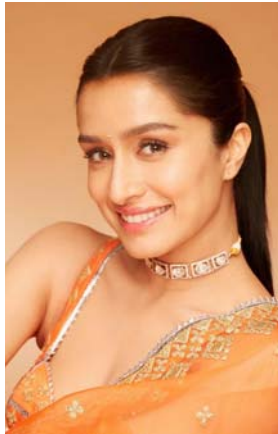
నీటి త్రాడ్డకప్పులకు గాయం నీటి త్రాడ్డకప్పు ప్రస్తుతం 'తలలో నడిస్తోన్న సందర్భంగా ఇటీవల ఈ సినిమా షూటింగ్లో అమె కాలుకు గాయమైంది. దీంతో అభిమానులు ఆందోళన చెందారు. తాజాగా తన హెల్త్ అప్డేట్ను క్రెడ్ట పంచుకున్నారు. విశ్రాంతి తీసుకుంటున్నట్లు తెలిపారు. ఒక అభిమాని గాయం ఎలా ఉందని పోస్ట్ పెట్టగా దానికి అమె రిపై ఇచ్చారు. 'సెట్ డెబ్బి ఏం కాదు.. కాబి కందరానికి డెబ్బి తగిలి కొంచెం ప్రాక్చర్ అయింది. దాక్చర్లు విశ్రాంతి తీసుకోవచ్చు. నేను క్షేమంగానే ఉన్నా'

గారు, ప్రభాస్ ది రాజు సాబ్, రవితేజ భర్త మహాశయులకు విజ్ఞప్తి, విజయ్ జన నాయగన్, శర్వానంద్ నారీ నారీ నడుమ మురారి లైన్ లో ఉన్నాయి. ఇక ఇన్ని సినిమాలతో పోటీ తట్టుకోలేక రాజుగారు డ్రాప్ అయ్యారని, సంక్రాంతి రేసు నుంచి నవీన్ తప్పుకున్నాడని వార్తలు వస్తున్నాయి. అందుకే ప్రమోషన్స్ కూడా మధ్యలోనే ఆపేశారని సమాచారం. త్వరలోనే ఈ విషయాన్ని మేకర్స్ అధికారికంగా తెలపనున్నారు.