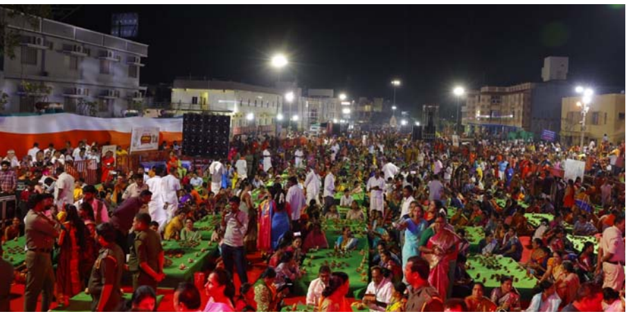
ఉత్తేజ (శ్రీశైలం ప్రతినిధి)