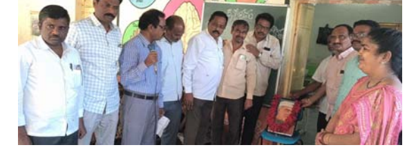
ఉత్తేజ ప్రతినిధి నందికొట్కూరు నవంబర్ 14 :