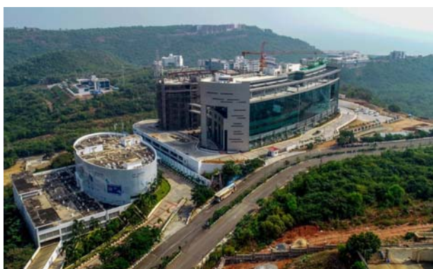
విశాఖపట్టణంలోనే పెట్టుబడులు పెట్టేందుకు ఆసక్తి చూపినవారూ.. తాజాగా వీటికి ఏపీ ప్రభుత్వం భూములు కేటాయించింది. ఆంధ్రప్రదేశ్ స్టేట్ ఇన్వెస్ట్మెంట్ ప్రమోషన్ బోర్డులో తీసుకున్న నిర్ణయం మేరకు ఐదు ఐటీ కంపెనీలకు భూములు కేటాయిస్తూ ప్రభుత్వం ఉత్తర్వులు జారీ చేసింది. విశాఖపట్టణంలో ఈ ఐదు కంపెనీలు కలిపి రూ.19,223 కోట్లు

వివేక: పెట్టుబడులు పెట్టేందుకు మరో ఐదు ఐటీ కంపెనీలు ముందుకు వచ్చాయి. ఈ నేపథ్యంలో విశాఖపట్టణంలో ప్రభుత్వం వీటికి భూములు కేటాయించింది. ఐదు కంపెనీలు కలిపి రూ.19 వేలకు పైబిలుకు పెట్టుబడులు పెట్టనున్నాయి. ఈ పెట్టుబడుల ద్వారా సుమారుగా 50 వేల మందికి ఉద్యోగ, ఉపాధి అవకాశాలు దక్కుతాయని అధికారులు చెప్పారు. ఐదు ఐటీ సంస్థలు కూడా విశాఖ కేంద్రంగా పెట్టుబడులు పెనుతున్నాయి. మరోవైపు ఇప్పటికే డీసీఎస్, కాగ్నెంట్ వంటి సంస్థలు విశాఖలో పెట్టుబడులు పెట్టేందుకు ముందుకు వచ్చిన సంగతి తెలిసింది. ఆంధ్రప్రదేశ్ రాష్ట్రానికి మరో ఐదు ఐటీ కంపెనీలు రానున్నాయి. ఇప్పటికే డీసీఎస్, కాగ్నెంట్ వంటి ప్రతిష్టాత్మక సంస్థలు ఏపీలో పెట్టుబడులు పెట్టేందుకు ముందుకు వచ్చాయి. ఏపీ ఆర్థిక రాజధాని విశాఖపట్టణంలో డీసీఎస్, కాగ్నెంట్ క్యాంపస్లు ఏర్పాటు చేయనున్నాయి. తాజాగా మరో ఐదు ఐటీ కంపెనీలు ఏపీలో పెట్టుబడులు పెట్టనున్నాయి. ఈ ఐదు కంపెనీలు కూడా