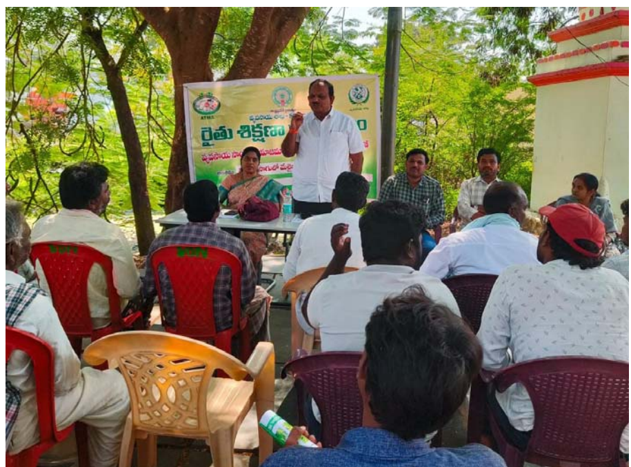
సి.బెళగల్ ఉత్తేజ స్కూన్ నవంబర్ 14