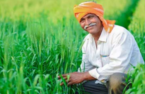
సమస్యల్ని పరిష్కరించాలని అధికారుల్ని ముఖ్యమంత్రి చంద్రబాబు ఆదేశించారు. ఆర్థిక ఉన్న ప్రతి ఒక్కరికీ అన్నదాత సుఖభవ పథకం అందిస్తామన్నారు. అధికారులు కూడా రైతుల సమస్యల్ని పరిష్కరించే పనిలో ఉన్నారు.. డబ్బులు రానివారు అందోళన చెందాల్సిన అవసరం లేదని.. మరో అవకాశం ఉంటుందన్నారు. అన్నదాత సుఖభవ పథకానికి సంబంధించిన డబ్బులు వచ్చాయే లేదో తెలుసుకోవడానికి స్టేట్స్ వెబ్సైట్లో వెబ్సైట్లో అందుబాటులోకి తీసుకొచ్చింది. దీని కోసం రైతులు ప్రభుత్వ వెబ్సైట్లో https://anna-dathasukhibhava.ap.gov.in లోకి వెళ్లి.. వెబ్సైట్లో అప్డేట్ క్లిక్ చేయాలి. రైతు తన ఆధార్ నంబర్ నమోదు చేసి.. పక్కనే ఉండా కాపాసు

వివేక: ప్రభుత్వం అన్నదాత సుఖభవ పథకం కింద రైతులకు ఆర్థిక సహాయం అందిస్తోంది. ముఖ్యమంత్రి చంద్రబాబు చేతుల మీదుగా ఈ పథకం ప్రారంభమైంది. అయితే రైతులు ప్రభుత్వ వెబ్సైట్లో ఆధార్ నంబర్ ద్వారా ఆకౌంట్లో డబ్బులు పడ్డాయే లేదో స్టేట్స్ తెలుసుకోవచ్చు. ఈ పథకం కింద రైతులకు ఏటా రూ.20 వేలు ఆర్థిక సహాయం అందుతుంది. రైతులు స్టేట్స్ ఎంబీబీ వెబ్సైట్లో అంటే.. ఆంధ్రప్రదేశ్ ప్రభుత్వం అన్నదాత సుఖభవ పథకాన్ని ప్రారంభించింది. ముఖ్యమంత్రి చంద్రబాబు చేతుల మీదుగా.. ప్రకాశం జిల్లా దర్శి నియోజకవర్గం వీరాయపాలెంలో అన్నదాత సుఖభవ పథకానికి శ్రీకారం చుట్టారు. రాష్ట్రంలోని 46,85,838 మంది రైతులకు 'అన్నదాత సుఖభవ' పథకం కింద ఏటా రూ.20 వేల చొప్పున ఆర్థిక సహాయం అందుతుంది. మొదటి విడతగా రూ.7 వేల రైతుల ఖాతాల్లో జమ చేస్తున్నారు. ఈ పథకం కోసం రాష్ట్ర ప్రభుత్వం రూ.2,342.92 కోట్లు, కేంద్ర ప్రభుత్వం రూ.831.51 కోట్లు అందిస్తున్నాయి. లబ్ధిదారుల జాబితాలో పేరు లేని రైతులు 155251 తోకే ప్రీ నంబర్లో ఫోన్ చేసి ఫిర్యాదు చేయవచ్చు. చాలామందికి ఆధార్, వెబ్సైట్లో సహజ పలు సమస్యలతో ఇబ్బందిపడు తున్నారు. వెంటనే ఆ