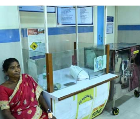
నుంచి ఫీడ్బ్యాక్ తీసుకోవడానికి ఐబీఆర్ఎస్ విధానాన్ని ఉపయోగిస్తున్నారు. ప్రైవేట్ అనుపత్రుల్లో ఎక్కువ డబ్బులు వసూలు చేస్తే ఫిర్యాదు చేయచ్చు. డబ్బులు ఎక్కువగా తీసుకుంటే ఫిర్యాదు చేయదాల్సింది 104, 14400 లోకే ప్రీ నంబర్లు ఉన్నాయి. అలాగే ప్రధాన మంత్రి జన ఆరోగ్య యోజన కార్డులు ఉన్నవాళ్లకి దేశంలో ఎక్కడా.. ఒప్పుందం ఉన్న అనుపత్రుల్లో వైద్యం చేయించుకోవచ్చు.

ఉచిత వైద్యం వర్తిస్తుంది. 12 ఎకరాల లోపు మాగాణి భూమి, 35 ఎకరాల లోపు మొట్ట భూమి ఉన్న రైతులు ఈ పథకానికి అర్హులు. మాగాణి, మొట్ట కలిపి 35 ఎకరాల లోపు ఉన్నా కూడా అర్హులే. శాశ్వత ఉద్యోగులు, పెన్షన్లపై కాకుండా రూ.5 లక్షల లోపు వార్షిక ఆదాయం ఉన్న ఇతర ఉద్యోగులు కూడా ఈ పథకంలో చేరవచ్చు. కుటుంబానికి ఒక కారు ఉన్నా సమస్య లేదు. మున్సిపాలిటీలు, కార్పొరేషన్ పరిధిలో 3వేల చదరపు అడుగుల కంటే తక్కువ అన్ని పన్ను చెల్లింపే వారు కూడా పేర్లు నమోదు చేసుకోవచ్చు అని అధికారులు తెలిపారు. (ట్రస్ట్ పరిధిలోని అనుపత్రుల్లో ఆరోగ్యమిత్రల వ్యవస్థ రోగులకు ఉచిత సేవలు అందిస్తుంది. ఆరోగ్యమిత్రల ఉచితంగా సేవలు అందిస్తారు. డిస్కాల్డ్ అయ్యారే రవాణా ఛార్జీలు కూడా ఇస్తారు. రోగులు