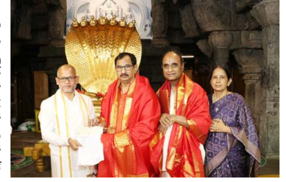
తిరుపతి, ఉత్తేజ ప్రతినిధి, ఆగస్టు 12