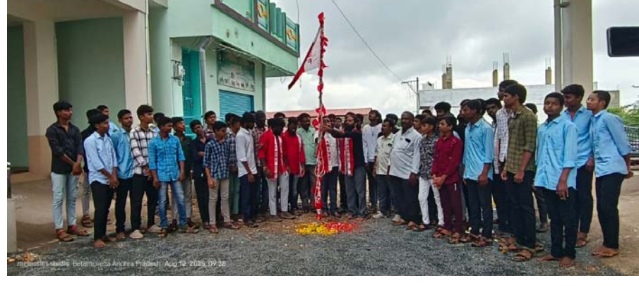
బేతంచర్ల : ఉత్తేజ ప్రతినిధి :