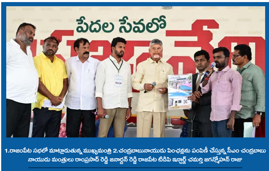
1.రాజంపేట సభలో మాట్లాడుతున్న ముఖ్యమంత్రి 2. చంద్రబాబునాయుడు పంచును పంపిణీ చేస్తున్న సీఎం చంద్రబాబు నాయుడు మంత్రిలు రాంప్రసాద్ రెడ్డి జనార్ధన్ రెడ్డి రాజంపేట టీడిపి ఇన్చార్జ్ చమ్రా జగదీశ్వర్ రాజు