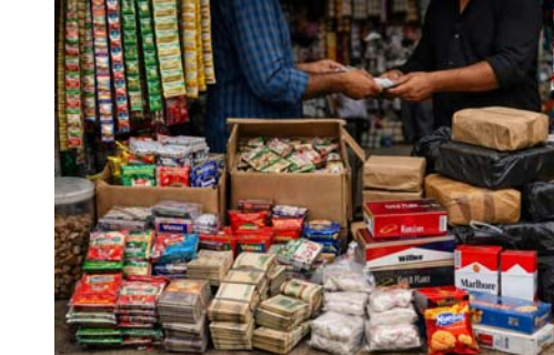
పల్నాడు ప్రతినిధి, ఉదయం న్యూస్, ఏప్రిల్ 14 :

పల్నాడు జిల్లాలో గురజాల, మాచర్ల అసెంబ్లీ నియోజకవర్గాలలో మంచినీరు దొరకని పావులు ఉన్నాయేమో గానీ గుట్టా ఖైసీ ప్యాకెట్స్ లేని పావులు లేవనీ అతిశయోక్తి కాదు. ప్రజలు ఆలోచ్యతరత రీత్యా ప్రభుత్వం గుట్టా ఖైసీ ప్యాకెట్లను నిషేధిస్తే గుట్టా ఆక్రమ విక్రయదారులకు ఇదొక వరంగా మారింది. వీటిని యదేచ్ఛగా, గుట్టువప్పుడు కాకుండా అమ్మకాలు కొనసాగిస్తూ ఒక్కొక్క ప్యాకెట్ ధరను వది రెట్లు పెంచి జీవితో సాములు నింపుకుంటున్నారని. కొంతమంది ఇదే అదనుగా నకిలీ గుట్టా ప్యాకెట్లను సైతం విక్రయించడం కలవరపరచే విషయం, పోలీసులు అడపాదడపా కేసులు నమోదు చేస్తున్నా వాటి ప్రభావం గుట్టా విక్రయదారులపై ఎంతమాత్రం లేదు. గతంలో పోలీసులు ప్రత్యేక దృష్టి సారించి గుట్టా విక్రయదారులను పట్టుకుని, ఈసారి విక్రయించినట్లు తెలిస్తే మీ ఆస్తులు జప్తుచేస్తామని సాచ్చరించి అప్పట్లో కేసులు నమోదు చేశారు. ఆ తర్వాత ఎక్కువగా వారిపై దృష్టి పెట్టబోవడంతో గుట్టా రాయ్లు భయపడక పట్టణంలో యిథేచ్ఛగా తమ పని చేసుకుంటున్నారు. పోలీసులు దాడుల తర్వాత వ్యాపారులందరూ ఒక సిండ్కేట్ గా మారి రెండు నియోజకవర్గాలలోని మట్టుపక్కల మండలాల్లో యిథేచ్ఛగా వ్యాపారాన్ని సాగిస్తున్నారు. ఈ గుట్టా విక్ర యానికి ప్రధాన రవాణాగా షాఫ్ లకు సిగరెట్ ప్యాకెట్ లు , కుర్చురే యాని ప్యాకెట్ లు వేసి కొంతమందిని ఎంచుకుని, అసమానం రాకుండా తరిగిస్తున్నారు.