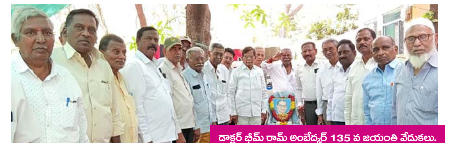
డాక్టర్ భీమ్ రామ్ అంబేద్కర్ 135 వ జయంతి వేడుకలు.