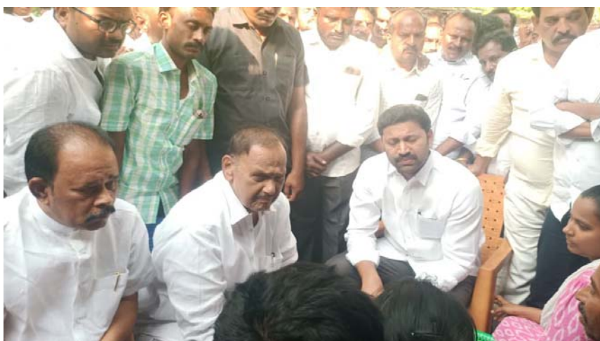
కడప బ్యారో ఉదయం ప్రతినిధి