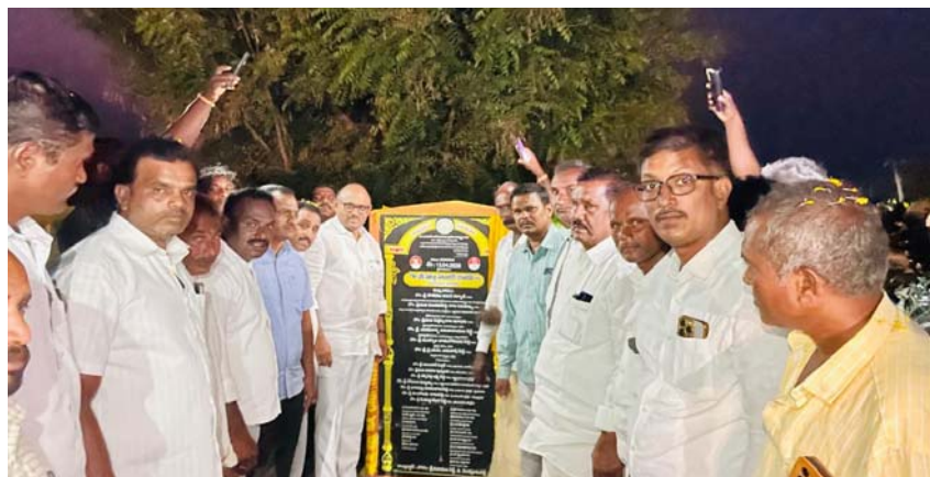
కడప బ్యారో ఉదయం ప్రతినిధి