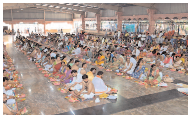
కాణిపాకం, సెప్టెంబర్ 10 స్వర్ణ సాగరం