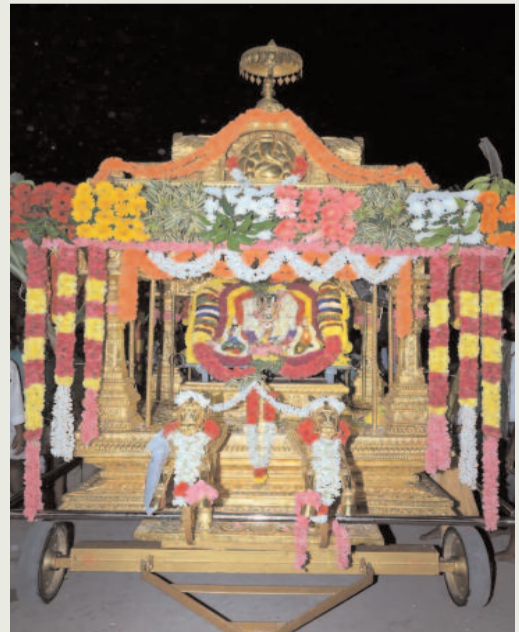
కాణిపాకం, సెప్టెంబర్ 10 స్వర్ణ సాగరం

వైభవంగా స్వర్ణ రథం పై భక్తులకు దర్శనం ఇచ్చిన జననాథుడు. కాణిపాకం శ్రీ వరసిద్ధి వినాయక స్వామి వారి దేవస్థానం నందు బుధవారం రాత్రి సంతకహర చతుర్థి సందర్భంగా శ్రీ స్వామివారికి వైభవంగా సాయంత్రం వైభవంగా ఆలయ మాడా వీధుల్లో స్వర్ణ