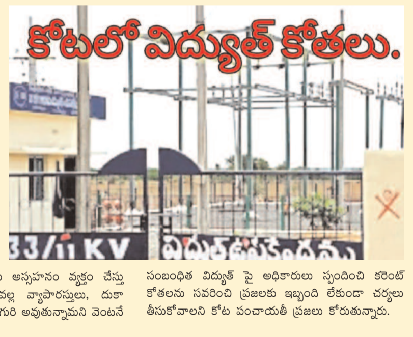
కోటలో విద్యుత్ కోతలు. సంబంధిత విద్యుత్ పై అధికారులు స్పందించి కరెంట్ కోతలను సవరించి ప్రజలకు ఇబ్బంది లేకుండా చర్యలు తీసుకోవాలని కోట పంచాయతీ ప్రజలు కోరుతున్నారు.

కోతలకు అడ్డు ఆపు లేకుండా పోతుందని ఈ కరెంట్ కోతల తో వ విసిగిపోతున్నామని కోట పంచాయతీ ప్రజలు వాపోతున్నారు. కరెంట్ ఏ సమయంలో పోతుందో ఏ సమయంలో వస్తుందో తెలియని అయోమయ పరిస్థితుల్లో, ఉండవలసి వస్తుందని కోట ప్రజలు ఆవేదన వ్యక్తం చేస్తున్నారు. కరెంట్ కోతల సమయంలో కోట విద్యుత్ సబ్ స్టేషన్ లైన్ మెన్ కి ఫోన్ చేస్తే కనీసం ఫోన్ ఎత్తడం లేదని ఒకవేళ ఫోన్ ఎత్తిన సరైన సమాధానం ఇవ్వడం లేదని కోట ప్రజలు అన్నానం వ్యక్తం చేస్తున్నారు. ఈ కరెంట్ కోతల వల్ల వ్యాపారస్తులు, దుకాణదారులు తీవ్ర ఇబ్బందులకు గురి అవుతున్నామని వెంటనే