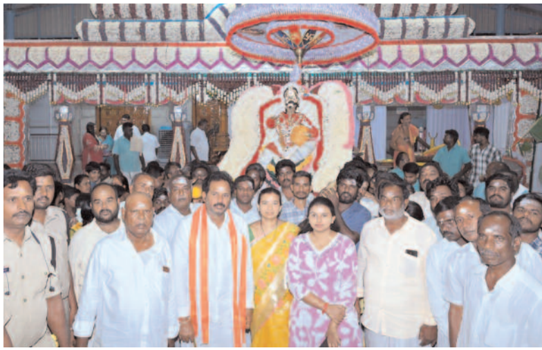
కాణిపాకం, సెప్టెంబర్ 10 స్వర్ణ సాగరం

కాణిపాకం శ్రీ వరసిద్ధి వినాయక స్వామివారి దేవస్థానంలో జరుగుతున్న స్వామి వారి బ్రహ్మోత్సవాల్లో భాగంగా ప్రత్యేక బ్రహ్మోత్సవాలు చంద్ర ప్రభ వాహనంపై కాణిపాకం గ్రామ పురపేటలో విహారిస్తూ భక్తులకు దర్శనం ఇచ్చిన గణనాథుడు. ఉబయదారులుకాణిపాకం చిన్నకాంపల్లి వడంపల్లి కొత్తపల్లి చికరపల్లి తిరవనం పల్లి 44 బొమ్మసముద్రం అగరంపల్లి పుణ్య సముద్రం ఎగవ మారేడుపల్లి దిగు మారేడుపల్లి సంతపల్లి ఉత్తర బ్రాహ్మణ పల్లి కారకంపల్లి కాణిపాకంపట్టణం పై పల్లి సిద్ధంపల్లి గ్రామాల