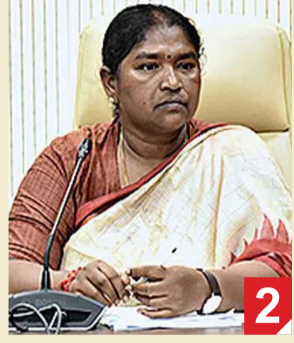
ఇకపై చిరుద్యోగులకు నెలనెలా వేతనాలు ఇస్తాం. పంచాయతీరాజ్ గ్రామీణాభివృద్ధి శాఖ (సీఆర్ఆర్డీ) పరిధిలో పనిచేసే సుమారు 92 వేల మంది పైచిలుకు ఉద్యోగులకు గ్రీన్ చానల్ ద్వారా రూ.115 కోట్లు చెల్లిస్తాం. ప్రభుత్వ ఉద్యోగుల తరహాలో వీరికి కూడా ఒకటో తేదీనే వారి అకౌంట్లలో వేతన మొత్తాన్ని జమచేస్తాం'

మంత్రి సీతక్క నోట అబద్ధాల మూట 92 వేల మందికిపైగా గ్రీన్ చానల్ ద్వారా ప్రతినెలా జీతాలు చెల్లిస్తున్నామని వెల్లడి పంచాయతీరాజ్ శాఖలోని చిరుద్యోగులకు రెండు నెలలుగా అసలే అందని వేతనాలు గ్రీన్ చానల్ అంటూ తాత్పారం