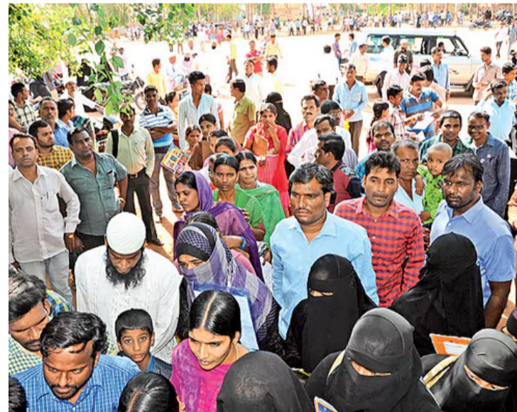
సంగారెడ్డి టౌన్, సిద్దిపేట, మెడక్, కల్వకుర్తి:

ప్రస్తుత పోటీ ప్రపంచంలో రాజీందారాలంటే నైపుణ్యం ఎంతో అవసరం. రంగమేదైనా.. తనదైన ప్రతిభ కలిగి ఉంటే ముందడుగు చేయొచ్చనేది నిపుణుల మాట. విద్యాభ్యాసం పూర్తి చేసి పట్టా చేతికొచ్చాక పరిష్కారం, శిక్షణ తప్పని సరి. ప్రస్తుతం అందరికీ ఉద్యోగాలు గగనంగా మారిన నేపథ్యంలో యువతకు స్వయం ఉపాధి దిశగా ప్రోత్సహించాలని కేంద్ర ప్రభుత్వం సంకల్పించింది. యువతను పారిశ్రామికవేత్తలుగా తీర్చిదిద్దాలన్న లక్ష్యంతో 'రెసిన్ అండ్ యాక్టివ్ లెటర్స్' ఎంఎస్ఎంఈ ఫర్వోయింగ్ (స్టార్ట్) పేరిట ప్రత్యేక కార్యక్రమానికి శ్రీకారం చుట్టింది. ఇందులో భాగంగా ప్రత్యేక శిక్షణ ఇవ్వనుండటం విశేషం.