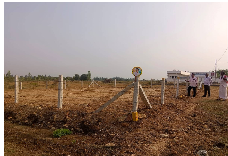
స్థానిక యస్.ఐ ఇచ్చిన ఫిర్యాదు పై వెంటనే స్పందించి కానిస్టేబులను పంపించి పెన్సింగ్ తొలగించుటలో సహకరించారు.