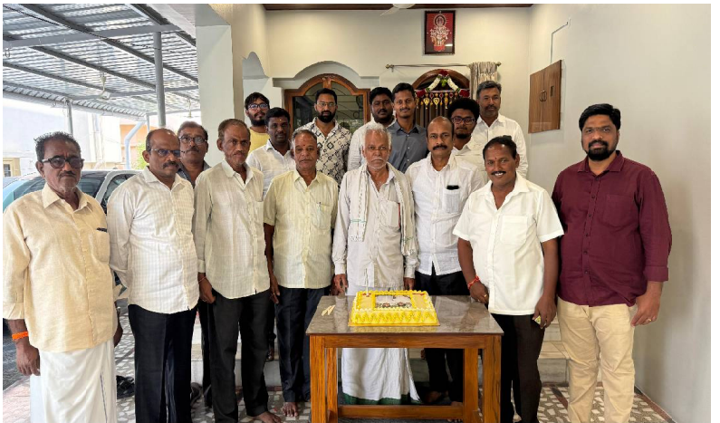
శాసనసభ్యులు కొమ్మలపాటి శ్రీధర్ కార్యాలయంలో నారా లోకేశ్ జన్మదిన వేడుకలు శుక్రవారం ఘనంగా నిర్వహించారు. ఈ సందర్భంగా కేకే కట్ చేసి లోకేశ్ బాబుకు జన్మదిన శుభాకాంక్షలు పలువురు నేతలు తెలిపారు