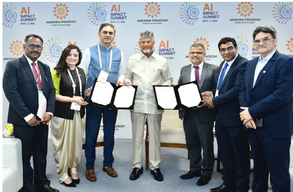
అందిస్తున్నారనేలా విద్యార్థులు, యువతకు ఏఐ - క్యాంటమ్ రంగాల్లో శిక్షణ, ప్రభుత్వ శాఖల్లో ఏఐ - క్యాంటమ్ వినియోగం, టెక్నాలజీ ద్వారా ప్రజలకు సేవలను సులభతరం చేయడం వంటి అంశాలపై రాష్ట్ర ప్రభుత్వం దృష్టి సారించింది.

న్యూఢిల్లీ, ఫిబ్రవరి 20, క్రైమ్ కౌంటర్ న్యూస్): ఢిల్లీలోని భారత్ మండపంలో జరుగుతున్న ఇండియా ఏఐ ఇంఫాక్ట్ సమ్మిట్-2026లో ఏపీ సీఎం చంద్రబాబు నాయుడు పాల్గొన్నారు. ప్రపంచ క్యాంటమ్ - ఏఐ రంగాలకు చెందిన దిగ్గజ సంస్థల ప్రతినిధులు ఈ సందర్భంగా హాజరయ్యారు. ఈ సందర్భంగా ఐటీఎం సహా వివిధ ప్రముఖ సంస్థలతో సీఎం చంద్రబాబు సమక్షంలో రాష్ట్ర ప్రభుత్వం ఒప్పందాలు (ఎంఓయూలు) కుదుర్చుకుంది. ఏపీలో క్యాంటమ్ - ఏఐ రంగాల్లో నైపుణ్యాభివృద్ధి, మౌలిక వసతుల అభివృద్ధి కల్పించే దిశగా ఏడు ఒప్పందాలు కుదుర్చుకుంది సర్కార్. ఏపీని క్యాంటమ్ - ఏఐ హబ్ గా తీర్చిదిద్దడం... అమరావతిలోని క్యాంటమ్ వ్యాపకీ జాతీయ, అంతర్జాతీయ స్థాయి గుర్తింపు తెచ్చేలా ప్రభుత్వం ఒప్పందాలు చేసుకుంది. భవిష్యత్ టెక్నాలజీని