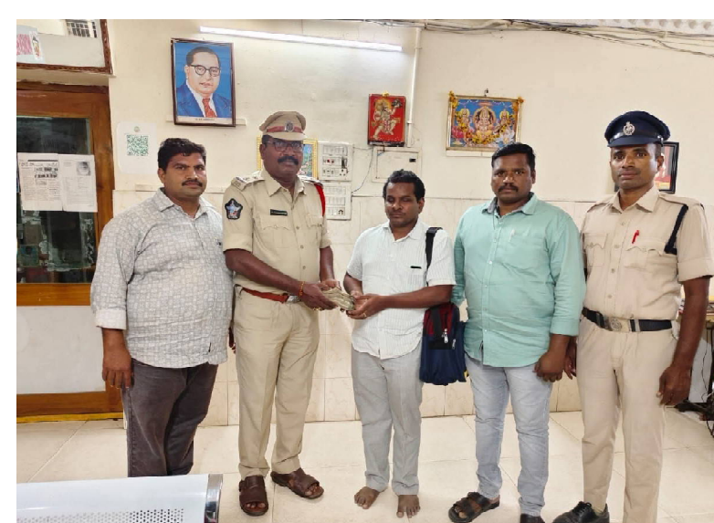
క్రెమ్ కౌంటర్ స్టాఫ్, గుంటూరు జిల్లా... గుంటూరులో ఓ అంధ ప్రభుత్వ ఉ