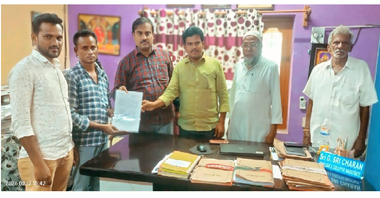
కింద ఉచిత చికిత్స పొందేందుకు మార్గం సుగమమైంది. మంత్రి చొరవకు బాలిక తల్లిదండ్రులు కృతజ్ఞతలు తెలిపారు.