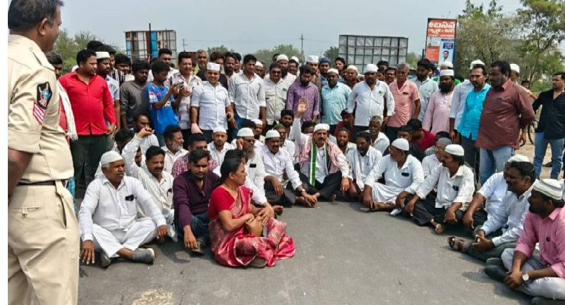
ట్రాఫిక్ సు క్లియర్ చేసారు.