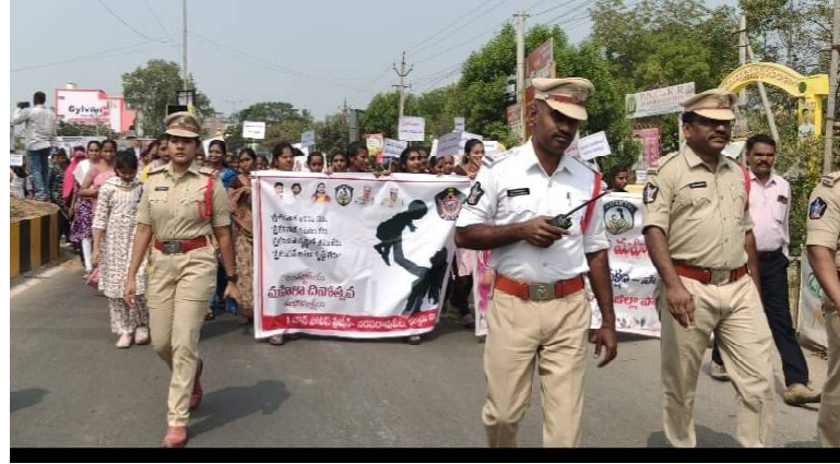
క్రైం కౌంటర్: సరసరావుపేట టౌన్ - మహిళా సాధికారతే లక్ష్యంగా పల్నాడు జిల్లా పోలీసు శాఖ ఆధ్వర్యంలో అవగాహన ర్యాలీ నిర్వహించారు. పల్నాడు జిల్లా ఎస్పీ బి.కృష్ణారావు ఆదేశాల మేరకు ఆదివారం అంతర్జాతీయ మహిళా దినోత్సవం ను పురస్కరించుకొని జిల్లా లోని పలు పోలీస్ స్టేషన్ల తో పాటు సరసరావుపేట పట్టణంలో స్థానిక ఎస్ ఎస్ ఎస్ కాలేజీ నుండి పల్నాడు బస్టాండ్ వరకు మహిళా పోలీసులు, మహిళా పోలీసు సిబ్బంది పలు కళాశాలల విద్యార్థినులతో ర్యాలీ నిర్వహించారు. మహిళా సాధికారత, వైతన్యం, ప్రగతి తదితర అంశాలపై జై జైలు పలికారు. ఈ సందర్భంగా పోలీసు అధికారులు మాట్లాడుతూ

రాష్ట్ర ప్రభుత్వం, రాష్ట్ర డిజిపి ఉత్తర్వుల మేరకు జిల్లా వ్యాప్తంగా మహిళా సాధికారత వారోత్సవాల్లో భాగంగా అంతర్జాతీయ మహిళా దినోత్సవ వేడుకలు నిర్వహిస్తున్నట్లు తెలిపారు. మహిళలపై జరుగుతున్న అన్యాయాలు, వేధింపులు, చట్టపరమైన హక్కులు మరియు భద్రతా చర్యలపై ప్రజలకు సముగ్రంగా అవగాహన కల్పించారు. మహిళలు ఎదుర్కొనే సమస్యలను ధైర్యంగా వెలుగులోకి తీసుకురావాలని, చట్టపరమైన సహాయం పొందేందుకు ముందుకు రావాలని సూచించారు. అలాగే మహిళల భద్రత కోసం ప్రభుత్వం మరియు పోలీస్ శాఖ వారు అమలు చేస్తున్న చర్యలను వివరించారు. మహిళల తమ హక్కులను తెలుసుకొని, ఆత్మవిశ్వాసంతో ముందుకు సాగి స్వయం సాధికారత సాధించాలని పోలీస్ అధికారులు పిలుపునిచ్చారు.