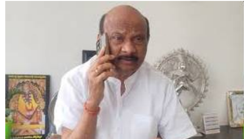
అందించేందుకు సిద్ధంగా ఉందని అయ్యన్నపాత్రుడు భరోసా ఇచ్చారు. అవసరమైతే అక్కడి తెలుగువారిని సురక్షితంగా స్వదేశానికి తీసుకురావడానికి కేంద్ర మంత్రి కింజరాపు రామ్మోహన్ నాయుడుతో మాట్లాడి తక్షణ సహాయక చర్యలు చేపడతామని మాట్లాడారు. ఈ కక్షకాలంలో తమ బాగాగ్రులు తెలుసుకుని, అండగా నిలుస్తూ తమలో మనోధైర్యాన్ని నింపిన స్పీకర్ అయ్యన్నపాత్రుడుకి ఎన్నారైలు ప్రత్యేక కృతజ్ఞతలు తెలిపారు.