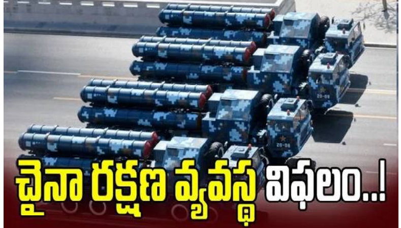
బీజింగ్, టిబెట్, దక్షిణ చైనా సముద్ర ప్రాంతాల్లో వీటిని మోహరించింది. ఇక పాకిస్థాన్ కూడా ఈ గగనతల రక్షణ వ్యవస్థను వినియోగిస్తోంది. అయితే, ఆపరేషన్ సిందూర్ సమయంలో భారత దళాల దాడులను కూడా ఈ వ్యవస్థ పూర్తిస్థాయిలో అడ్డుకోలేకపోయిందన్న విమర్శ ఉంది. తాజాగా ఇరాన్ లో కూడా హెచ్ క్యూ-9 బీ పనితీరుపై విమర్శలు వెల్లవెత్తుతున్నాయి.

క్రైం కౌంటర్ సూపర్: ఇంటర్నెట్ డెన్యూ: అమెరికా, ఇజ్రాయెల్ దాడుల్లో ఇరాన్ నగరాల్లో పెద్ద సంఖ్యలో భవనాలు ధ్వంసం కావడంతో రక్షణ రంగ వర్గాల్లో చర్చ మొదలైంది. చైనా నుంచి కొనుగోలు చేసిన గగనతల రక్షణ వ్యవస్థలు విఫలమయ్యాయా? అన్న చర్చ నడుస్తోంది. ఇరాన్ కు కీలకమైన సమయంలో చైనా క్షిపణి రక్షణ వ్యవస్థ ఆదుకోలేకపోయిందన్న కామెంట్స్ వినిపిస్తున్నాయి. గతంలో ఇరాన్ వద్ద రష్యాకు చెందిన ఎస్-300 పిఎమ్ యూ-2 గగనతల రక్షణ వ్యవస్థ ఉండేది. గతేడాది అమెరికా జరిపిన క్షిపణి దాడులను అడ్డుకోవడంలో ఇది పూర్తిగా విఫలం కావడంతో ఇరాన్ చైనావైపు మళ్లింది. చైనా నుంచి హెచ్ క్యూ-9 బీ గగనతల రక్షణ వ్యవస్థను దిగుమతి చేసుకుంది. చమురుకు సరఫరాకు ప్రతిగా ఈ వ్యవస్థను తీసుకుంది. దీర్ఘకాలిక లక్ష్యాలు కోసం ఈ వ్యవస్థను చైనా నుంచి ఇరాన్ తెచ్చుకుంది. అణుకేంద్రాలు, అణు ఇంధన శుద్ధి కేంద్రాల వద్ద ఈ వ్యవస్థలను మోహరించింది. చైనా ఎయిరోస్పేస్ సైన్స్ అండ్ ఇండస్ట్రీ కార్పొరేషన్ హెచ్ క్యూ-9 బీని అభివృద్ధి చేసింది. అమెరికాకు చెందిన పాత్రయిట్ పీవీ-2 వ్యవస్థ స్ఫూర్తితో దీన్ని డిజైన్ చేసింది. ఆ తరువాత తనదైన మెరుగులు దిద్దింది. ఈ వ్యవస్థ రేంజ్ 260 కిలోమీటర్లు. గరిష్టంగా 50 కిలోమీటర్ల ఎత్తులోని లక్ష్యాలనూ ధ్వంసం చేయగలదు. ఈ వ్యవస్థను చైనా స్వయంగా వినియోగిస్తోంది. పూహాత్మకంగా కీలకమైన