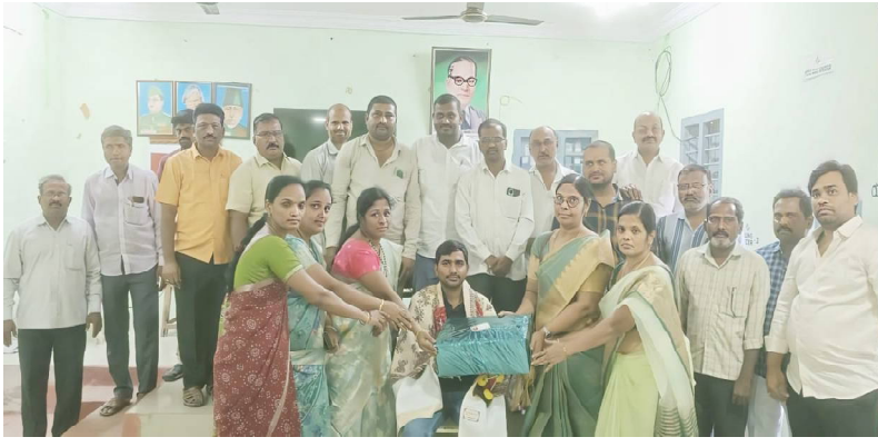
క్రైమ్ కౌంటర్ స్టాఫ్... ప్రకాశం జిల్లా...