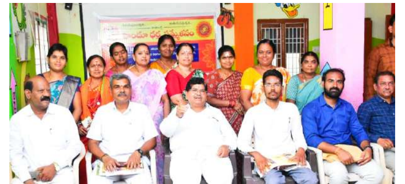
జనోదయ :వరంగల్ ప్రతినిధి

-ఈ నెల 18న కాశీబుగ్గలో సమ్మేళనం -బహుశ్రీ జ్ఞాన చైతన్యనంద స్వామీజీ ముఖ్య అతిథి