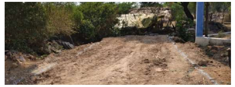
వాస్తవం : మాడుగుల

ప్రభుత్వ భూమిలో ముగ్గు పోసిన పట్టించుకోని అధికారులు