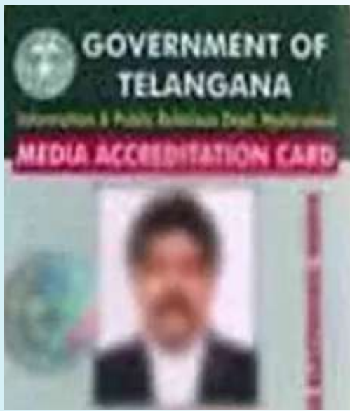
వాస్తవం : వరంగల్ ప్రతినిధి:

జర్నలిస్టులకు ప్రభుత్వం ఇచ్చే అక్రిడిటేషన్ అనేది కేవలం రైల్వే బస్ పాస్, హెల్త్ కార్డ్ లాంటి రాయితీల కోసమేనని, అది ఉంటేనే నిజమైన జర్నలిస్ట్ అని ప్రచారం చేయడం అవగాహనా రాహిత్యమేనని జర్నలిస్ట్ల సంక్షేమ సంఘం (జెఎస్ఎస్) వరంగల్ జిల్లా ప్రధాన కార్యదర్శి, జనోదయ వరంగల్ జిల్లా ప్రతినిధి సిలువేరు