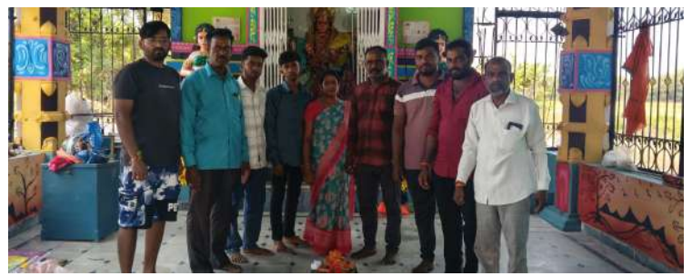
వాస్తవం : చందుర్తి

చందుర్తి మండల కేంద్రంలోని కుల దైవమైన ముదిరాజు కులస్తులు శ్రీ పెద్దమ్మ దేవాలయంలో ఐదేళ్లకోసారి సిద్ధోగం నిర్వహించడం ఆనవాయితీ. ఈ క్రమంలో గత శుక్రవారం శ్రీ పెద్దమ్మ తల్లి బోనాల పండుగను అంగరంగ వైభవంగా నిర్వహించారు. గ్రామ దేవతల పూజారుల ఆధ్వర్యంలో సంప్రదాయంగా శాస్త్రోక్తంగా నాగేల్లి, కళ్యాణం శ్రీ పెద్దమ్మ పండుగను ఘనంగా నిర్వహించారు. ఈ కార్యక్రమం అనంతరం ముదిరాజు కులస్తుల ఆధ్వర్యంలో గురువారం శ్రీ పెద్దమ్మ తల్లికి మరుబోనం సమర్పించారు. ఆలయంలోనే బోనం వండి పూజించి నైవేద్యం సమర్పించారు. శ్రీ పెద్దమ్మ ఆశీస్సులతో వచ్చే ఐదేళ్ల కు పెద్ద ఎత్తున కళ్యాణం, జాతర మహోత్సవాన్ని నిర్వహిస్తామని సంఘ ప్రతినిధులు తెలిపారు.