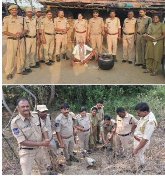
టామని ఈ సందర్భంగా హెచ్చరించారు.

ఐ పవన్ తెలిపారు. ఈ దాడుల్లో రెండు లీటర్ల నాటు సారాయిని స్వాధీనం చేసుకొని సారా తయారీకి ఉపయోగించే సుమారు 100 లీటర్ల బెల్లం పానకాన్ని పారబోశామని, పాత్రలను ధ్వంసం చేసినట్లు చెప్పారు. అలాగే నాటు సారా తయారు చేస్తున్న ఇద్దరు వ్యక్తులపై కేసులు నమోదు చేశామని పేర్కొన్నారు. ఈ సందర్భంగా సీ ఐ పవన్ మాట్లాడుతూ... నాటు సారా తయారు చేయడం, రవాణా చేయడం, ముడి పదార్థాలను అమ్మడం నేరమని అన్నారు. ఇలాంటి నేరానికి పాల్పడిన వారిపై చట్టపరమైన కఠిన చర్యలు తీసుకుం