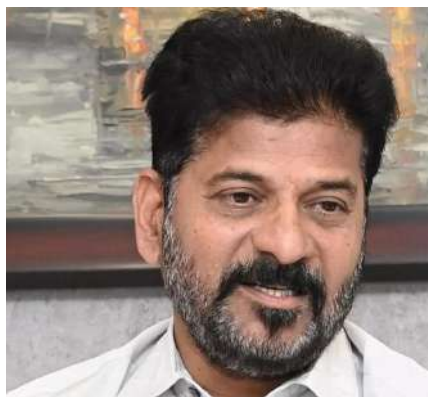
హైదరాబాద్, ఏప్రిల్ 14: ప్రధానమంత్రి నరేంద్ర మోదీకి తెలంగాణ ముఖ్యమంత్రి

ఎ. రేవంత్ రెడ్డి లేఖ రాశారు. ఈ లేఖలో పలు అంశాలను ప్రస్తావించారు. నియోజకవర్గాల పెంపు విషయంలో దక్షిణాది రాష్ట్రాలకు అన్యాయం జరుగకుండా జాతీయ స్థాయిలో విస్తృత చర్చలు జరపాలని సూచించారు. అన్ని రాజకీయ పార్టీలతో అఖిలపక్ష సమావేశం ఏర్పాటు చేయాలని కోరారు. అన్ని రాష్ట్రాలు, రాజకీయ పార్టీల అభిప్రాయాల ద్వారానే నిర్ణయం తీసుకోవాలని ప్రధానికి విజ్ఞప్తి చేశారు. దేశ ప్రజాస్వామ్య భవిష్యత్తుపై ప్రభావం చూపే అంశం కావడంతో బాధ్యతాయుతంగా ఈ లేఖ రాసినట్లు తెలిపారు. ప్రస్తుతం మహిళా రిజర్వేషన్, పునర్విభజన, లోక్ సభ సీట్ల పెంపు అనే