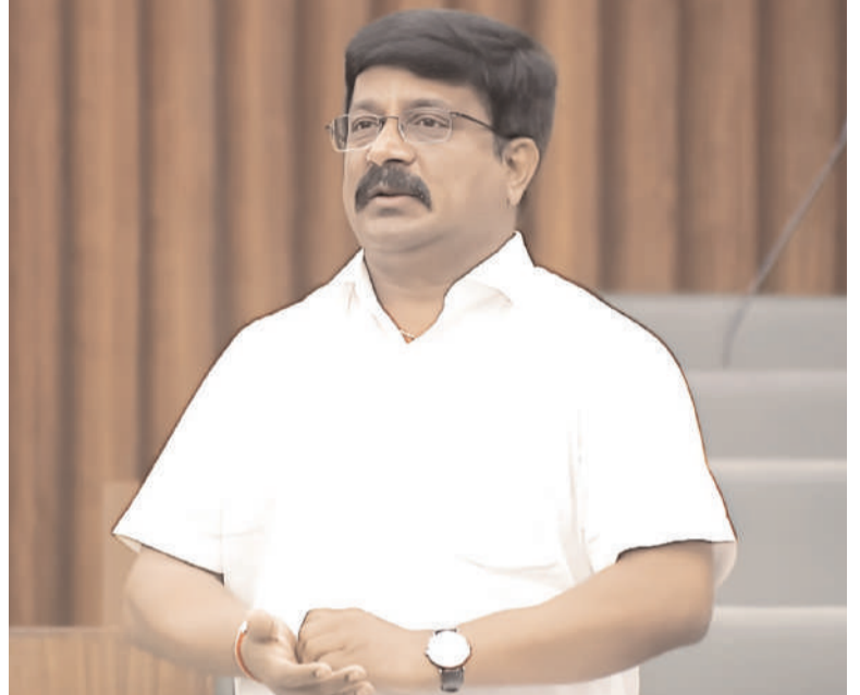
హాస్పిటల్ నుంచి మత్తు డాక్టర్ ను తీసుకువచ్చి దాతల సహకారంతో సిజేరియన్స్ చేయడం ప్రారంభించాం. కానీ గతంలో మాదిరిగా సిజేరియన్స్ జరగాలి అంటే వీలైనంత త్వరగా మత్తు డాక్టర్ తో పాటు ఇంకా అవసరమైన డాక్టర్స్ ను ఇక్కడకు బదిలీ చేసి పేదలకు మెరుగైన వైద్యం అందించడానికి తోడ్పాటు అందించాలని కోరారు.