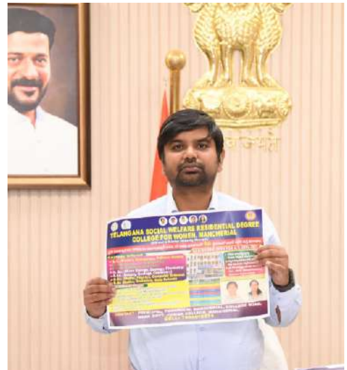
జరుగుతుందని, నిష్కతులైన మహిళా అధ్యాపకులచే భోధన అందించడం జరుగుతుందని తెలిపారు. విద్యార్థులకు కాన్సోల్టింగ్ చార్జెస్, యూనిఫామ్, ట్రాక్ షూ, నోట్ బుక్స్, స్టాఫ్ షూ,