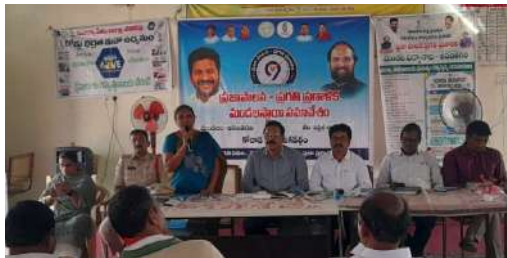
గ్రామాల్లో ప్రజలకు అందుతున్న సేవలను మరింత మెరుగుపరచాలని, ప్రభుత్వ పథకాలు అర్హులందరికీ చేరేలా కృషి చేయాలని అధికారులకు దిశానిర్దేశం చేశారు. గ్రామాభివృద్ధిలో ప్రజాప్రతినిధులు, అధికారులు సమన్వయంతో పనిచేయాల్సిన అవసరాన్ని సమావేశంలో

సూర్యాపేట జిల్లా అనంతగిరి మండలంలో ప్రజా పాలన ప్రగతి ప్రణాళిక అమలుపై మండల స్థాయి సమీక్షా సమావేశం గురువారం రైతు వేదికలో ఘనంగా నిర్వహించారు. కార్యక్రమం ప్రారంభంలో 'జయ జయ హే తెలంగాణ' గీతాన్ని ఆలపిస్తూ అధికార యంత్రాంగం, ప్రజాప్రతినిధులు ఉత్సాహంగా సమావేశాన్ని ఆరంభించారు. ఈ సందర్భంగా ప్రభుత్వం ప్రకటించిన 99 రోజుల కార్యచరణ ప్రణాళిక, వివిధ సంక్షేమ పథకాల అమలు తీరు, గ్రామాల్లో జరుగుతున్న అభివృద్ధి పనుల పురోగతిపై అధికారులు సమగ్రంగా సమీక్షించారు. ప్రతి శాఖకు సంబంధించిన పనితీరును విశ్లేషిస్తూ, లక్ష్యాలను వేగంగా పూర్తి చేయాలని సూచించారు. మండలంలోని