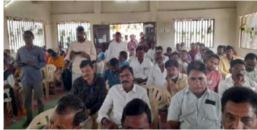
ప్రత్యేకంగా ప్రస్తావించారు. ఈ సమావేశంలో మండలంలోని సర్పంచులు, ఉప సర్పంచులు, ప్రజాప్రతినిధులు, వివిధ శాఖల అధికారులు పాల్గొని తమ అభిప్రాయాలు, సూచనలు వ్యక్తం చేశారు