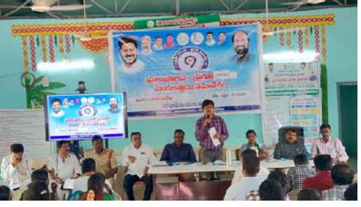
రుణాలు, ఇందిరమ్మ చీరలు, కొత్త రేషన్ కార్డులు ఎంతమంది లభిపొందుతున్నారో వివరముగా తెలుపుతూ రాబోవు

నడిగూడెం ప్రజా పాలన ప్రగతి ప్రణాళిక కార్యక్రమం మండల స్థాయి కార్యక్రమము రైతు వేదిక లో నిర్వహించబడుతుంది. ఈ కార్యక్రమం ప్రజా పాలన ప్రగతి ప్రణాళిక అమలుపై మండల స్థాయి సమీక్షా సమావేశం గురువారం రైతు వేదికలో ఘనంగా నిర్వహించారు. కార్యక్రమం ప్రారంభంలో 'జయ జయ హే తెలంగాణ' గీతాన్ని ఆలపిస్తూ అధికార యంత్రాంగం, ప్రజాప్రతినిధులు ఉత్సాహంగా సమావేశాన్ని ఆరంభించారు. ఈ సందర్భంగా ప్రభుత్వం ప్రకటించిన 99 రోజుల కార్యచరణ ప్రణాళిక, వివిధ సంక్షేమ పథకాల అమలు తీరు, గ్రామాల్లో జరుగుతున్న అభివృద్ధి పనుల పురోగతిపై అధికారులు సమగ్రంగా సమీక్షించారు. ప్రతి శాఖకు సంబంధించిన పనితీరును విశ్లేషిస్తూ, లక్ష్యాలను వేగంగా పూర్తి చేయాలని సూచించారు. మండలంలోని