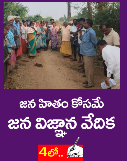
జన హితం కోసమే జన విజ్ఞాన వేదిక