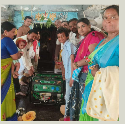
మత్స్యగిరి స్వామి దేవాలయానికి జనరేటర్ బహుకరణ