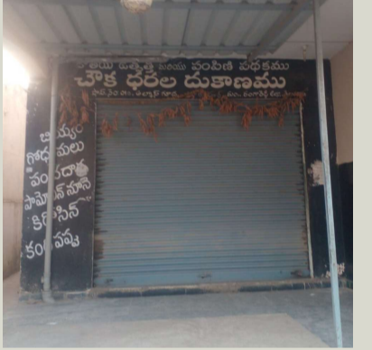
మూడ్రోజులకే మూతపడుతున్న రేషన్ దుకాణాలు