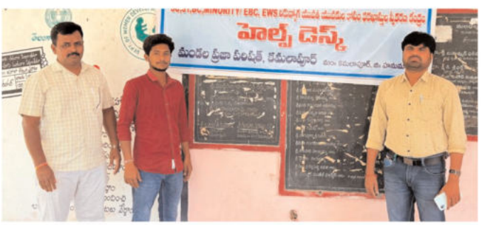
బాబు ఏర్పాటు చేశారు. ఈ సందర్భంగా ఎంఫీడీవో గు

హనుమకొండ జిల్లా కమలాపూర్ మండల కేంద్రంలోని మండల పరిషత్ అభివృద్ధి అది . కారి కార్యాలయంలో తెలంగాణ రాష్ట్ర (పభు త్వం ఇటీవల ఎన్నీ, ఎస్టీ, బిసి, మైనార్టీ, ఈబీసీ నిరుద్యోగ యువతి యువకుల కోసం (పవేశపెట్టినటువంటి రాజీవ్ యువ వికాస పథకం దరఖా స్తుల స్వీకరణ కొరకై హెల్ఫ్ డెస్క్(సేవా కేంద్రం)ను కమలాపూర్ మండల పరిషత్ అభివృద్ధి అధికారి గుండె