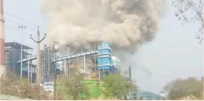
వేద న్యూస్, నేషనల్ డెస్క్

ఛత్తీస్ గఢ్ రాష్ట్రంలోని శక్తి జిల్లాలో భారీ విషాద ఘటన చోటుచేసుకుంది. సింగి తరాయ్ గ్రామంలోని వేదాంత పవర్ ప్లాంట్ లో బాయిలర్ టూటల్ పేలడంతో 9 మంది కార్మికులు మృతి చెందగా, 30 మందికి పైగా గాయపడినట్లు పోలీసులు తెలిపారు. ఈ ఘటన మధ్యాహ్నం సమయంలో కార్మికులు విడుదలై ఉండగా సంభవించింది. బాయిలర్ లో సాంకేతిక వైఫల్యం తలెత్తడంతో ఒక్కసారిగా భారీ పేలుడు చోటుచేసుకున్నట్లు ప్రత్యక్ష సాక్షులు వెల్లడించారు. పేలుడు తీవ్రత ఎక్కువగా ఉండటంతో అక్కడే పలువురు ప్రాణాలు కోల్పోయారు. పేలుడు తర్వాత కార్మికులు ప్లాంట్ నుంచి బయటకు పరుగులు తీసే క్రమంలో తొక్కిన లాట చోటుచేసుకున్నట్లు సమాచారం. దీంతో మరికొందరు గాయాలపాలయ్యారు. గాయపడిన వారిని సమీప ఆసుపత్రులకు తరలించి చికిత్స అందిస్తున్నారు. మరికొందరు కార్మికులు ప్లాంట్ లోపల చిక్కుకుని ఉండొచ్చని అధికారులు అనుమానం వ్యక్తం చేస్తున్నారు. వారిని రక్షించేందుకు ప్రయత్నాలు కొనసాగుతున్నాయి. ఘటన స్థలంలో తీవ్ర ఉద్రిక్తత నెలకొంది. సమాచారం అందుకున్న వెంటనే పోలీసులు, అగ్నిమాపక సిబ్బంది సంఘటన స్థలానికి చేరుకుని సహాయక చర్యలు వేగవంతం చేశారు. ప్రమాదానికి గల కారణాలపై దర్యాప్తు ప్రారంభించారు. ఈ ఘటనతో ప్రాంతంలో విషాద వాతావరణం నెలకొంది. బాధిత కుటుంబాలకు అధికారులు సాయం తెలిపారు.