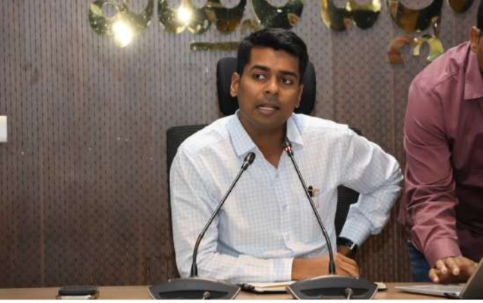
వేద న్యూస్, ఖమ్మం ప్రతినిధి: