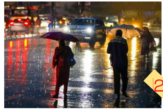
తెలంగాణలో చిరుజల్లులు హైదరాబాద్లోని పలు ప్రాంతాల్లో వర్షం