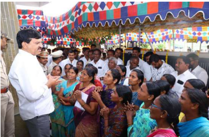
వేద న్యూస్, ఖమ్మం:

ప్రజల సంక్షేమానికి రాష్ట్ర ప్రభుత్వం కట్టుబడి ఉందని, ఆరోగ్యం, విద్యుత్ రంగాల అభివృద్ధికి ప్రత్యేక ప్రాధాన్యత ఇస్తున్నామని మంత్రి పొంగులేటి శ్రీనివాస రెడ్డి తెలిపారు. బుధవారం డిప్యూటీ సీఎం మల్లా భట్టి విక్రమార్కతో కలిసి కల్లూరు మండలంలో వ్యవహించారు. ఈ సందర్భంగా కల్లూరులో