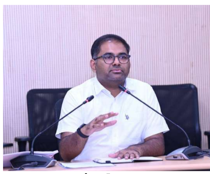
వేద న్యూస్ పెద్దపల్లి:

జిల్లాలోని నిరుద్యోగ యువతకు ఉపాధి అవకాశాలు కల్పించేందుకు ఈ నెల 17న పెద్దపల్లి జిల్లా కేంద్రంలో భారీ జాబ్ మేళా నిర్వహిస్తున్నట్లు జిల్లా కలెక్టర్ కోయ శ్రీ హర్ష తెలిపారు. ట్యాంక్ రిజిస్ట్రేషన్ సెంటర్ ఆధ్వర్యంలో ఈ కార్యక్రమం నిర్వహించబడనుంది. పెద్దపల్లి బస్టాండ్ సమీపంలోని ట్యాంక్