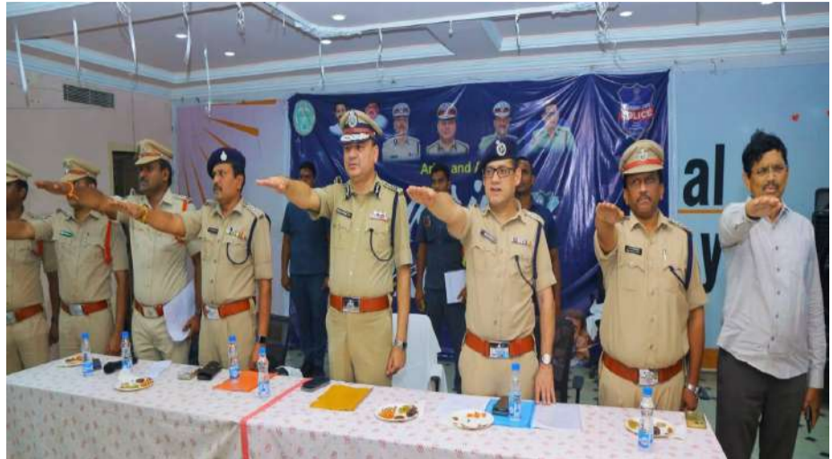
వేద న్యూస్ ఖమ్మం: