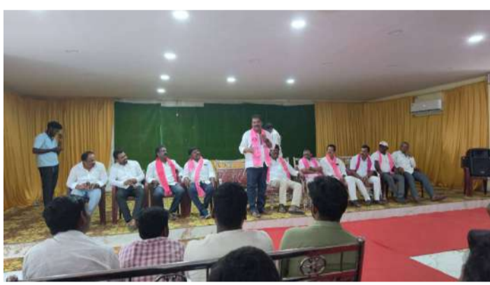
వేద న్యూస్, బోయినపల్లి:

రాజన్న సిరిసిల్ల జిల్లా బోయినపల్లి మండలంలో బీఆర్ఎస్ ముఖ్య కార్యకర్తల సమావేశం మిని హాల్ నటరాజ్ వీని భవనంలో నిర్వహించారు.