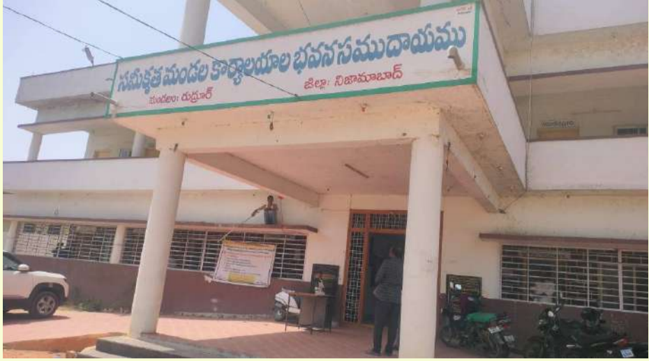
వేద న్యూస్, రుద్రూర్:

మండల కేంద్రంలోని సమీకృత మండల సముదాయ భవనం పరిశుభ్రతపై వేద న్యూస్లో ప్రచురితమైన కథనానికి అధికారులు స్పందించారు. గత మూడు రోజులుగా భవనాన్ని పూర్తిగా శుభ్రం చేయించారు. 'బాబు పట్టిన సమీకృత మండల సముదాయ భవనం.. పరిశుభ్రతపై పట్టించుకోని అధికారులు' అనే శీర్షికతో వేద న్యూస్ లో వార్త ప్రచురితమైన విషయం తెలిసింది. వార్తకు స్పందించిన అధికారుల వెంటనే చర్యలు చేపట్టారు. భవనం పరిశుభ్రంగా మారడంతో స్థానికులు హర్షం వ్యక్తం చేస్తూ వేద న్యూస్ పత్రికకు ప్రత్యేక కృతజ్ఞతలు తెలిపారు.