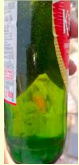
వేద న్యూస్, కరీమాబాద్:

చల్లగా బీరు వేసి చిల్ అవుదాం అనుకున్న ఓ యువకుడికి షాక్ తగిలింది. శుక్రవారం మధ్యాహ్నం వరంగల్ తూర్పు నియోజకవర్గంలోని కరీమాబాద్ ప్రాంతంలో ఓ వైన్ షాప్ లో ఓ యువకుడు బీర్ బాటిల్ కొనుగోలు చేశాడు. బయటికి చచ్చి ఓరు తాగే లోపు ఆ బాటిల్లో ఏదో తెడాగా కనిపించింది.నిశితంగా పరిశీలించగా ఆ బీర్ బాటిల్ లో చెత్తతో పాటు పాకురు కనిపించింది. ఇంకేముంది ఆ యువకుడు బీర్ బాటిల్ ని అందులో కనిపించే చెత్త, పాకురును వీడియో తీసి సోషల్ మీడియాలో పోస్ట్ చేశాడు. ఇక సోషల్ మీడియాలో ఈ వీడియో వైరల్ గా మారింది.