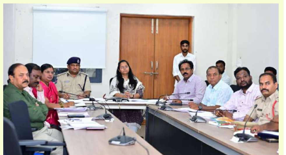
వేద న్యూస్, పాపన్నపేట: