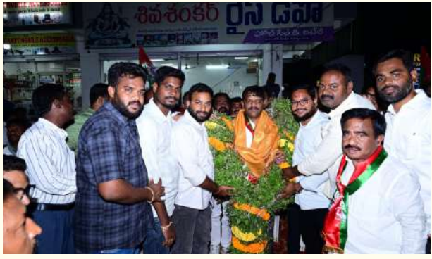
వేద న్యూస్, హనుమకొండ