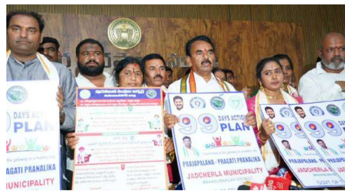
వేద న్యూస్, జడ్పర్తి: