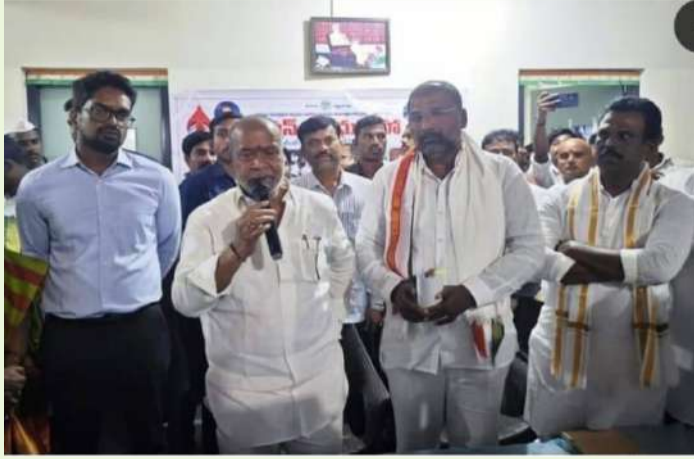
వేద న్యూస్, అమరచింత: