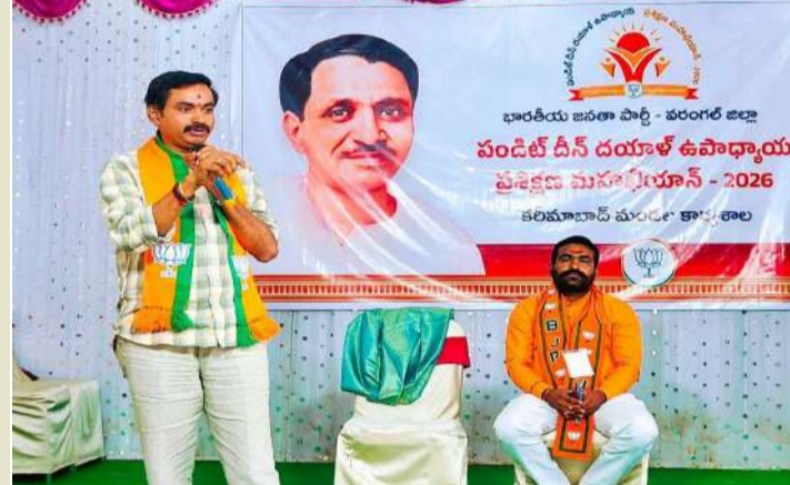
వేద న్యూస్, వరంగల్ ప్రతినిధి: