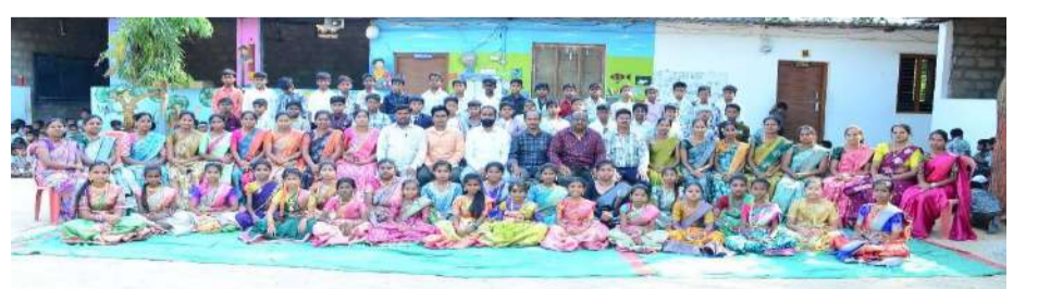
వేద న్యూస్, పాపన్నపేట: