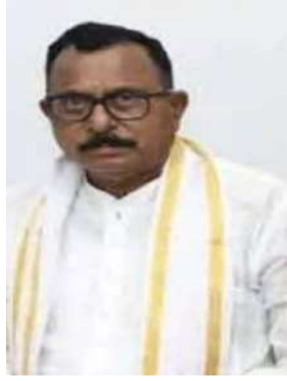
వేద న్యూస్, నాగర్ కర్నూల్: