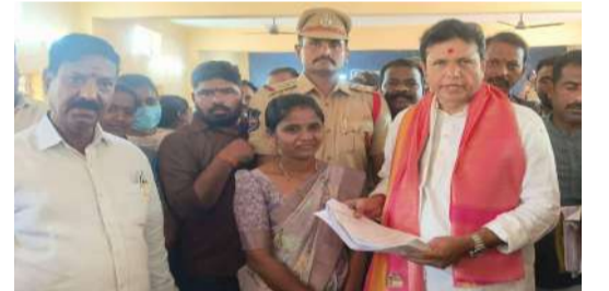
వేద న్యూస్, జయశంకర్ భూపాలపల్లి: