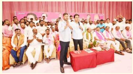
వేద న్యూస్, హైదరాబాద్