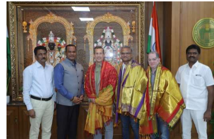
వేద న్యూస్, హైదరాబాద్ ప్రతినధి:

న్యూయార్క్ కు చెందిన ప్రముఖ సాంకేతిక సంస్థ 'పికో' ప్రతినిధులు తెలంగాణ సచివాలయాన్ని సందర్శించి రాష్ట్రంలో పెట్టుబడుల అవకాశాలపై కీలక చర్చలు జరిపారు. రాష్ట్ర రహదారులు, భవనాలు మరియు సినిమాలోగ్రఫీ శాఖ మంత్రి కోమటిరెడ్డి వెంకటరెడ్డి ఈ ప్రతినధి బృందానికి స్వాగతం పలికి రాష్ట్రంలో ఉన్న పారిశ్రామిక అవకాశాలను వివరించారు. ఈ సందర్భంగా 'తెలంగాణ రైజింగ్ 2047' ప్రణాళికను మంత్రి వివరించారు. హైదరాబాద్ ను ప్రపంచ స్థాయి పెట్టుబడుల కేంద్రంగా, ఆవిష్కరణల అడ్డాగా తీర్చిదిద్దడమే ప్రభుత్వ లక్ష్యమని తెలిపారు. విదేశీ కంపెనీలకు అవసరమైన అన్ని మౌలిక సదుపాయాలను ప్రభుత్వం కల్పిస్తుందని భరోసా ఇచ్చారు. ఐటీతో పాటు సెమీకండక్టర్లు,