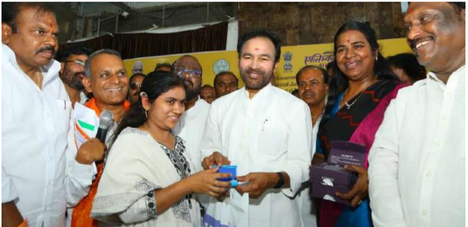
వేద న్యూస్, సికింద్రాబాద్:

సికింద్రాబాద్ నియోజకవర్గ పరిధిలోని లాలాగూడలో దివ్యాంగులకు సహాయక ఉపకరణాల పంపిణీ కార్యక్రమం ఘనంగా జరిగింది. కేంద్ర మంత్రి కిషన్ రెడ్డి కార్యక్రమంలో నిర్వహించిన ఈ కార్యక్రమంలో అర్హులైన లబ్ధిదారులకు మూడు చక్రాల సైకిళ్లు, విల్ చెయర్లు, వినీకిడి యంత్రాలు, నడక కర్రలను అందజేశారు. భారత ప్రభుత్వ ఏడీఐపీ పథకం ద్వారా దేశవ్యాప్తంగా దివ్యాంగులకు ఆధునిక పరికరాలను ఉచితంగా అందిస్తూ వారి జీవన ప్రమాణాలను మెరుగుపరుస్తున్నామని మంత్రి తెలిపారు. శారీరక వైకల్యం ప్రతిభకు అడ్డకాదని, సరైన ప్రోత్సాహం ఉంటే వారు అన్ని రంగాల్లో రాణించగలరని ఆయన పేర్కొన్నారు. ఈ సందర్భంగా మంత్రి లబ్ధిదారులతో నేరుగా మాట్లాడి వారి సమస్యలను తెలుసుకున్నారు. కేవలం పరికరాల పంపిణీతోనే కాకుండా, దివ్యాంగులకు నైపుణ్యాభివృద్ధి శిక్షణల ద్వారా ఉపాధి అవకాశాలు కల్పించేందుకు కూడా చర్యలు తీసుకుంటున్నట్లు వెల్లడించారు. కార్యక్రమంలో పెద్ద సంఖ్యలో దివ్యాంగులు, వారి కుటుంబ సభ్యులు, స్థానిక నాయకులు పాల్గొన్నారు. కేంద్ర ప్రభుత్వ సహాయంతో తమ జీవితం సులభమవుతుందని లబ్ధిదారులు ఆనందం వ్యక్తం చేశారు. రాబోయే రోజుల్లో మరిన్ని ఆరోగ్య శిబిరాలు నిర్వహిస్తామని మంత్రి హామీ ఇచ్చారు.