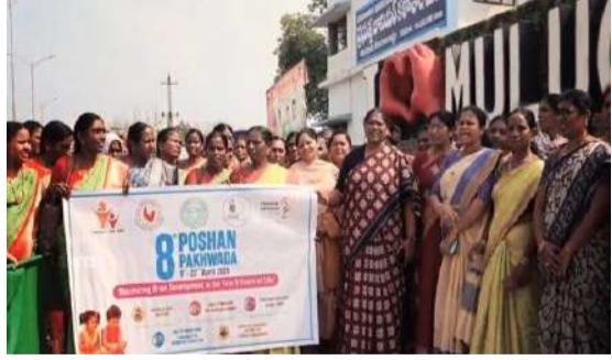
వేద న్యూస్, ములుగు:

రాష్ట్ర పంచాయతీరాజ్, గ్రామీణాభివృద్ధి మరియు మహిళా శిశు సంక్షేమ శాఖ మంత్రి సీతక్క ములుగు జిల్లా కేంద్రంలో 'పోషన్ పక్వాడ' అవగాహన ర్యాలీని ప్రారంభించారు. జిల్లా కేంద్రంలోని 'బి లవ్ ములుగు' డిమ్ వద్ద జెండా ఊపి ర్యాలీకి శ్రీకారం చుట్టారు. గర్భిణులు, బాలింతలు, చిన్నారుల్లో పౌష్టికాహార లోపాన్ని నివారించడమే ఈ కార్యక్రమ ప్రధాన లక్ష్యమని ఆమె తెలిపారు. ఈ సందర్భంగా అంగన్ వాడీ కార్యకర్తలు, మహిళా సంఘాల పాత్రను మంత్రి ప్రశంసించారు. గ్రామ స్థాయిలో పోషకాహారంపై అవగాహన పెంపొందించడంలో వారు కీలకంగా పనిచేస్తున్నారని పేర్కొన్నారు. వేసవి తీవ్రతను దృష్టిలో ఉంచుకుని కలెక్టరేట్ కార్యాలయం మరియు పాత బస్టాండ్ వద్ద ఏర్పాటు చేసిన చలివేంద్రాలను మంత్రి ప్రారంభించారు. బాలిసారులు, ప్రజలు ఎండల వల్ల ఇబ్బందులు పడకుండా ముందస్తు చర్యలు తీసుకోవడం అభినందనీయమని తెలిపారు. ప్రజలు వడదెబ్బకు గురికాకుండా తగిన జాగ్రత్తలు తీసుకోవాలని సూచించారు. అసంతరం జరిగిన సమావేశంలో మహిళలు, చిన్నారుల ఆరోగ్యంపై ప్రత్యేక దృష్టి సారించామని మంత్రి స్పష్టం చేశారు. అంగన్ వాడీ కేంద్రాల ద్వారా పోషకాహార పంపిణీ పారదర్శకంగా జరిగేలా అధికారులు పర్యవేక్షణ పెంచాలని ఆదేశించారు. ఈ కార్యక్రమంలో స్థానిక ప్రజాప్రతినిధులు, అధికారులు, మహిళలు పెద్ద సంఖ్యలో పాల్గొన్నారు.