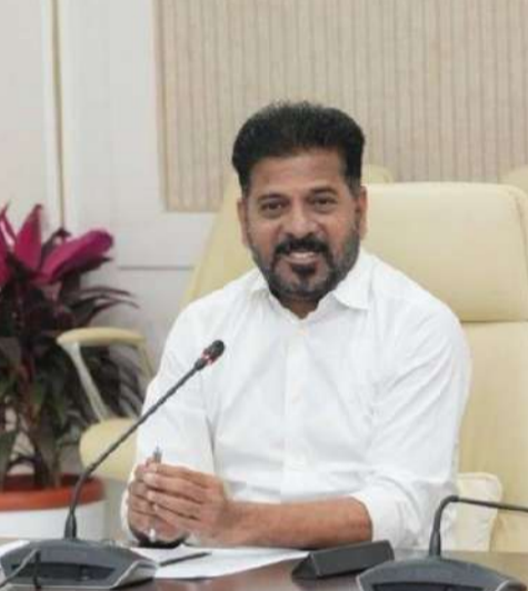
ప్రారంభమైన ప్రజావాణి కార్యక్రమం ఇప్పటికే విశేష ఫలితాలను ఇస్తోంది. ప్రతి మంగళ, శుక్రవారాల్లో నిర్వహిస్తున్న ఈ వేదిక ద్వారా లక్షకు పైగా దరఖాస్తులు స్వీకరించగా, సుమారు 74 శాతం సమన్వయ పరిష్కారమయ్యాయి. నోడల్ అధికారుల వ్యవస్థ ద్వారా నిరంతర పర్యవేక్షణ జరుగుతోంది. ప్రజల భాగస్వామ్యంతో కూడిన జవాబుదారీతనాన్ని పెంపొందించడమే ప్రభుత్వ లక్ష్యమని అధికారులు తెలిపారు. 'ప్రజావాణి' వంటి వినూత్న కార్యక్రమాలతో సేవలను విస్తరించగా, ఈ విధానం ఇప్పుడు దేశవ్యాప్తంగా సుపరిపాలనకు ఒక బెంచ్‌మార్క్ గా నిలుస్తోంది.

తెలంగాణ ప్రభుత్వం ప్రతిష్టాత్మకంగా నిర్వహిస్తున్న 'ప్రజావాణి' కార్యక్రమం జాతీయ స్థాయిలో ప్రశంసలు అందుకుంటోంది. మధ్యప్రదేశ్ రాష్ట్రానికి చెందిన తహసీల్దార్ల బృందం హైదరాబాద్ లోని మహాత్మా జ్యోతిబా ఫూలే ప్రజా భవన్ ను సందర్శించి కార్యక్రమ నిర్వహణ తీరును పరిశీలించింది. ప్రజల సమన్వయ సేరుగా వినే ఈ వేదికను వారు ఆదర్శవంతమైన పరిపాలనా నమూనాగా కొనియాడారు. ప్రజావాణిలో అనుసరిస్తున్న క్రమబద్ధమైన విధానం, ఫిర్యాదుల స్వీకరణ నుంచి పరిష్కారం వరకు ఉన్న పారదర్శక వ్యవస్థ అధికారులను ఆకట్టుకుంది. ముఖ్యంగా డ్యాష్ బోర్డ్ ఆధారిత పర్యవేక్షణ, ఆన్ లైన్ ట్రాకింగ్ వ్యవస్థలు సేవల వేగాన్ని పెంచుతున్నాయని వారు అభిప్రాయపడ్డారు. తెలంగాణలో విజయవంతంగా కొనసాగుతున్న ఈ విధానాన్ని తమ రాష్ట్రంలో కూడా అమలు చేయాలని మధ్యప్రదేశ్ అధికారుల బృందం సంకల్పం వ్యక్తం చేసింది. ప్రజల సమన్వయను త్వరితగతిన పరిష్కరించడంలో ఈ నమూనా ఉపయోగకరంగా ఉంటుందని పేర్కొన్నారు. ముఖ్యమంత్రి రేవంత్ రెడ్డి నాయకత్వంలో