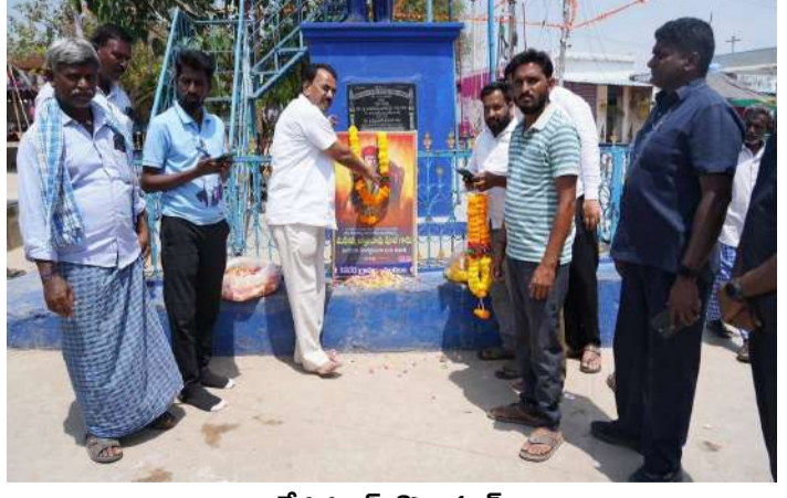
వేద న్యూస్, కొల్లూపూర్:

మహాత్మా జ్యోతిబా ఫూలే జయంతి సందర్భంగా నాగర్ కర్నూల్ జిల్లా కోడేరు మండల కేంద్రంలో రాష్ట్ర ఎక్సైజ్ మరియు వర్కాటక శాఖ మంత్రి జూపల్లి కృష్ణారావు ఘనంగా నివాళులర్పించారు. ఈ సందర్భంగా ఫులే చిత్రపటానికి పూలమాల వేసి అంజలి ఘటించిన మంత్రి, అట్టడుగు వర్గాల అభ్యున్నతికి ఆయన చేసిన సేవలను స్మరించుకున్నారు. మహాత్మా జ్యోతిబా ఫూలే తన జీవితాన్ని వెనుకబెడిన వర్గాలు మరియు మహిళల విద్యాభివృద్ధికి అంకితం చేశారని మంత్రి పేర్కొన్నారు. ఆయన వేసిన