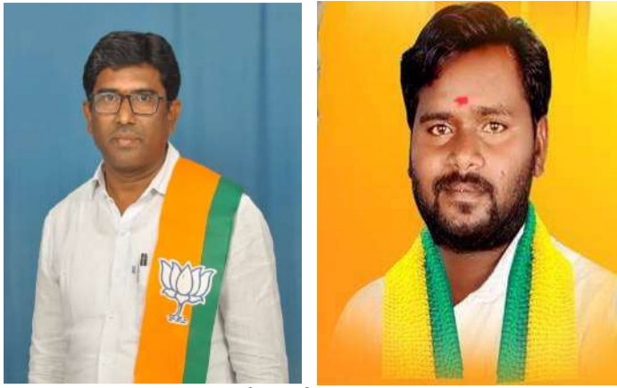
ఇల్లందకుంట మండలం లో పార్టీ శ్రేణులను సమన్వయం చేస్తూ ప్రజా సమన్వయ పోరాడేందుకు ఈ నూతన బృందం సిద్దమైంది, ఈ నియామకాలతో క్షేత్రస్థాయిలో పార్టీ కార్యకలాపాలను వేగవంతంగా ప్రజల్లోకి తీసుకెళ్లాడానికి వీలవుతుందని పేర్కొన్నారు.