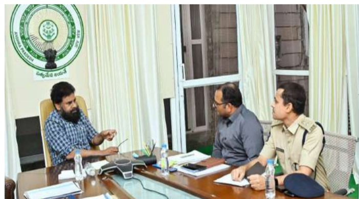
వేద న్యూస్, కాకినాడ:

కాకినాడ జిల్లా అభివృద్ధిపై ఉప ముఖ్యమంత్రి పవన్ కళ్యాణ్ ప్రత్యేక దృష్టి సారించారు. ప్రజల సమస్యలను నేరుగా తెలుసుకుని వేగంగా పరిష్కరించేందుకు ఆయన తరచూ జిల్లాలో పర్యటించాలని నిర్ణయించారు. రెండు నెలలకు ఒకసారి కాకినాడ, పిఠాపురం ప్రాంతాల్లో పర్యటించి ప్రజలతో నేరుగా మాట్లాడనున్నట్లు తెలిపారు. స్థానిక సమస్యలను ప్రత్యక్షంగా తెలుసుకుని తక్షణ చర్యలు తీసుకోవడం ద్వారా అభివృద్ధి సాధించారు.