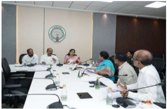
వేద న్యూస్, అమరావతి: