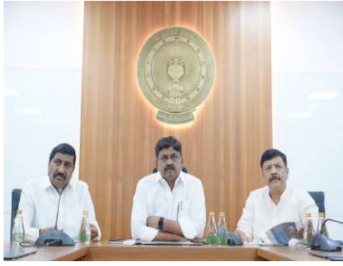
వేద న్యూస్, అమరావతి: