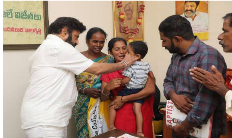
వేద న్యూస్, హిందూపురం: