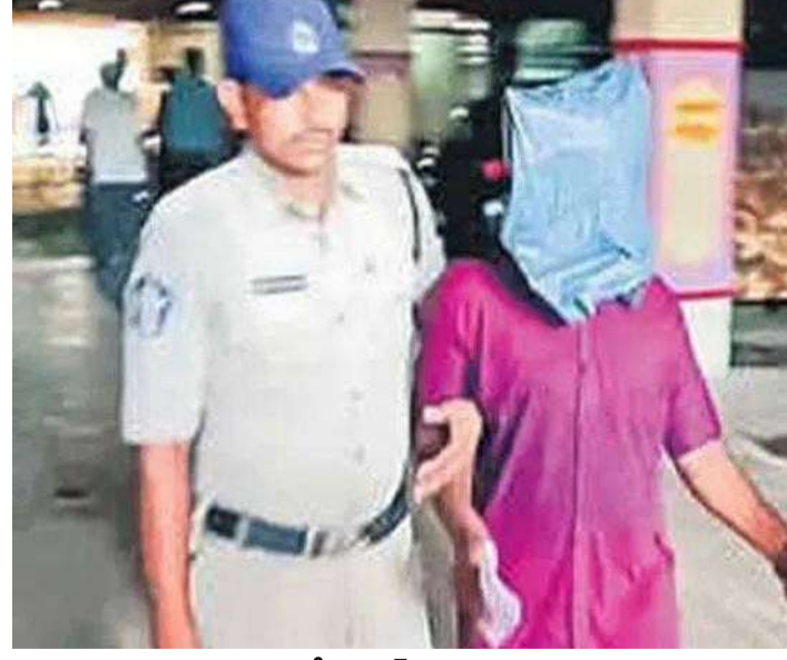
వేద న్యూస్, మాచర్ల:

పల్నాడు జిల్లా మాచర్లలో ప్రభుత్వ ఉద్యోగినిపై జరిగిన అత్యాచారం కేసులో సంచలన విషయాలు వెలుగులోకి వచ్చాయి. తొలుత గుర్తుతెలియని వ్యక్తి దాడి చేశాడని ఫిర్యాదు చేసిన బాధితురాలు, తర్వాత దర్యాప్తులో నిందితుడు తనకు పరిచయమున్న వ్యక్తేనని పోలీసులు గుర్తించారు. స్పాష్ చాట్ ద్వారా ఏర్పడిన పరిచయం ఈ ఘటనకు దారితీసిందని పోలీసులు తెలిపారు. ఘటన రోజున