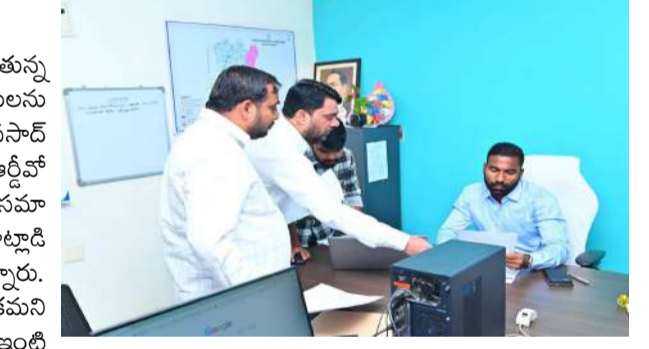
వేద న్యూస్, జగిత్యాల: