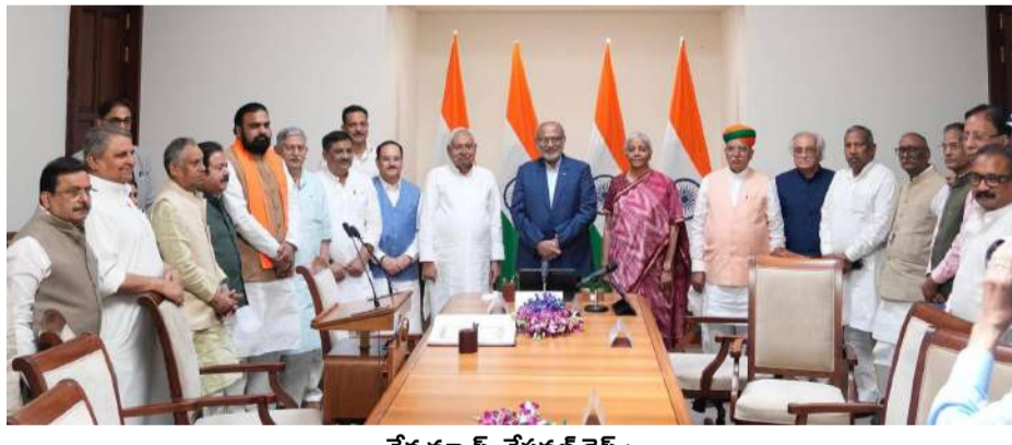
వేద న్యూస్, నేషనల్ డెస్క్: