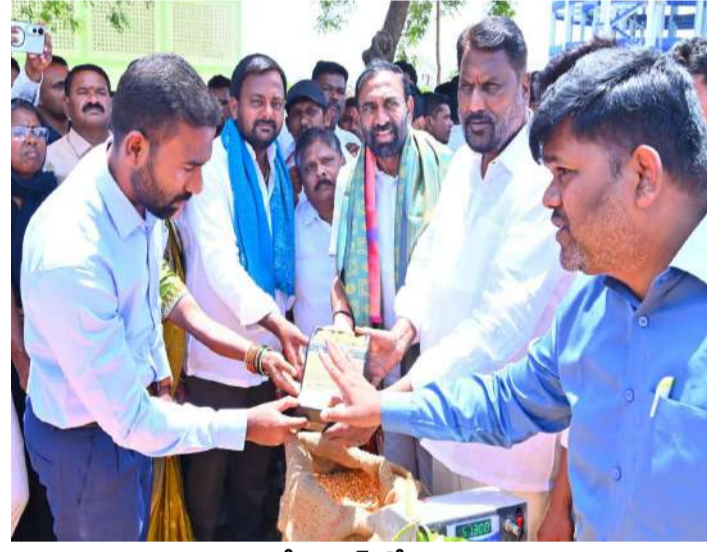
వేద న్యూస్, కోరుట్ల:

రైతుల సంక్షేమాన్ని దృష్టిలో ఉంచుకుని కోరుట్ల, మెట్పల్లి గొల్లపల్లి ప్రాంతాల్లో మొక్కజొన్న కొనుగోలు కేంద్రాలను ప్రారంభించారు. రాష్ట్ర