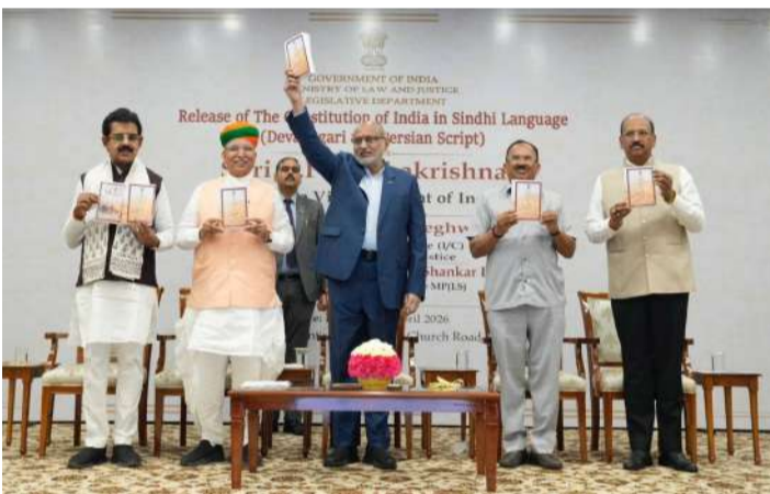
వేద న్యూస్, నేషనల్ డెస్క్:

భారత రాజ్యాంగాన్ని ప్రతి పౌరుడికి వారి మాతృభాషలో అందుబాటులోకి తీసుకురావాలనే లక్ష్యంతో కీలక ముందడుగు పడింది. ఉపరాష్ట్రపతి భవన్ లో నిర్వహించిన ప్రత్యేక కార్యక్రమంలో భారత రాజ్యాంగం సింధీ భాషా ప్రతిని విడుదల చేశారు. ఈ ప్రతిని దేవనాగరి, పర్షియన్ లిపుల్లో రూపొందించడం విశేషం. సింధీ భాషా దినోత్సవం సందర్భంగా జరిగిన ఈ కార్యక్రమం భాషా వైవిధ్యానికి గౌరవం చాటడమే కాకుండా రాజ్యాంగ విలువలను మరింత