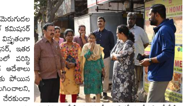
వేద న్యూస్, మేడ్చల్:

పౌర మౌలిక సదుపాయాల మెరుగుదల లక్ష్యంగా సైబరాబాద్ మున్సిపల్ కమిషనర్ మేడ్చల్ సర్కిల్ పరిధిలో విస్తృతంగా పర్యటించారు. డిప్యూటీ కమిషనర్, ఇతర అధికారులతో కలిసి క్షేత్రస్థాయిలో పరిస్థితులను సమీక్షించి పలు కీలక ఆదేశాలు జారీ చేశారు. చెరువుల్లో పేరుకు పోయిన గుర్రపుడెక్కును వెంటనే తొలగించాలని, మురుగునీరు, ఘన వ్యర్థాలు చేరకుండా కఠిన చర్యలు తీసుకోవాలని సూచించారు. భూగర్భ డ్రైనేజీ వ్యవస్థలో పూడికతీత చేపట్టి, లీకేజీలు లేకుండా పర్యవేక్షణ పెంచాలని అధికారులకు ఆదేశించారు. మేడ్చల్ హైవే నుంచి అయోధ్య ఎక్స్ ప్రెస్ వరకు రహదారులపై గుంతలను పూడ్చి, ప్యావ్ వర్క్ పనులు తక్షణమే పూర్తి చేయాలని సూచించారు. వర్షాకాలాన్ని దృష్టిలో ఉంచుకుని వరద నీటి కాలువలను శుభ్రపరచాలని, పారిశుధ్య పనులను క్రమం తప్పకుండా నిర్వహించాలని తెలిపారు. నగరంలో క్రీడా ప్రాంగణాలు, థియేటర్లు అభివృద్ధికి అనువైన స్థలాలను గుర్తించాలని అధికారులను కోరారు. ప్రజల ఫీడ్ బ్యాక్ ఆధారంగా సమస్యలకు త్వరితగతిన పరిష్కారం చూపాలని ఆదేశించారు. పనుల్లో నిర్లక్ష్యం పాపిస్తే కఠిన చర్యలు తీసుకుంటామని హెచ్చరిస్తూ, మేడ్చల్ సర్కిల్ ను ఆదర్శంగా తీర్చిదిద్దాలని కమిషనర్ పిలుపునిచ్చారు.