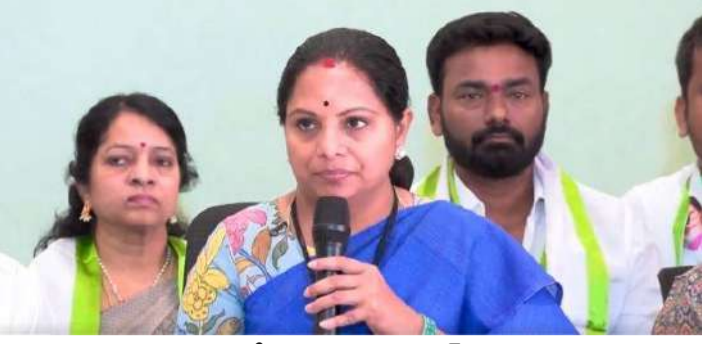
వేద న్యూస్, హైదరాబాద్:

హైదరాబాద్ మెట్రోపాలిటన్ డెవలప్ మెంట్ అథారిటీ పరిధిలో జరుగుతున్న పనుల కేటాయింపులపై ఎమ్మెల్యే, తెలంగాణ జాగ్రతి అధ్యక్షురాలు కల్వకుంట్ల కవిత తీవ్రస్థాయిలో విరుచుకుపడ్డారు. కాంగ్రెస్ ప్రభుత్వం పారదర్శకతను విస్మరించి, భారీ ఎత్తున నామినేషన్ పద్ధతిలో కాంట్రాక్టులను కట్టబెడుతూ అవినీతికి పాల్పడుతోందని ఆమె ఆరోపించారు. నిబంధనలకు విరుద్ధంగా జరుగుతున్న ఈ పనుల కేటాయింపులపై ప్రభుత్వం తక్షణమే సమాధానం చెప్పాలని ఆమె డిమాండ్ చేశారు. ప్రజా ధనాన్ని దుర్వినియోగం చేస్తూ తమకు కావాల్సిన వారికి పనులు అప్పగించడం ప్రజాస్వామ్య విలువలకు విరుద్ధమని ఆమె ఈ సందర్భంగా పేర్కొన్నారు. హెచ్ఎండీఏ పరిధిలో పనుల కేటాయింపులను సంబంధించి గతంలోనే ఒక ఉన్నత స్థాయి ఆఫీసర్ కమిటీ కొన్ని కీలక సిఫార్సులు చేసినదని కవిత గుర్తు చేశారు. పనులను నామినేషన్ పద్ధతిలో కాకుండా కేవలం బహిరంగ బిందర్బా ద్వారానే కట్టబెట్టాలని ఆ కమిటీ స్పష్టంగా నివేదిక ఇచ్చిందని ఆమె తెలిపారు. అయినప్పటికీ ముఖ్యమంత్రి రేవంత్ రెడ్డి ఆ రిపోర్టును ఏమాత్రం పట్టించుకోకుండా పక్షాన పెట్టేశారని ఆమె విమర్శించారు. నిపుణుల కమిటీ సూచనలను బేఖాతరు చేస్తూ ప్రభుత్వం మొండిగా ముందుకు వెళ్లడం వెనుక పెద్ద ఎత్తున క్విట్ ఫ్రో కో కుట్ర దాగి ఉందని తెలంగాణ జాగ్రతి అధ్యక్షురాలు అనుమానం వ్యక్తం చేశారు. సుమారు 1,142 కోట్ల