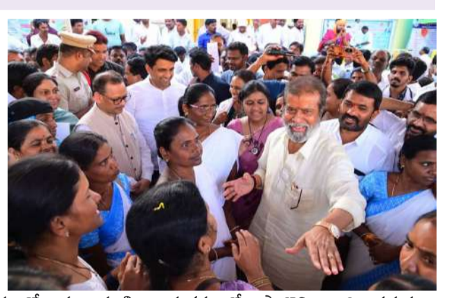
వేద న్యూస్, నాగర్ కర్నూల్: