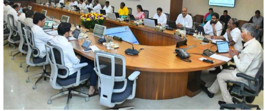
వేద న్యూస్, అమరావతి:

ముఖ్యమంత్రి నారా చంద్రబాబు నాయుడు అధ్యక్షతన జరిగిన ఆంధ్రప్రదేశ్ మంత్రివర్గ సమావేశంలో పలు కీలక నిర్ణయాలు తీసుకున్నారు. వెలగపూడి సచివాలయంలో జరిగిన ఈ సమావేశంలో 60 అంశాలపై చర్చించి ఆమోదం తెలిపారు. అమరావతికి చట్టబద్ధత కల్పించినందుకు ప్రధానమంత్రి నరేంద్ర మోదీకి కేబినెట్ ధన్యవాదాలు తెలిపింది. రాజధాని అంశంపై ఉన్న అనిశ్చితి తొలగిపోయిందని ప్రభుత్వం పేర్కొంది. రాష్ట్ర అభివృద్ధికి దోహదపడే రూ.39 వేల కోట్ల పెట్టుబడి ప్రతిపాదనలకు ఆమోదం లభించింది. దీని ద్వారా పరిశ్రమలు స్థాపించి ఉపాధి అవకాశాలు పెరుగుతాయని ప్రభుత్వం విన్నోంది. విశాఖపట్టణంలో క్వంటం వ్యాజీలో మూడు సంవత్సరాల ఏర్పాటుకు గ్రీన్ సిగ్నల్ ఇచ్చారు. ఐటీ రంగంలో రాష్ట్రం మరింత ముందుకు సాగుతుందని తెలిపారు. విద్యా రంగంలో సంస్కరణల భాగంగా విద్యా కమిషన్ను రద్దు చేసి, ప్రైవేట్ ఫీజుల నియంత్రణ కోసం కొత్తగా ఫీజ్ రెగ్యులేటరీ కమిటీ ఏర్పాటు చేయాలని నిర్ణయించారు. ఇక భూ కేటాయింపులు, అభివృద్ధి కార్యక్రమాలు, ప్రభుత్వ పథకాల అమలుపై కూడా చర్చించి, ప్రజలకు మరింత చేరువయ్యేలా చర్యలు తీసుకోవాలని ముఖ్యమంత్రి మంత్రులకు సూచించారు.