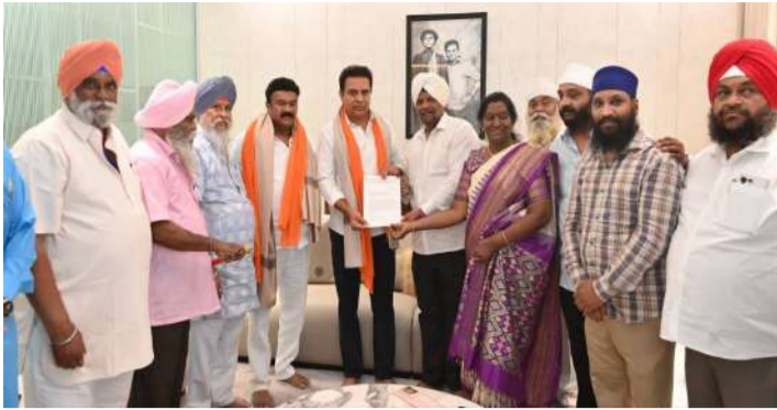
వేద న్యూస్, హైదరాబాద్:

సిక్కు సమాజం అత్యంత పవిత్రంగా జరుపుకునే ఖల్సా సాజన్ దివస్ వైశాఖి వేడుకలకు బీఆర్ఎస్ వర్కింగ్ ప్రెసిడెంట్ కేటీఆర్ కు ఆహ్వానం అందింది. అమీర్ పేట్ గురుద్వారా కమిటీ ప్రతినిధులు మాజీ మంత్రి తలసాని శ్రీనివాస్