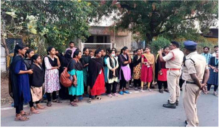
వేద న్యూస్, కడప:

మహిళల భద్రతకు ప్రాధాన్యత ఇస్తూ కడప జిల్లా పోలీస్ శాఖ అధ్యక్షులలో ప్రత్యేక అవగాహన కార్యక్రమం నిర్వహించారు. జిల్లా ఎస్పీ