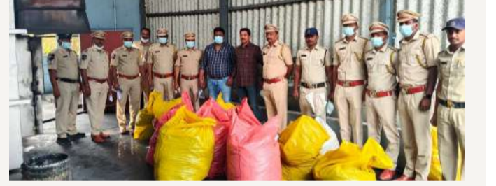
వేద న్యూస్, ఖమ్మం ప్రతినిధి: