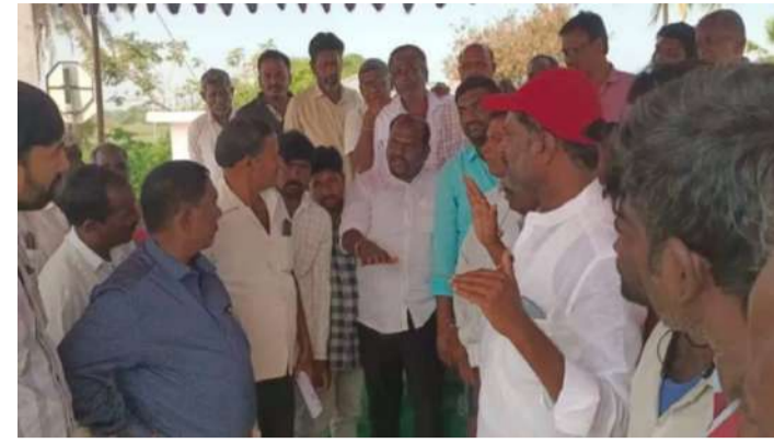
వేద న్యూస్, శంకరపట్నం:

శంకరపట్నం మండలంలోని కొత్తగట్టు, గొల్లపల్లి గ్రామాల మీదుగా కరీంనగర్-వరంగల్ మధ్య నాలుగు వరుసల జాతీయ రహదారి నిర్మాణ