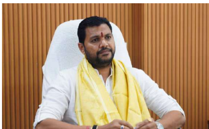
వేద న్యూస్, హైదరాబాద్ :