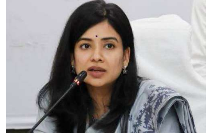
వేద న్యూస్, రాజన్న సిరిసిల్ల: