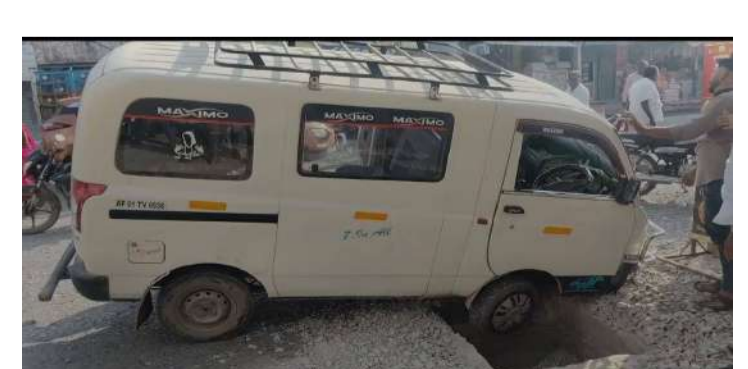
- విద్యార్థులకు తప్పిన ముప్పు