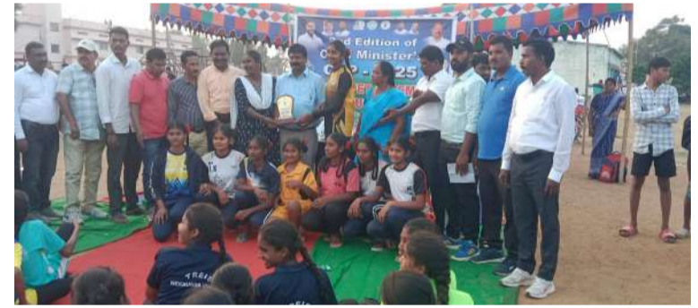
వేద న్యూస్, నల్లబెల్లి:

- సీఎం కెప్ లో సంజనకు డివిజన్ టాప్ విజయం