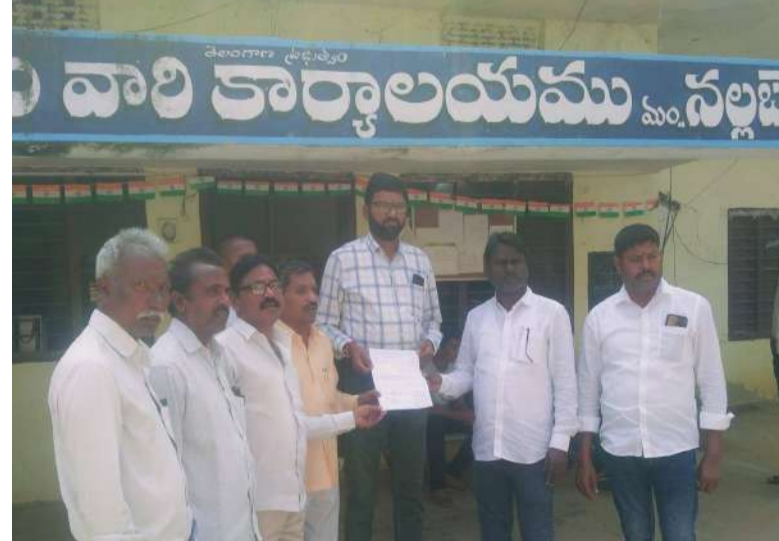
వేద న్యూస్, నల్లబెల్లి: