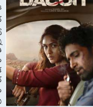
వేద న్యూస్ డెస్క్: