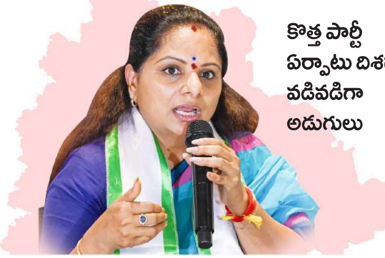
దుకు ఆమె సిద్ధమవుతున్నారు.

ప్రస్తుత కాంగ్రెస్ ప్రభుత్వంపై కవిత పదవైన విమర్శలతో విరుచుకుపడుతున్నారు. ముఖ్యమంత్రి రేవంత్ రెడ్డి పాలనలో రాష్ట్ర అభివృద్ధి కుంటుపడిందని, ఎన్నికల హామీల అమలులో ప్రభుత్వం విఫలమైందని ఆమె ప్రజల్లోకి తీసుకెళ్లే ప్రయత్నం చేస్తున్నారు. ప్రజల గొంతుకగా నిలిచేందుకు ఒక బలమైన వేదిక అవసరమని, అందుకే కొత్త పార్టీ స్థాపన అనివార్యమని ఆమె తన అనుచరులతో చెబుతున్నట్లు సమాచారం. ఈ క్రమంలోనే ప్రభుత్వం చేసే ప్రతి తప్పును ఎండగడుతూ, ప్రతిపక్ష పాత్రను సమర్థవంతంగా పోషించే