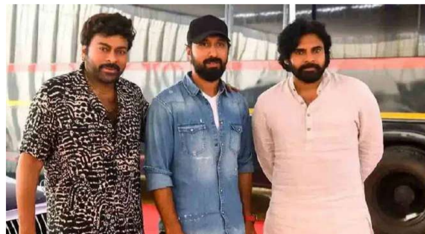
వేద న్యూస్ డెస్క్:

దర్శకుడు బాబీ తాజాగా నటుడు పవన్ కల్యాణ్ ను కలిసిన విషయం సినీ వర్గాల్లో చర్చనీయాంశంగా మారింది. ఈ భేటీకి సంబంధించిన ఫోటోలు సామాజిక మాధ్యమాల్లో వైరల్ కావడంతో, ఈ ఇద్దరూ మళ్లీ కలిసి సినిమా చేయబోతున్నారా అనే ఊహాగానాలు ఊపందుకున్నాయి. అయితే తాజా సమాచారం ప్రకారం, ఈ సమావేశం వెనుక సినిమా ప్రాజెక్ట్ కంటే వేరే కారణం ఉన్నట్లు తెలుస్తోంది. నటుడు చిరంజీవితో బాబీ రూపొందించనున్న కొత్త చిత్రానికి సంబంధించిన పూజా కార్యక్రమానికి పవన్ కల్యాణ్ ను ముఖ్య అతిథిగా ఆహ్వానించేందుకు ఈ భేటీ జరిగినట్లు సినీ వర్గాలు చెబుతున్నాయి. ఈ నేపథ్యంలోనే బాబీ పవన్ ను ప్రత్యక్షంగా కలిసి ఆహ్వానం అందించినట్లు సమాచారం. ఇటీవల బాబీ దర్శకత్వంలో వచ్చిన చిత్రంతో చిరంజీవి మంచి విజయాన్ని అందుకున్న విషయం తెలిసింది. ఈ కాంటినెంట్ లో మరో సినిమా రాబోతుండటంతో అభిమానుల్లో భారీ అంచనాలు నెలకొన్నాయి. త్వరలో ఈ చిత్రానికి సంబంధించిన పూజా కార్యక్రమం ఘనంగా నిర్వహించే అవకాశం ఉన్నట్లు తెలుస్తోంది. మరోవైపు పవన్ కల్యాణ్ ప్రస్తుతం పలు ప్రాజెక్టులతో బిజీగా ఉన్నారు. అయినప్పటికీ సినీ రంగానికి సంబంధించిన ముఖ్య కార్యక్రమాల్లో పాల్గొనడానికి ఆయన ఆసక్తి చూపుతున్నట్లు తెలుస్తోంది. ఈ నేపథ్యంలో బాబీపవన్ భేటీపై వచ్చిన సందేహాలకు ఇప్పుడు స్పష్టత వచ్చినట్లుంది. మొత్తంగా చూస్తే, ఈ భేటీ కొత్త సినిమా కోసం కాకుండా, చిరంజీవిబాబీ ప్రాజెక్టుకు సంబంధించిన కార్యక్రమం కోసమే జరిగినట్లు తెలుస్తోంది. అయితే భవిష్యత్తులో ఈ కాంటినెంట్ లో సినిమా వచ్చే అవకాశాలపై కూడా అభిమానులు ఆసక్తిగా ఎదురుచూస్తున్నారు.