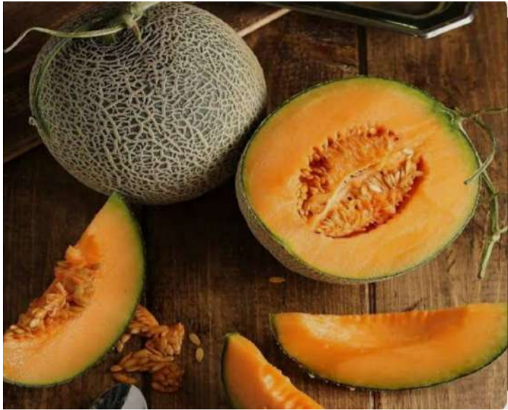
వేద న్యూస్ డెస్క్:

వేసవి కాలంలో లభించే కర్ణాటక పండు రుచికరం కాదు ఆరోగ్యానికి కూడా ఎంతో మేలు చేస్తుంది. అయితే చాలా మంది పండును తిని దాని గింజలను పారేస్తుంటారు. వాస్తవానికి కర్ణాటక గింజల్లో శరీరానికి అవసరమైన ప్రోటీన్లు, విటమిన్లు మరియు ఖనిజాలు పుష్కలంగా ఉంటాయని పోషకాహార నిపుణులు పేర్కొంటున్నారు. వీటిని ఎండబెట్టి తీసుకుంటే మెదడు చురుగ్గా పనిచేయడమే కాకుండా శరీరానికి అవసరమైన తక్కువ శక్తి లభిస్తుంది. ఈ మధ్య కాలంలో వీటిపై పెరుగుతున్న అవగాహనతో మార్కెట్లో కూడా వీటికి విపరీతమైన గిరాకీ ఏర్పడింది. ఈ గింజల్లో లభించే ఒకే-3 ఫ్యూటీల్ యాసిడ్లు గుండె ఆరోగ్యానికి ఎంతో మేలు చేస్తాయి. ఇవి రక్తంలోని చెడు కొలెస్ట్రాల్‌ను తగ్గించి గుండె జబ్బులు రాకుండా కాపాడతాయి. అలాగే రక్తపోటును నియంత్రించడంలో కూడా ఇవి కీలక పాత్ర పోషిస్తాయి. ఇందులో ఉండే పొటాషియం రక్త ప్రసరణను మెరుగుపరుస్తుంది. గుండె కండరాలను బలోపేతం చేయడంలో మరియు ఒత్తిడిని తగ్గించడంలో ఈ గింజలు సహజ సిద్ధమైన మందుగా పనిచేస్తాయని పలు అధ్యయనాలు స్పష్టం చేస్తున్నాయి. రోగనిరోధక శక్తిని పెంచడంలో కర్ణాటక గింజలు ఎంతగానో ఉపయోగపడతాయి. వీటిలో ఉండే విటమిన్ సి తెల్ల రక్తకణాల ఉత్పత్తిని పెంచి ఇన్ఫ్లెక్షన్లతో పోరాడే శక్తిని శరీరానికి అందిస్తుంది. అలాగే కంటి చూపును మెరుగుపరచడానికి అవసరమైన విటమిన్ ఏ కూడా ఇందులో సమృద్ధిగా ఉంటుంది. తరచూ జలుబు, దగ్గు వంటి సమస్యలతో బాధపడే వారు తమ ఆహారంలో వీటిని చేర్చుకోవడం వల్ల మంచి ఫలితం ఉంటుంది. ముఖ్యంగా శీతాకాలం మరియు వానాకాలంలో వచ్చే సీజనల్ వ్యాధులు సుదీర్ఘ ఇవి రక్షణ కలిగిస్తాయి. జీర్ణక్రియను మెరుగు పరచడంలో మరియు మలబద్ధకం సమస్యను వదిలించుకోవడంలో కర్ణాటక గింజలు దోహదపడతాయి.