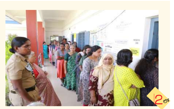
2లో మూడు రాష్ట్రాల్లో ప్రశాంతంగా ముగిసిన పోలింగ్