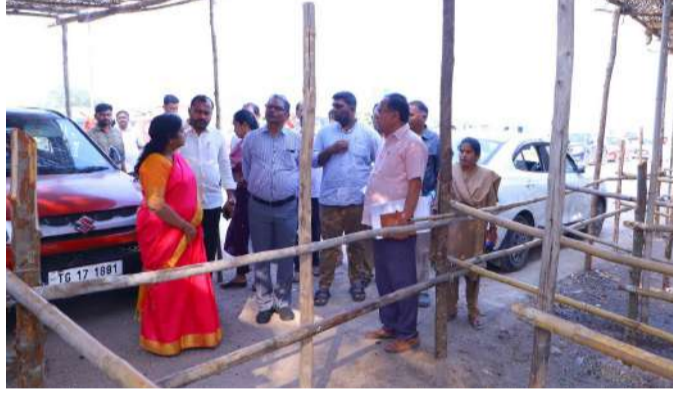
వేద న్యూస్, వేములవాడ: