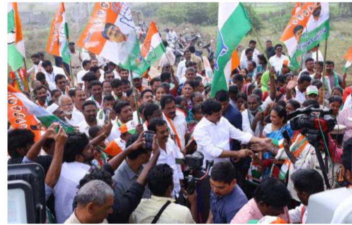
వేద న్యూస్, ఖమ్మం ప్రతినిధి:

అధికారంలో ఉన్న పదేళ్ల పాటు నిరుపేదల ఇళ్ల స్థలాల గురించి పట్టించుకోకుండా అరాచకంగా వ్యవహరించిన వారు.. నేడు ఎన్నికలు రాగానే ఓట్ల కోసం ఆరాటపడుతున్నారు అని మంత్రి పొంగులేటి శ్రీనివాస్ రెడ్డి బీఆర్ఎస్ పార్టీపై తీవ్ర స్థాయిలో ద్వేషమెత్తారు. మంగళవారం ఏడులాపురం మున్సిపాలిటీ పరిధిలోని 7, 8, 9, 12, 13 వార్డుల్లో నిర్వహించిన ఎన్నికల ప్రచార రోడ్ షోలో పాల్గొన్న ఆయన, వివక్షల తీరుపై నిప్పులు చెరిగారు. గత పాలకులు పేదల సొంతింటి కలను పూర్తిగా నిర్లక్ష్యం చేశారని, ఆనాడు అర్జున నిరుపేదలకు ఇళ్ల స్థలాలు ఇవ్వకుండా వంచించారని మండిపడ్డారు. ఈ సందర్భంగా జరిగిన సభల్లో మంత్రి