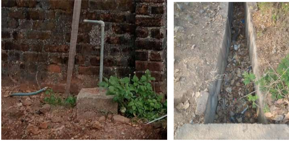
వేద న్యూస్, బోయినపల్లి:

రాజన్న సిరిసిల్ల జిల్లా బోయినపల్లి మండలంలోని పలు గ్రామాల్లో గ్రామాభివృద్ధికి నాంది పలుకుతామని ఎన్నికల సమయంలో హామీలు ఇచ్చిన కొత్త సర్పంచ్లు అధికారంలోకి వచ్చి నెలలు గడుస్తున్నా చాలా చోట్ల పరిస్థితి మాత్రం యథాతథంగానే కొనసాగుతోంది. రోడ్లు, తాగునీరు, పారిశుధ్యం, వీధి దీపాలు వంటి మౌలిక సదుపాయాలు ఇప్పటికీ సమస్యగానే మారాయి. ఎన్నికల సమయంలో గ్రామాన్ని ఆదర్శంగా తీర్చిదిద్దడామని చెప్పిన నాయకులు, అధికారంలోకి వచ్చిన తర్వాత పాత పాలనకే కొనసాగింపుగా మారారని గ్రామస్థులు ఆరోపిస్తున్నారు. ముఖ్యంగా కొన్ని ప్రాంతాల్లో మురుగు నీరు నిలిచిపోవడం, సీసీ రోడ్ల పనులు అర్ధాంతరంగా నిలిచిపోవడం వల్ల ప్రజలు తీవ్ర ఇబ్బందులు ఎదుర్కొంటున్నారు. దీంతో రోజువారీ జీవితం అస్తవ్యస్తంగా మారుతోందని వారు వాపోతున్నారు. కొత్త సర్పంచ్ వస్తే అయినా సమస్యలు పరిష్కారమవుతాయని ఆశించాం. కానీ పరిస్థితిలో ఎలాంటి మార్పు లేదు.. అని పలు గ్రామాల ప్రజలు ఆవేదన వ్యక్తం చేస్తున్నారు. మరోవైపు గ్రామాల్లో ఉపాధి అవకాశాలు లేక యువత వలస బాట పట్టాలని పరిస్థితి నెలకొంది. నిధుల కొరత కారణంగా అభివృద్ధి పనులు ఆలస్యం అవుతున్నాయని ప్రజాప్రతినిధులు చెబుతున్నా. గ్రామస్థులు మాత్రం పాలకులలో చిత్తశుద్ధి లేవనిపించిన తీవ్రంగా విమర్శిస్తున్నారు. మొత్తానికి కొత్త సర్పంచ్లు వచ్చినప్పటికీ గ్రామాల్లో అజీవన స్థాయిలో మార్పు కనిపించకపోవడం ప్రజల్లో నిరాశను పెంచుతోంది. ఇకవైనా పాలకులు స్పందించి గ్రామాభివృద్ధిపై దృష్టి పెట్టాలని గ్రామస్థులు కోరుతున్నారు.