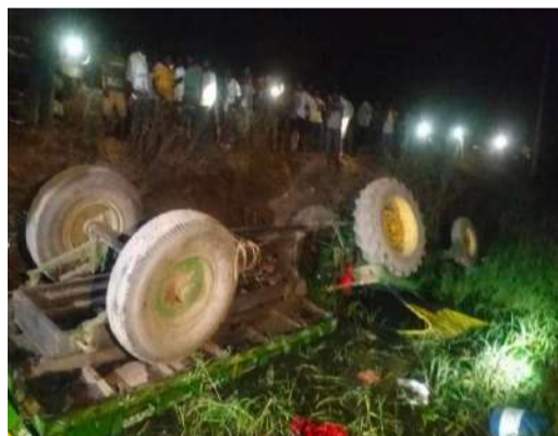
వేద న్యూస్, ఇల్లహింపట్లం:

మల్లాపూర్ మండలం మొగిలిపేట గ్రామంలో పసుపు రిక్కుదానికి వెళ్లి తిరిగి వస్తున్న ట్రాక్టర్ టోల్టా పడి నలుగురు కూలీలు అక్కడికక్కడే మృతి చెందారు. ఈ ప్రమాదంలో పలువురు కూలీలకు తీవ్ర గాయాలయ్యాయి. స్థానికులు తెలిపిన వివరాల ప్రకారం పని ముగించుకుని తిరిగి వస్తున్న సమయంలో ట్రాక్టర్ టోల్టాపడడంతో ఈ ప్రమాదం జరిగిందని అన్నారు. ఫుటన స్థలానికి పోలీసులు చేరుకొని దర్యాప్తు చేస్తున్నారు.