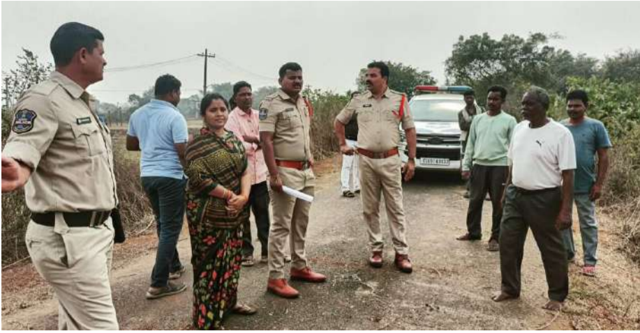
వేద న్యూస్, కారేపల్లి: