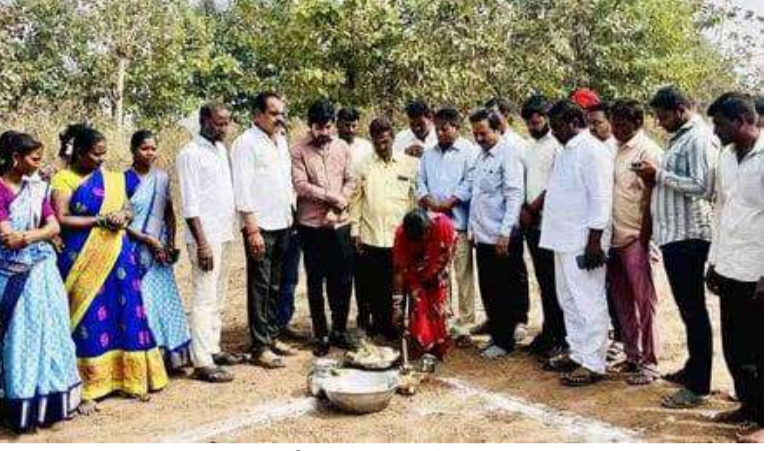
వేద న్యూస్, కాసిపేట:

మంచెలపల్లె జిల్లా కాసిపేట మండలంలోని వెంకటాపూర్ గ్రామంలో మంగళవారం గ్రామ పంచాయతీ నూతన భవనం, ఐకేపీ భవనాల నిర్మాణాలకు భూమి పూజ కార్యక్రమం ఘనంగా నిర్వహించారు. గ్రామాభివృద్ధి దిశగా కీలక ముందడుగుగా ఈ నిర్మాణ పనులను ఎన్ఆర్ఈజీఎస్ నిధులతో రూ.30 లక్షల వ్యయంతో ప్రారంభించారు.