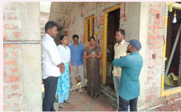
వేద న్యూస్, వీరపల్లి: