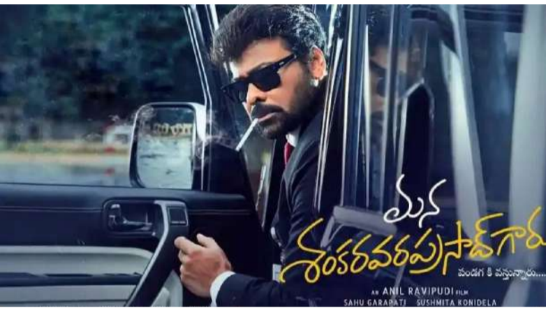
దీనిపై ఇంకా అధికారిక ప్రకటన వెలువడలేదు. ధియేటర్లలో పుల్ లెన్గ్ విన్డం అందించిన ఈ సినిమా, ఓటీటీ ప్రేక్షకుల నుంచి కూడా మంచి స్పందన పొందుతుందని సినీ విశ్లేషకులు భావిస్తున్నారు.