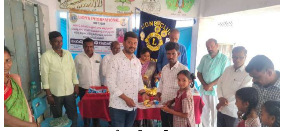
వేద న్యూస్, రుద్రూర్: