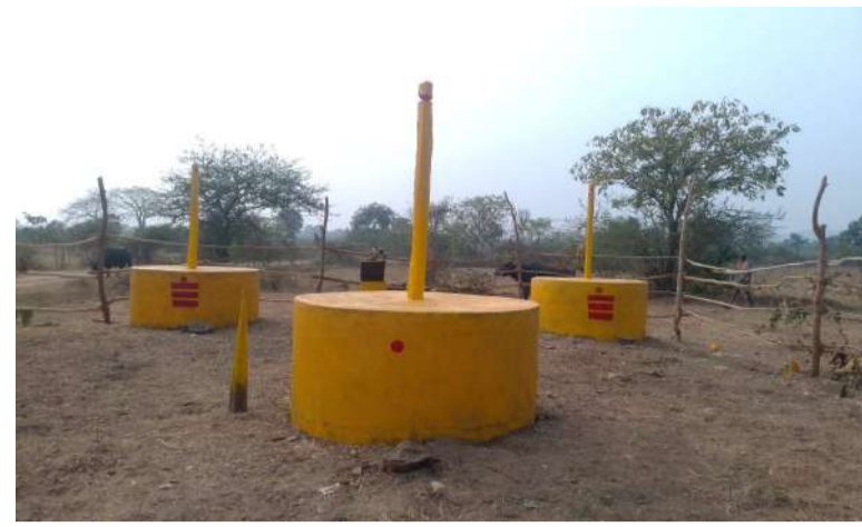
వేద న్యూస్, కారేపల్లి:

కారేపల్లి మండలం గోలు రేలకాయలపల్లి గ్రామపంచాయతీలో సమృద్ధి-సారలమ్మ దేవతల మినీ మేడారం జాతర నేటి నుంచి ప్రారంభమైంది. రెండు రోజుల పాటు సాగనున్న ఈ జాతరకు ఏర్పాట్లు పూర్తయ్యాయి. బుధవారం అటవీ ప్రాంతం నుంచి అమ్మవార్లను సంప్రదాయ వాయిద్యాల నడుమ గద్దెలపైకి ప్రతిష్ఠించనున్నారు. గురువారం గద్దెలపై కొలువదీసిన వనదేవతలను దర్శించుకునేందుకు భక్తులు భారీగా తరలివచ్చే అవకాశం ఉంది. భక్తులు మొక్కులు చెల్లించుకుని నిలువెత్తు బంగారం (తెల్లం) సమర్పించనున్నారు. భక్తులకు తాగునీరు, అన్నదాన కార్యక్రమాలు ఏర్పాటు చేయగా, రద్దీ దృష్ట్యా ప్రత్యేక పోలీస్ బందోబస్తు, పార్కింగ్ సౌకర్యాలు కల్పించారు. పరిసర ప్రాంతాలతో పాటు ఇతర జిల్లాల నుంచి భక్తులు పెద్ద సంఖ్యలో హాజరవుతారని నిర్వాహకులు తెలిపారు.