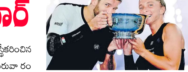
జంట 4-2, 4-2తో డేనియల్ కాలిన్స్-క్లియన్ హ్యారిసన్ ను చిత్తు చేసింది. మరో మ్యాచ్ లో స్వియెటిక్-రూడ్ ద్వయం 3-5, 5-3, 10-8తో టామ్ సీడ్ జెస్సికా పెగుల-జేక్ డ్రెవర్ పై పోరాడి నెగ్గింది.

న్యూయార్క్: డిఫెండింగ్ చాంప్ సారా ఎరాని జోడి ఘన వ్యవస్థీకరించిన యూఎస్ ఓపెన్ మిక్స్ డబుల్స్ టైటిల్ ను నిలబెట్టుకొంది. గురువారం జరిగిన ఫైనల్ లో ఇటలీ జంట ఎరాని-ఆండ్రీయా వసనోరి జోడి 6-3, 5-7, 10-6తో మూడో సీడ్ ఇగా స్వియెటిక్-కాస్పర్ రూడ్ జంటపై గెలిచింది. తుది పోరును మాత్రం రెగ్యులర్ ఫార్మాట్ లో నిర్వహించారు. సింగిల్స్ స్టాల్తో డ్రాను నింపేసినా అతిమంగా డబుల్స్ స్పెషలిస్టులకే టైటిల్ దక్కింది. అంతకుముందు జరిగిన సెమీస్ లో ఎరాని-వసనోరి