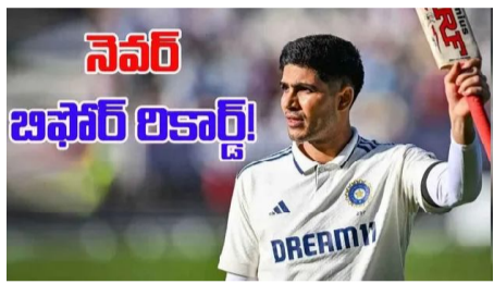
భారత టెస్ట్ జట్టు నూతన సారథి శుభ్షిత్ గిల్ ఛీకర్ ఫామ్ లో ఉన్నాడు. టీమిండియా పగ్గాలు చేపట్టినప్పటి నుంచి అతడి బ్యాట్ ఒక రేంజ్ లో

గర్జిస్తోంది. ఇంగ్లండ్ తో జరుగుతున్న టెస్ట్ సిరీస్ లో పరుగుల వర్షం కురిస్తున్నాడు గిల్. ఈ క్రమంలో పలు పాత రికార్డులకు పాతరు పెడుతూ పోతున్నాడు. లార్డ్ బెస్ట్ లో మరో క్రేజ్ రికార్డు సృష్టించాడు శుభ్షిత్. ఏకంగా టాప్ బ్యాటర్ విరాట్ కోహ్లాని రికార్డును అతడు అధిగమించాడు. ఈ సిరీస్ లో ఇప్పటివరకు ఆడిన 4 ఇన్నింగ్స్ లో కలిపి 585 పరుగులు చేసిన గిల్.