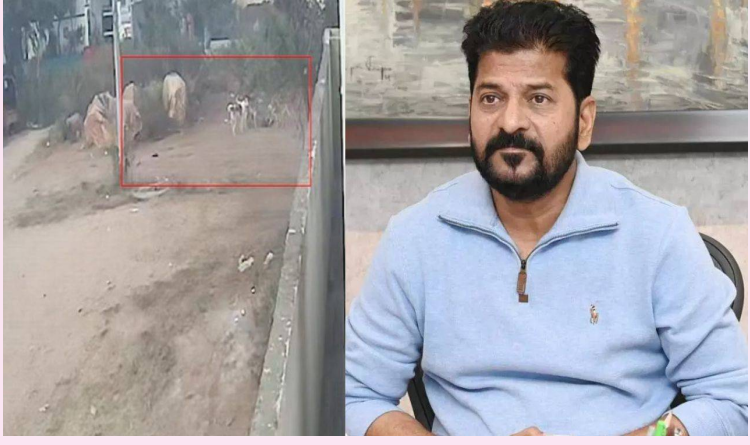
హైదరాబాద్, డిసెంబర్ 3 (తెలుగురేఖ):

- మెరుగైన వైద్యం అందించాలని రేవంట్ ఆదేశం