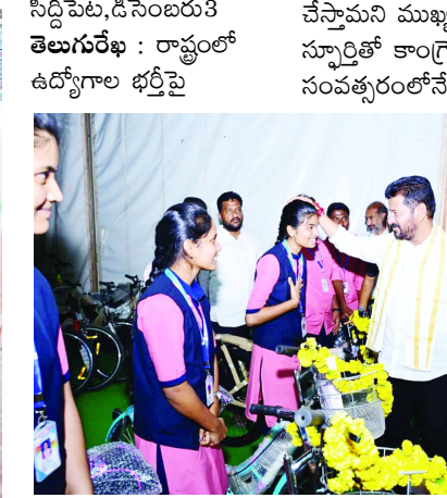
సిద్దిపేట, డిసెంబర్ 3 తెలుగు రేఖ : రాష్ట్రంలో ఉద్యోగాల భర్తీపై చేస్తామని ముఖ్యమంత్రి రేవంత్ రెడ్డి తెలిపారు. శ్రీకాంచారాని స్మార్టితో కాంగ్రెస్ పార్టీ అధికారంలోకి వచ్చిన మొదటి సంవత్సరంలోనే 60వేల ఉద్యోగాలు ఇచ్చాం. ప్రజాపాలన రెండున్నరేళ్ల పూర్తయ్యేలాగా లక్ష ఉద్యోగాలు భర్తీ చేస్తాం అన్నారు. పనిచేసే వాడిని, మంచోడిని గ్రామ సర్పంచ్ గా ఎన్నుకోవాలని సీఎం రేవంత్ రెడ్డి విజ్ఞప్తి చేశారు. వీలైనంత వరకు సర్పంచ్ లను ఏకగ్రీవం చేసుకోవాలని సూచించారు. పాఠశాలలు కొట్టే వాడిని సర్పంచ్ గా ఎన్నుకోవద్దని చెప్పారు. 2