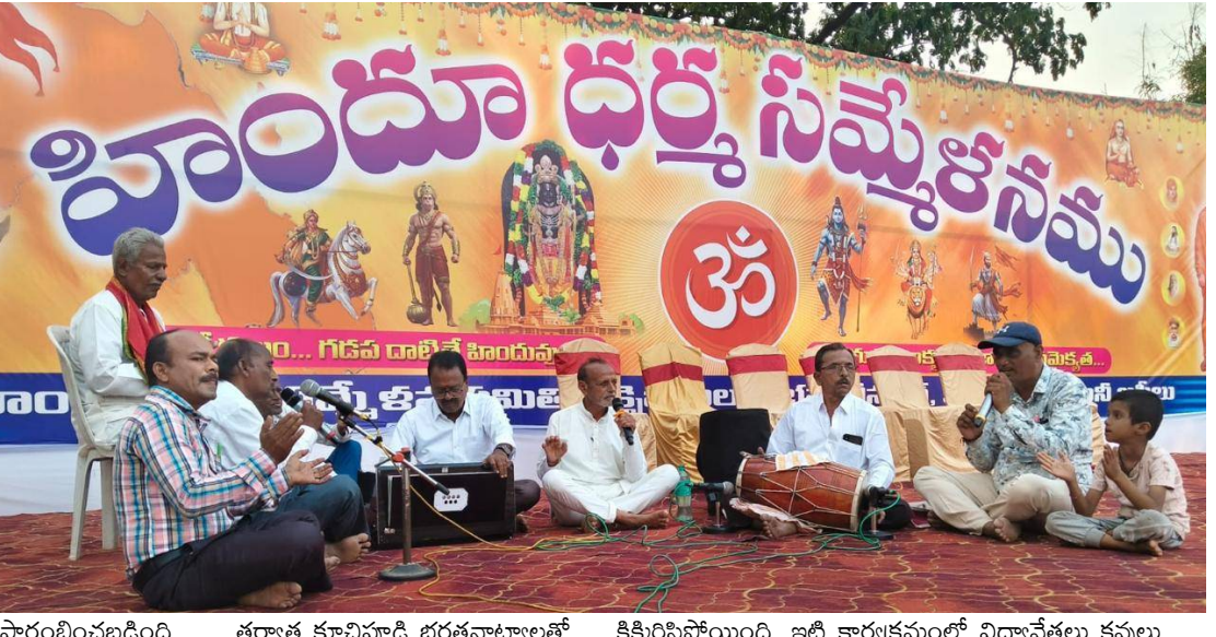
ప్రారంభించబడింది. తర్వాత కూచిపూడి భరతనాట్యాలతో మరియు ముఖ్య అతిథి విశిష్ట అతిథి ప్రధాన వ్యక్తులు ఇతర భక్తులు శ్రీరాముని యొక్క నామస్మరణతో ఈ సభా ప్రారంభం కిక్కిరిసిపోయింది. ఇట్టి కార్యక్రమంలో విద్యావేత్తలు కవులు కళాకారులు భక్తులు హిందూ ధర్మ భక్తులు ఇట్టి కార్యక్రమంలో పాల్గొన్నారు.