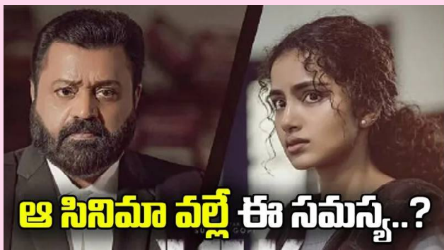
ఆ సీనిమా వల్లే ఈ సమస్య..?