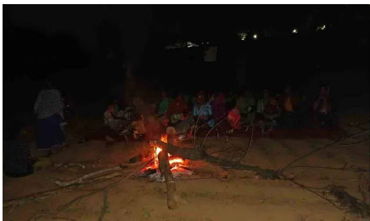
కాపాలుగా ఉంటున్నారు. ఈ దయనీయ స్థితి రంగారెడ్డి జిల్లా మొయినాబాద్ మున్సిపాలిటీ పరిధిలోని ఎన్కేపల్లి రైతులకు ఏర్పడింది.

మొయినాబాద్,జూలై 8(టండే విడుర):దశాబ్దాలుగా భూమిని నమ్ముకుని.. సాగు చేసుకుంటూ జీవనాధారం పొందుతున్న రైతులకు ప్రభుత్వం కంటిమీద కునుకు లేకుండా చేస్తున్నది. రైతులకు బువ్వ పెట్టే భూమిని ప్రభుత్వం అప్పనంగా తీసుకునే ప్రయత్నం చేస్తూ రైతులను నిర్వాసితులను చేయడానికి ప్రభుత్వం ప్రయత్నిస్తుంది. కంటి తుడుపుగా పరిహారం చెల్లిస్తే తీసుకునేది లేదని.. భూములను వదలమని రైతులు మొండిగా వ్యవహరిస్తున్నారు. ఏ సమయంలో ప్రభుత్వం పోలీసులను పెట్టి స్వాధీనం చేసుకుంటుందోనని భయంతోనే రైతులు భూముల వద్ద రాత్రి, పగలు కాపలా ఉంటున్నారు. ఆకలికి ఓర్చుకుంటూ రాత్రి సమయంలో చలి మంటలు కాస్తూ భూమికి