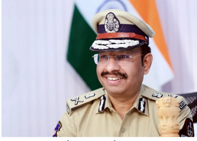
ఇతర ప్రభుత్వ శాఖలతో సమన్వయం చేసుకుంటూ పరిస్థితిని నిరంతరం పర్యవేక్షిస్తోందని, రవాణా