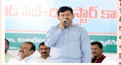
హైదరాబాద్, జనవరి 12 : తమ ప్రభుత్వం పేదల భూములకు రక్షణ కల్పించే చర్యలు తీసుకుంటుందని మంత్రి పాంగులేటి శ్రీనివాస్ రెడ్డి వ్యాఖ్యానించారు. అవుటర్ రింగ్ రోడ్డు లోపల 39 నబ్ రిజిస్టర్ కార్యాలయాలు ఉన్నాయని ఆయన పేర్కొన్నారు. వాటిని 12 క్లస్టర్లుగా విభజించి ఇంటిగ్రేటెడ్ నబ్ రిజిస్టర్ కార్యాలయాలు నిర్మిస్తున్నామని