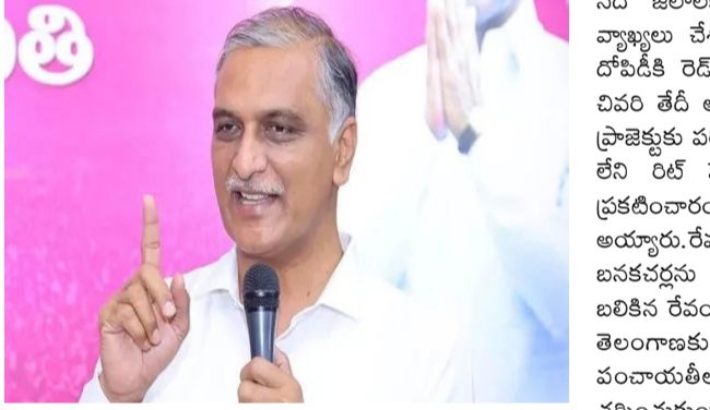
అని మాజీ మంత్రి అన్నారు. ఈలోగా ఏపీ ప్రభుత్వం ప్రాజెక్టు పనులు పూర్తి చేసుకొని, తెలంగాణ నీటి హక్కులను కాలరాస్తూ అప్పసంగా నీజ్లను తరలింతుకుపోతుందని మండిపడ్డారు. సంక్రాంతి పండుగ వేళ చంద్రబాబుకు రేవంత్ ఇచ్చిన గిఫ్ట్.. సుప్రీంకోర్టులో వేసిన ఈ బలహీనమైన రిట్ అంటూ మాజీ మంత్రి హరీష్ తీవ్రస్థాయిలో ధ్వజమెత్తారు. పోను.. పెట్టు అంటూనే ద్రోహం. పోలవరం-నల్లమల సాగర్ విషయంలో ముందు నుంచి రేవంత్ ప్రభుత్వం ఒక పద్ధతి ప్రకారం ఏపీకి పూర్తిగా సహకరిస్తోందని హరీష్ రావు ఆరోపించారు. పోను పోను అనుకుంటూనే రేవంత్ రెడ్డి ఆనాడు ఢిల్లీ మీటింగ్ కు వెళ్లారని.. ఎజెండాలో లేదంటూనే బనకచర్లపై చర్య జరిపారన్నారు. పెట్టుబోను అంటూనే సంతకం పెట్టి తెలంగాణ

హైదరాబాద్, జనవరి 12: నల్లమల సాగర్ లింక్ ప్రాజెక్టుకు సంబంధించి సుప్రీంకోర్టులో దాఖలు చేసిన పిటిషన్ ను తెలంగాణ ప్రభుత్వం ఉపసంహరించుకున్న విషయం తెలిసింది. దీనిపై మాజీ మంత్రి హరీష్ రావు మాట్లాడుతూ.. ముఖ్యమంత్రి రేవంత్ రెడ్డిపై తీవ్రస్థాయిలో విరుచుకుపడ్డారు. నల్లమల సాగర్ కు పూర్తిస్థాయిలో సహకరిస్తున్న రేవంత్ రెడ్డి నిజస్వరూపం, ద్రోహ బుద్ధి సుప్రీంకోర్టు సాక్షిగా బయటపడందని వ్యాఖ్యలు చేశారు. విచారణ అర్హత లేని పిటిషన్ వేసి ఏపీ ప్రభుత్వం అక్రమంగా పోలవరం నిర్మిస్తోందని మండిపడ్డారు. నాడు పాలమూరు - రంగారెడ్డి ప్రాజెక్టు గుర్తుచేశారు. రేవంత్ రెడ్డి సర్కార్ ఉద్దేశపూర్వకంగానే విచారణ అర్హత లేని పిటిషన్ వేసి తెలంగాణకు తీరని అన్యాయం చేసిందని మాజీ మంత్రి ఆరోపించారు. అది ముగియని కథి. 'ఈ మాత్రం విషయం మీ న్యాయవాది, మీ ఎంపీ అభిషేక్ మను సింఘ్ కి తెలియదా? ఈ మాత్రం దానికి నీజ్ మంత్రి ఉత్తమ్ కుమార్ రెడ్డి నూలు బూలు వేసుకొని ఢిల్లీ దాకా వెళ్లాడా?' అంటూ ఎద్దేవా హరీష్ చేశారు. ముఖ్యమంత్రిగా ఉంటూ తెలంగాణ నీటి హక్కులను ఏపీకి దారాదత్తం చేస్తూ రాష్ట్రానికి రేవంత్ రెడ్డి ద్రోహం చేస్తున్నారని ఆరోపణలు గుప్పించారు. రిట్ ఉపసంహరించుకొని, సివిల్ సూట్ పైలే చేస్తామని తెలంగాణ ప్రభుత్వం చెప్పడం అంటే, పోలవరం - నల్లమల సాగర్ ప్రాజెక్టు కట్టుకోవడానికి ఏపీకి గడువు ఇవ్వడమే అని హరీష్ రావు విమర్శించారు. ఏపీ, తెలంగాణతోపాటు మహారాష్ట్ర, కర్ణాటక వాదనలు కూడా వినడం అనేది ఎందుకీ గడిచినా ముగియని కథి