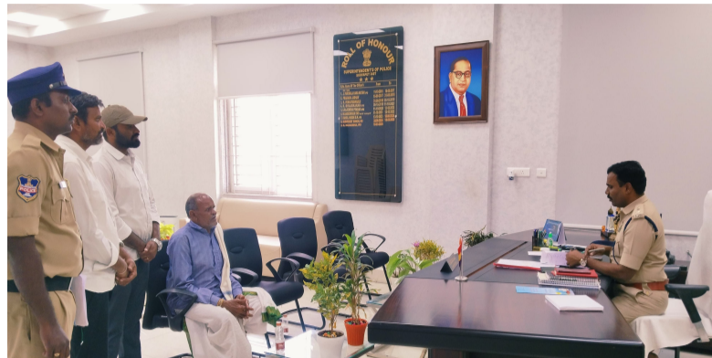
టండే తెలంగాణ స్టాన్ (సూర్యాపేట)