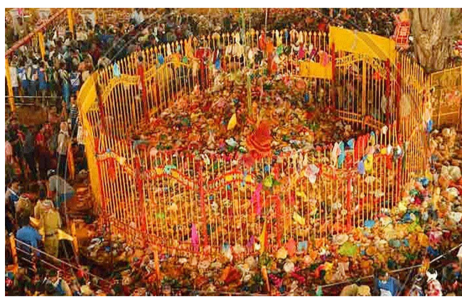
జంపన్న మేడారానికి పయనమవుతారు. జనవరి 28: కన్నెపల్లి నుంచి సారలమ్మ, కొండాం నుంచి గోవిందరాజులు, పూనుగొండ నుంచి పగడిద్రరాజు గద్దెలపై కొలువుదీరుతారు. జనవరి 29 (కీలక ఘట్టం): చిలుకలగుట్ట నుంచి కుంకుమ భరిణి రావంతో ఉన్న సమృద్ధి దేవతను పూజారులు తీసుకువచ్చి

ములుగు జిల్లా: ఆసియాలోనే అతిపెద్ద గిరిజన జాతరగా పేరుగాంచిన మేడారం సమృద్ధి-సారలమ్మ మహా జాతరకు సమయం దగ్గర పడుతోంది. ములుగు జిల్లా తాడూరు మండలంలోని మేడారం గ్రామం వనదేవతల రాక కోసం ముస్తా బవుతోంది. కోట్లాది మంది భక్తుల ఆరాధ్య దైవాలైన సమృద్ధి-సారలమ్మల మహా జాతర గడియలు సమీపిస్తుండటంతో అటవి ప్రాంతమంతా ఆధ్యాత్మిక శోభను సంతరించుకుంది. నాలుగు రోజుల పాటు అతీష జనవాహినీ మధ్య జరిగే ఈ మహా ఉత్సవానికి ఇప్పటికే పూజారులు ముహూర్తాలు ఖరారు చేశారు. జాతర కీలక ఘట్టాలు.. పూర్తి షెడ్యూల్ ఇదే. మహా జాతరకు రెండు వారాల ముందు సుచే మేడారంలో ఆచార వ్యవహారాలు మొదలవుతాయి. జనవరి 14 గుడిమెలిగే పండగ: దేవతలకు ధూపదీప వైవిధ్యాలతో ప్రత్యేక పూజలు నిర్వహిస్తారు. జనవరి 21న మండమెలిగే పండగ: జాతర విజయవంతం కావాలని కోరుతూ పూజారులు దేవతలను ప్రార్థిస్తారు. ఈ రెండు పండగలు ముగియడంతోనే మేడారంలో జాతర వాతావరణం పీక్ స్టేజికి చేరుకుంటుంది. వనదేవతలు గద్దెలకు చేరుకునే క్రమం అత్యంత భక్తికర్మల మధ్య సాగుతుంది. జనవరి 27: మహాబాలాబాద్ జిల్లా నుంచి పగడిద్రరాజు, కన్నెపల్లి నుంచి