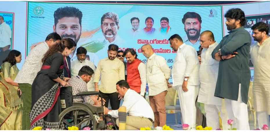
ప్రణామ్ కార్యక్రమంతో వృద్ధులను ఆదుకోవాలనే నిర్ణయం తల్లిదండ్రులను నిర్లక్ష్యం చేసే ప్రభుత్వ ఉద్యోగుల జీతాల్లో 15 శాతం కోత 'బాల భరోసా' పథకం, 'ప్రణామ్' డే కేర్ సెంటర్ల ప్రారంభంలో సిఎం రేవంత్

హైదరాబాద్, జనవరి 12 : విద్యార్థులకు మానవీయ కోణంలో సహకారం అంది స్తున్నామని తెలంగాణ సిఎం రేవంత్ రెడ్డి అన్నారు. ప్రజాభవన్ లో జరిగిన కార్యక్రమంలో 'బాల భరోసా' పథకం, 'ప్రణామ్' డే కేర్ సెంటర్లను ప్రారంభించారు. ఈ సందర్భంగా ప్రత్యేక ప్రతిభావంతులకు సహాయ ఉపకరణాలను