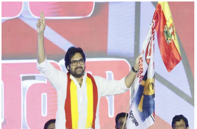
సాధ్యమవుతుందని తెలిపారు. తాను ఒక కులం కోసం ఆలోచించి ఉంటే.. ఆ కుల నాయకుడిని అయ్యేవాడినని.. కానీ ప్రజా నాయకుడిని అవ్వాలని రాజకీయాల్లోకి వచ్చానని ఆయన

విశాఖపట్నం: ఏదో ఒక రోజు జనసేన జాతీయ పార్టీగా మారుతుందని ఏపీ డిప్యూటీ సీఎం పవన్ కల్యాణ్ అన్నారు. కార్యక్రమం అందగా ఉంటేనే ఇది సాధ్యమవుతుందని ధీమా వ్యక్తం చేశారు. 'సేనతో సేనాని' పేరుతో విశాఖపట్నంలో ఏర్పాటుచేసిన విస్తృతస్థాయి సమావేశంలో పార్టీ శ్రేణులకు పవన్ కల్యాణ్ దిశా నిర్దేశం చేశారు. ఈ సందర్భంగా పవన్ కల్యాణ్ మాట్లాడుతూ.. పార్టీ సంస్కార నిర్మాణంపై కనరత్న చేస్తున్నామని తెలిపారు. మండల స్థాయి నుంచి కమిటీలను తానే స్వయంగా సమన్వయం చేస్తానని తెలిపారు. మహారాష్ట్ర, కర్ణాటక, ఒడిశా, తమిళనాడు రాష్ట్రాల్లో కూడా జనసేన పార్టీని విస్తరించాలని అంటున్నారని పవన్ కల్యాణ్ తెలిపారు. తాను పార్టీని విస్తరించాలంటే ముందు మీరు పోరాటం చేయండిని విలుపునిచ్చారు. మీకు అందగా సైద్ధాంతిక బలం ఇస్తానని.. మీరు బలోపేతం చేస్తే కచ్చితంగా ఒకరోజున జనసేన జాతీయ పార్టీగా ఎదుగుతుందని ధీమా వ్యక్తం చేశారు. జనసేన జాతీయ పార్టీ అవుతుందని ఈరోజు అంటే అది హాస్యాస్పదంగా ఉండొచ్చు కానీ.. ప్రజలందరూ కలిసి వస్తే అది కచ్చితంగా