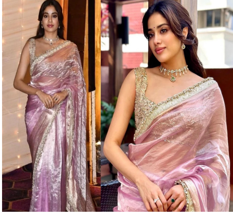
ఒకరికి సపోర్ట్ గా ఉంటారు. సందర్భాలను బట్టి ఈ సపోర్ట్ మారుతూ ఉంటుంది. ఈ విధంగా నా బిడ్డలందరికీ ఒక తోడు, సపోర్టు దొరుకుతుంది’ అని జాన్వీ చెప్పుకొచ్చింది. కాగా జాన్వీ కపూర్ తన పెళ్లి, భర్త గురించి మాట్లాడటం ఇదే మొదటిసారి కాదు. గతంలో బట్టి ఈ సపోర్ట్ మారుతూ ఉంటుంది. ఈ విధంగా నా బిడ్డలందరికీ ఒక తోడు, సపోర్టు దొరుకుతుంది’ అని జాన్వీ చెప్పుకొచ్చింది.

ప్రస్తుతం పెళ్లి చేసుకున్నవారు ఒకరు లేదా ఇద్దరు పిల్లలు చాలా అంటున్నారు. అంతకు మించి అనలు ఆలోచనే లేదంటున్నారు. అయితే బాలీవుడ్ అందాల తార జాన్వీ కపూర్ మాత్రం చాలా డిఫరెంట్ గా ఆలోచిస్తోంది. శ్రీదేవి నట వారసురాలిగా ధడ్కే సినిమా తో హీరోయిన్ గా బాలీవుడ్ ఇండస్ట్రీకి పరిచయమైంది జాన్వీ. ఆ తర్వాత పలు సూపర్ హిట్ సినిమాలతో తల్లికి తగ్గ తనయ అనిపించుకుంటోంది. ఎన్టీఆర్ తో కలిసి దేవద సినిమాతో తెలుగు అడియన్స్ ను కూడా పలకరించింది అందాల తార. ప్రస్తుతం గ్లోబల్ స్టార్ రామ్ చరణ్ తో కలిసి పెద్ది అనే సినిమాలో నటిస్తోంది. కాగా జాన్వీ నటించిన లేట్స్ట్ సినిమా పరం సుంది. సిద్ధార్థ్ మల్లోతా ఇందులో హీరోగా నటించారు. ఆగస్టు 29వ తేదీన ఢిల్లీలో రిలీజైన ఈ సినిమాకు పాజిటివ్ టాక్ సొంతం చేసుకుంది. తాజాగా ఈ సినిమా ప్రమోషన్లలో పాల్గొన్న ఆమె తన పర్సనల్ అండ్ ప్రొఫెషనల్ లైఫ్ గురించి పలు ఆసక్తికర విషయాలు పంచుకుంది. ఇదే సందర్భంగా తన పెళ్లి, పిల్లల గురించి ఇంట్రెస్టింగ్ కామెంట్స్ చేసింది. ప్రస్తుతం ఈ వ్యాఖ్యలు నెట్టింట్ వైరలవుతున్నాయి. నేను పెళ్లి చేసుకున్న తరువాత ముగ్గురు పిల్లలను కావాలి అనుకుంటున్నాను. ఎందుకంటే మూడు నాలుగో పిల్లలే? అంతేకాదు నా పిల్లల్లో ఇద్దరు గౌడవ పడుతున్నప్పుడు, మూడో బిడ్డ వాళ్లలో