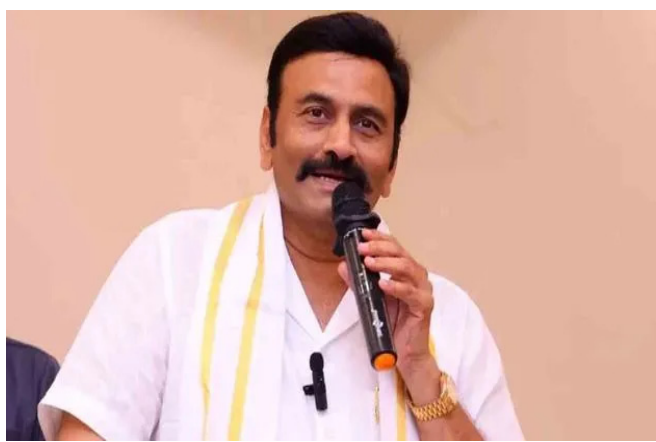
చురకలంటించారు. భీమవరంలో స్థలం లేదని జిల్లా పార్టీ ఆఫీసు ఉండిలో కట్టారా? అని ప్రశ్నించారు. ఇంతకీ ఏం జరిగిందంటే.. వైసీపీ ప్రభుత్వ హయాంలో జిల్లాల పునర్విభజన జరిగింది. అందులో భాగంగా పశ్చిమ గోదావరి జిల్లా కేంద్రంగా

భీమవరం, ఆగస్టు 31: పశ్చిమ గోదావరి జిల్లా కలెక్టరేట్ నిర్మాణంపై ఏపీ డిప్యూటీ స్పీకర్ కె. రఘురామకృష్ణరాజు కీలక వ్యాఖ్యలు చేశారు. ఆదివారం రహదారిపై నిలబడి భీమవరం బోర్డు, పెద అమిరంలోని స్థలాన్ని డిప్యూటీ స్పీకర్ రఘురామకృష్ణరాజు వేలు పెట్టి చూపించారు. అనంతరం ఆయన మాట్లాడుతూ.. మూడు రాజధానులకంటే వాళ్లు అభిలషక సమావేశమని రాధాంతం చేశారంటూ మండిపడ్డారు. ఏకాదిన్నరగా దీని గురించి మాట్లాడిన వారు లేరన్నారు. రెండు లక్షల నలభై వేల ఎస్ఎఫ్డీతో అన్ని ఆఫీసులు ఉండేలా ప్లాన్ సైతం తాను ప్రభుత్వానికి సమర్పించానని ఈ సందర్భంగా ఆయన గుర్తు చేశారు. అన్ని నియోజకవర్గాలకు ఈ స్థలం ఉత్తమంగా ఉందని ప్రపోజల్ ఇచ్చామని చెప్పారు. దీనిపై వైసీపీ వేర్పాటు. మీటింగ్ పెట్టి ఆందోళన చేస్తామని నిర్బంధించారని పేర్కొన్నారు. మీరు మూడు రాజధానులు అన్నారు. కానీ తాను ఒక రాజధాని అని ప్రకటించాను తెలిపారు. అబద్ధాలు చెప్పి రుకీకాండ్ కోట్లనే ప్యాల్సెన్ కట్టారని వ్యంగ్యంగా అన్నారు. రాజధాని రుకీకాండ్లోనే ఉండాలి.. ముఖ్యమంత్రి అందులోనే ఉండాలని ఆందోళన చేసుకొండంటూ వైసీపీ నేతలకు