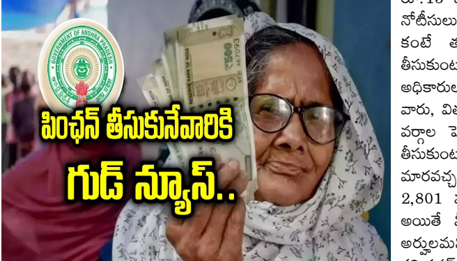
ఒక్కరికి కూడా పెన్షన్ అవబోమని.. అలానే అసర్దులను తొలగించేందుకే నోటీసులు ఇచ్చామని తెలిపింది. నోటీసులు జారీ చేసిన వారిలో.. వికలాంగుల పంచె తీసుకుంటున్న వారిలో కొందరికి వైకల్యం 40 శాతం కంటే తక్కువగా ఉంది. అలాగా, కొందరు అలోగ్యంగా ఉండి కూడా మునుపటి పరిమితమయ్యామని, వీల్చైర్ పరిమితమయ్యామని చెప్పి

అమరావతి : ఆంధ్రప్రదేశ్ లోని ఎస్టీఆర్ భరోసా పంచె పొంది వారికి కూటమి ప్రభుత్వం కీలక అలర్ట్ జారీ చేసింది. అర్హులైన వారికి ఎవరికి కూడా పంచెను అవబోమని ప్రభుత్వం స్పష్టం చేసింది. అర్హులందరికీ సెప్టెంబర్ 1 న ఎస్టీఆర్ భరోసా పంచెను ప్రభుత్వం స్పష్టం చేసింది. కాన్పు రోజుల క్రితం కూటమి ప్రభుత్వం.. ఎస్టీఆర్ భరోసా పంచెలో అసర్దులను గుర్తించడానికి నోటీసులు జారీ చేసిన సంగతి తెలిసింది. వికలాంగుల పంచెలో 40 శాతం కంటే తక్కువ వైకల్యం ఉన్నవారికి, అలోగ్యంగా ఉండి కూడా రూ.15 వేలు పొందుతున్న వారికి ప్రభుత్వం నోటీసులు పంపింది. ప్రకాశం జిల్లా మొత్తం మీద 2,801 మందికి పంచె రద్దు నోటీసులు అందజేశారు. అయితే నోటీసులు పొందిన వారిలో ఎవరైతే అప్లై చేసుకుంటారో వారికి పంచె అందుతుంది. అలానే అర్హులైన అన్ని కేటగిరిల వారికి కూడా పంచెను అందుతాయని ప్రభుత్వం తెలిపింది. ఈ క్రమంలో సచివాలయాల ద్వారా నోటీసులు అందుకున్న వారికి సెప్టెంబర్ నెలలో పెన్షన్ నిలిపివేయడం ప్రచారం జరగడంతో.. లబ్ధిదారులు ఆందోళన చెందారు. సెప్టెంబర్లో పంచె ఆగిపో తుండేమోనని భయపడ్డారు. అయితే దీనిపై ప్రభుత్వం క్లారిటీ ఇచ్చింది. అర్హులైన వారిలో