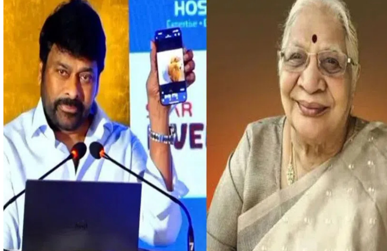
అయితే వాళ్లు రెడీగా ఉంటారు వస్తారు అని చెప్పడంతో నేను వెంటనే అరవింద్ కు కాల్ చేసి ఇలా ఇవ్వాలి అని అనుకుంటున్నాను అని చెప్పాను. నాకు అత్తమ్మమాట్లాడుతూ, “అత్తగారు కన్నుమూశారని గారికి, మా అమ్మ గారికి మధ్య ఒక సారి ఇదే విషయంపై చర్చ జరగగా, అప్పుడు ‘మీరు ఇస్తారా’ అని అడిగారు. కాలి బూడిద అయ్యే శరీరానికి చచ్చిపోయాక ఏం చేస్తారు అలాగే నీ ఇష్టం ఇచ్చేద్దాం అన్నారు. ‘అవయవదానం గురించి మా అత్తమ్మ ఎక్కడా సంతకం చెప్పలేదు కానీ నాకు ఆ మాటే ప్రతిజ్ఞ కానియోడుతున్నాను.