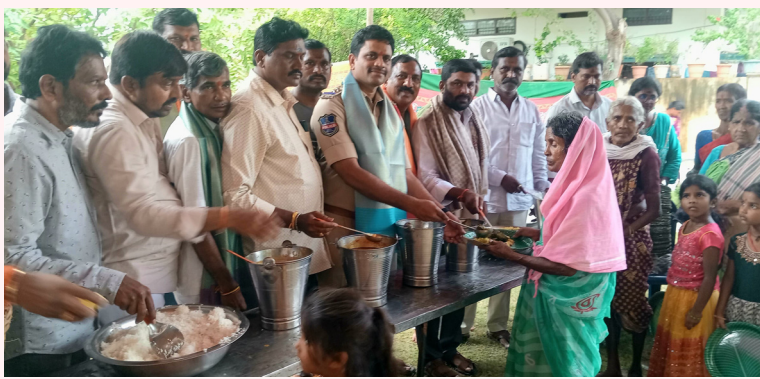
టవే తెలంగాణ స్వస్థ సూర్యాపేట