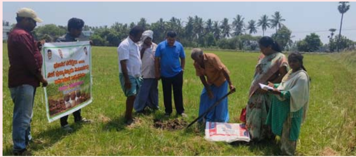
కోటపల్లి గూడూరు స్వర్ణ సాగరం ఏప్రిల్ 23