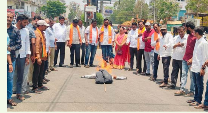
కామారెడ్డి జిల్లా ప్రతినిధి ఏప్రిల్ 23