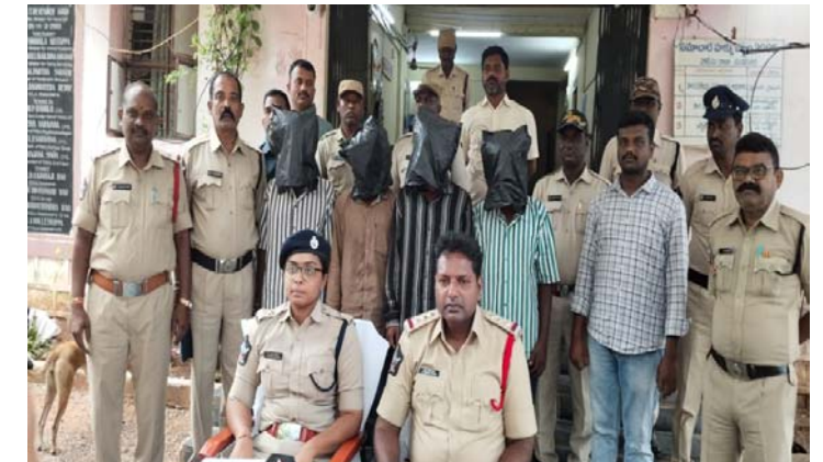
మడకశిర స్వర్ణ సాగరం ఏప్రిల్ 23