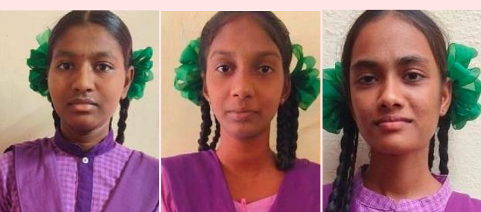
కోటపల్లి గూడూరు స్వర్ణ సాగరం ఏప్రిల్ 23