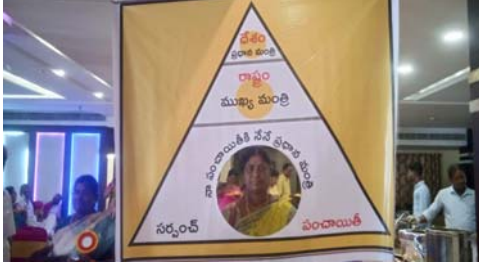
గణనీయంగా మారిన గ్రామ రూపురేఖల గురించి

బాల ,ఏప్రిల్ 22 స్వచ్ఛ సాగరం : స్వచ్ఛ చల్లపల్లి గ్రామాన్ని మహిళా సర్పంచులు తో కలిసి బాల మండలం నాంపల్లి సర్పంచ్ స్వచ్ఛ సందర్శించారు. ఆర్థిక సమత మండలి ప్రాజెక్ట్ డైరెక్టర్ సి హెచ్ నేతృత్వంలో మదనపల్లికి చెందిన ఫౌండేషన్ ఎకలాజికల్ సెక్యూరిటీ సంస్థ ద్వారా అనంతపురం చిత్తూరు జిల్లాలకు చెందిన 30 మంది మహిళా సర్పంచులు చల్లపల్లి వెళ్లారు. దశాబ్ద కాలంగా చల్లపల్లిలో జరుగు తున్న స్వచ్ఛ ఉద్యమని,