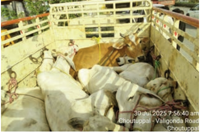
చౌటుప్పల్ జూలై 30 (సాక్ష్యం) చౌటుప్పల్ పట్టణ కేంద్రంలోని వలిగిండ్ల చౌరస్తా లో అక్రమంగా