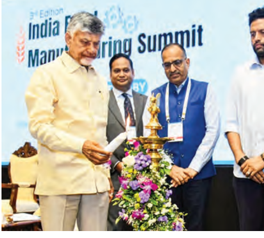
చంద్రబాబు నాయుడు ప్రకటించారు. విశాఖలో డేటా సెంటర్, సీ కేబుల్ ఏర్పాటు- కాబోతున్నాయని, ఈ కేబుల్ ద్వారా విశాఖ ప్రపంచంతో అనుసంధానం అవుతుందని తెలిపారు. అలాగే మహిళలకు సురక్షితమైన నగరంగా విశాఖపట్టణం ఎంపి-కె-ఎం ది గుర్తు చేశారు. ఈ విశాఖ నగరం.. ఢిల్లీ, ముంబై, బెంగళూరు, చెన్నై నగరాలతో పోటీ- పడుతోందని వివరించారు. మహిళలకు విశాఖ సురక్షిత నగరంగా మారందని.. ఇది మనమంతా గర్వపడే అంశమని ఆయన పేర్కొన్నారు. ఇక ఈ ఎలక్ట్రిక్ డబుల్ డెక్కర్ బస్సులో ప్రయాణించారు. ప్రయాణం చేసే వర్కాటకుల సౌలభ్యం కోసం నగం మొత్తాన్ని ప్రభుత్వం ధరిస్తుందన్నారు. రూ. 250 కోట్ల 24 టెక్నాలజీ హబ్ గా విశాఖపట్టణం నగరం ఎదుగుతోందన్నారు. విశాఖపట్టణం ఆర్థిక రాజధానిగా, ఆసియా టెక్నాలజీ హబ్ గా ఎదగబోతోందని విశ్వాసం వ్యక్తం చేశారు.

చీఫ్ మినీస్టర్ వచ్చే రాష్ట్రం ఏపీ మాత్రమే అని వివరించారు. హార్దికల్, డివై స్టాక్, ఆక్సాకల్టర్ రంగాల్లో ఏపీ అగ్రస్థానంలో ఉంది. దేశంలోని పండ్ల ఉత్పత్తిలో 25 శాతం ఏపీ నుంచే ఉన్నాయి. రాష్ట్రంలో 2.26 లక్షల హెక్టార్లలో ఆక్సాకల్టర్ కొనసాగుతోంది. డివై స్టాక్ అఫ్ ఇండియా అండ్ ప్రదేశ్ ప్రసిస్టి గాంచింది. ఆక్సా కోడిగూడల ఉత్పత్తిలో ప్రథమ స్థానంలో ఉంది. రాష్ట్రంలో 9 ఇండిగ్రెటెడ్ ఫుడ్ ప్రొసెసింగ్ పార్కులు ఉన్నాయి. ఈజ్ ఆఫ్ డూయింగ్ బిజినెస్ లో ప్రథమ స్థానంలో ఉన్నాయి. 2027 నాటికి పోలవరం పూర్తి చేసి జాతికి అంకితం చేస్తాం. రాష్ట్రంలో ఇప్పటికే 85 శాతం రిజర్వాయర్లు నిర్మాణం. ఏపీలో కోల్డ్ స్టోరేజీల సామర్థ్యం 17 లక్షల మెట్రిక్ టన్నులకు చేరింది. ప్రతి 50 కిలోమీటర్లకు ఒక పోస్ట్ ఛాప్లన్ 20 కిలోమీటర్ల నిర్మాణం. ప్రతి అసెంబ్లీ నియోజమవర్గంలో ఒక చంద్రబాబు చెప్పారు. మహిళలకు సురక్షిత నగరంగా విశాఖ ఎంపీకి కావడం రాష్ట్ర ప్రజలందరికీ గర్వకారణమని సీఎం తెలిపారు. ఢిల్లీ, ముంబై, బెంగళూరు, చెన్నై వంటి మెట్రో నగరాలతో పోటీ- పడుతూ విశాఖ మహిళలకు సురక్షిత వీరునామాగా మారందని పేర్కొన్నారు.