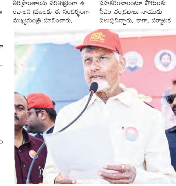
ప్రపంచ పర్యాటకుల్ని ఆకర్షించేలా ఈ బీచ్ ను నిర్వహించేందుకు శాఖ ఆధ్వర్యంలో ఈ డబుల్ డెక్కర్ బస్సులు నడపనున్నారు.

అక్కడ బీచ్ నుంచి తోట్లకొండ వరకు బీచ్ రోడ్డులో ఈ బస్సులు తిరగనున్నాయి. మొత్తం 16 కిలోమీటర్ల మేర పర్యాటక ప్రాంతాల్లో ఈ ఎలక్ట్రిక్ డబుల్ డెక్కర్ బస్సులు ప్రయాణించనున్నాయి. 24 గంటల పాటు- ప్రయాణించేలా టిఆర్ ఛార్జి రూ.5000 నిర్ణయించారు. అయితే పర్యాటకుల సౌలభ్యం కోసం అందులో సగం మొత్తాన్ని రాష్ట్ర ప్రభుత్వం భరిస్తుంది. విశాఖలో పర్యాటకానికి మరింత ఆకర్షణ జోడిస్తూ డబుల్ డెక్కర్ బస్సులను ప్రభుత్వం ఏర్పాటు- చేసింది. విశాఖ బీచ్ రోడ్డులో హాప్ ఆన్ - హాప్ ఆఫ్ డబుల్ డెక్కర్ పర్యాటక బస్సులను ముఖ్యమంత్రి నారా చంద్రబాబు నాయుడు ఇవాళ జెండా ఊపి ప్రారంభించారు. అక్కడ బీచ్ నుంచి తోట్లకొండ వరకు 16 కిలోమీటర్ల మేర పర్యాటక ప్రాంతాల్లో తిరగనున్న ఈ ఎలక్ట్రిక్ డబుల్ డెక్కర్ బస్సుల్లో స్వయంగా ప్రజా ప్రతినిధులతో కలిసి సీఎం చంద్రబాబు ప్రయాణించారు. బస్సు నుంచే బీచ్ లో ఉన్న పర్యాటకులకు అభివాదం చేశారు. పర్యాటకులకు కొత్త అనుభవం కలిగిలా ఈ బస్సులో ప్రయాణం ఉంటుందని సీఎం అన్నారు. ప్రత్యేకంగా పర్యాటకుల కోసం అందుబాటులోకి వచ్చిన ఈ బస్సులు 24 గంటల పాటు ఒకే టిఆర్ఓ ప్రయాణించే సౌకర్యం కల్పించనున్నాయి. పోరులు, పర్యాటకులు పర్యావరణ హితంగా ప్రవర్తించాలని, తీర ప్రాంతాలను పరిరక్షణగా ఉంచాలని పిలుపునిచ్చారు. విశాఖ బీచ్ లను ప్రపంచ స్థాయి పర్యాటక ప్రాంతాలుగా తీర్చిదిద్దేందుకు పోరులు ఇవాళ జెండా ఊపి ప్రారంభించారు. అక్కడ బీచ్ నుంచి తోట్లకొండ వరకు 16 కిలోమీటర్ల మేర పర్యాటక ప్రాంతాల్లో